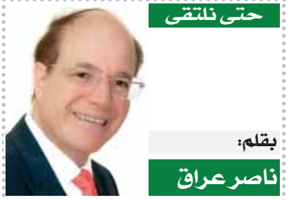
بقلم: ناصر عراق