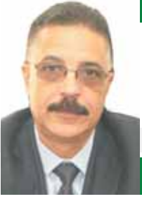
بقلم: سامي أبو العز