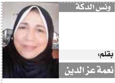
يقلم: نعمة عز الدين

عنوان أساسي جاء العنوان الفرعي مؤكداً توجهه وغايته (سوسيولوجيا المتخيل السردى) وهو عنوان يهدف إلى دراسة البعد الاجتماعي في علاقته بالبعد الجمالي كما تدل صياغته.