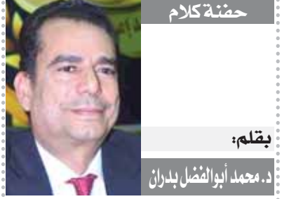
يقلم: د. محمد أبو الفضل بدران