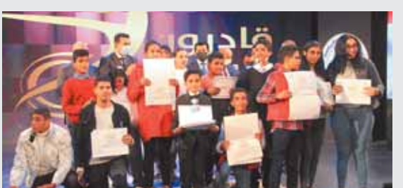
وزير الرياضة يكرم الفائزين على تنظيم احتفالية «قادرون» باختلاف،