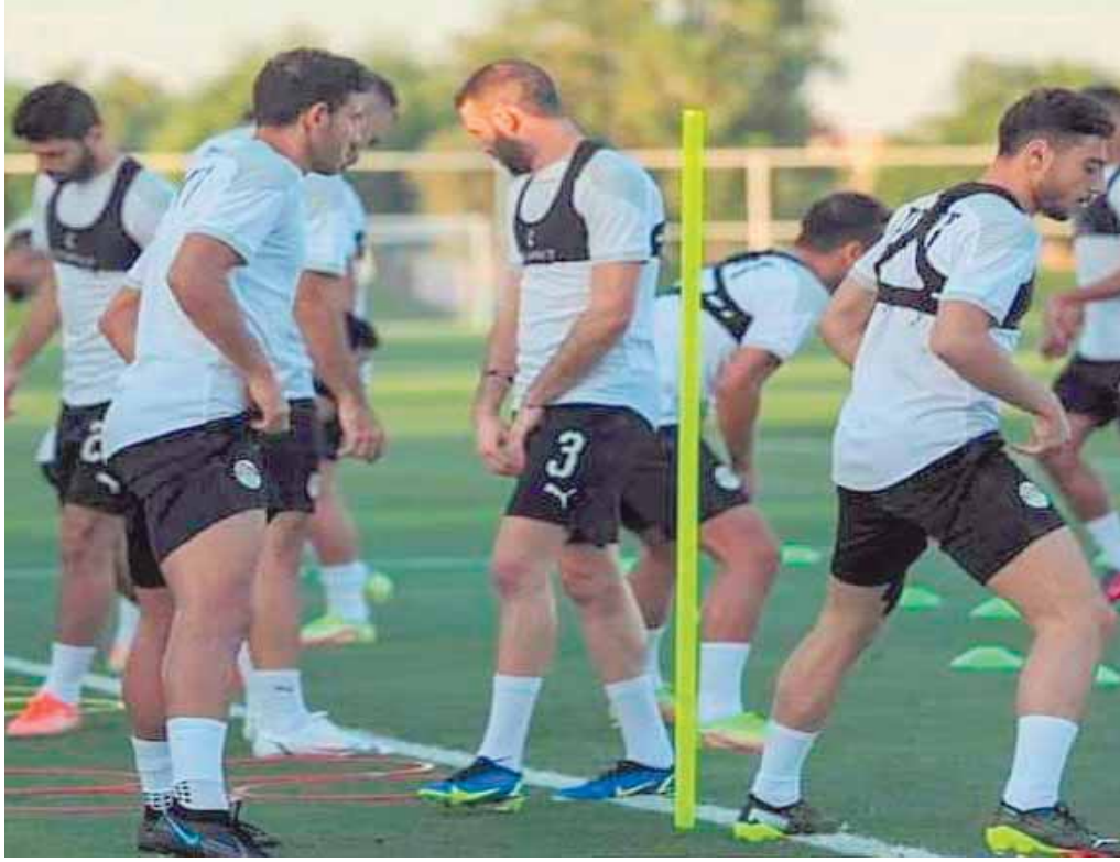
المنتخب يستعد بقوة لمواجهة تونس

على الجانب الآخر، يسير منتخب تونس بشكل جيد فى التحضيرات للفراعنة تحت قيادة مديرة الوطنية منذر الكبير، حيث شهدت التدريبات الجماعية انضمام المدافع على معلول، الذى تدرّب مع بقية اللاعبين أمس بصفة عادية، بعدما تماثل للشفاء التام من الإصابة، التى حرمتها من المشاركة أمام سوريا والإمارات وعمان. كما أعلن الاتحاد التونسي، أن منتصر الطالبي، مدافع وروين كازان الروسي، سينضم لتشكيلة النسور أمام مصر، بعد وصوله أمس إلى قطر مع وصول منتخب بلاده للدور النهائي حيث كان الاتفاق قبل انطلاق البطولة مع النادي الروسي أن يلتحق بالمنتخب إذا وصل للأدوار النهائية.