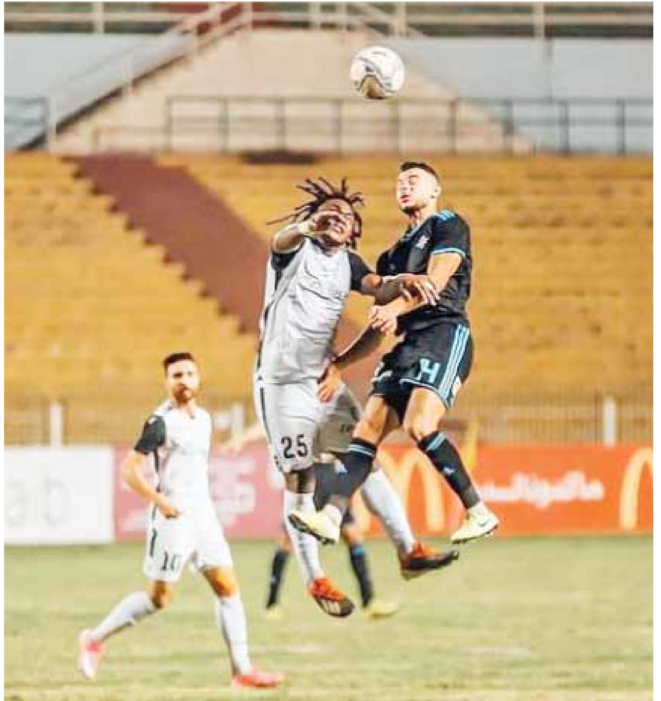
الدورى الجديد سيشهد حالة كبيرة من الانضباط