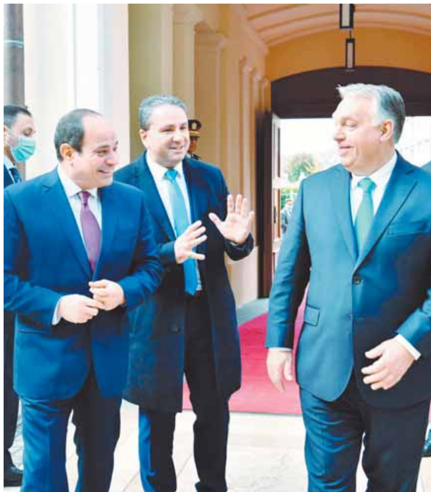
فيكتور أوربان رئيس وزراء المجر خلال استقباله للرئيس السيسي

العدد: ١٩٢٩ الخميس ١٤ أكتوبر ٢٠٢١ م - ٧ من ربيع أول ١٤٤٣ هـ - ٤ بابة ١٧٢٨ السنة: ٢٨ ثلاثة جنيهاً ١٢ صفحة تصدر عن حزب الوفد المصري