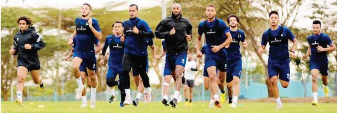
جديدة فى تدريبات الزمالك استعداداً لـ توسكر»