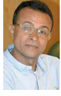
خيرى حسن يكتب؛