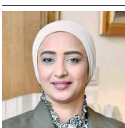
بقلم: أميرة أبوشقة

ولكن هذا العام تخطى الواقع، مشيدة بوجود هذا العدد الكبير الذي يتعدى الـ ١٥٠٠ عارض منتجته ٧٠٪ منهم سيدات مشاركات، على عكس كل عام والذي يبلغ ٥٠٠ عارض، مشيدة على أن وراء كل سيدة قصة نجاح وكفاح، مؤكدة سعادتها لمشاركتهم بهذه المبادرة، وفخورة بوجود المرأة المصرية وقوتها. ورحبت جامع، بحضور الوزيرات وزوجات الوزراء أول عرض أزياء تراثي والذي يقام على هامش معرض تراثنا، كمبادرة من الفنان هاني البحيري، لدعم الذوق والصناعة المصرية، من خلال مساعدة أصحاب المشروعات الصغيرة، ممن لديهم هذا النوع من فن صناعة الملابس التراثية المصرية، للخروج بمنتج عصري يوازي المنتجات العالمية، مؤكدة أن عرض الأزياء يمثل استمراراً لمبادرة جهاز تنمية المشروعات النهوض بالحرف اليدوية والتراثية وتطويرها لتتناسب مع الاحتياجات العصرية والأذواق المحلية والعالمية، بما يعزز قدرتها على التنافسية مع بيوت الأزياء العالمية، حيث إن المنتج المصري يوازي الكثير والكثير من المنتجات التي تتميز بالتراث والعرق المصري، خاصة واستحالة أي شخص تقليدها، مزج ما بين الفنون القادمة بين كل محافظات الجمهورية، ولا أريد أن