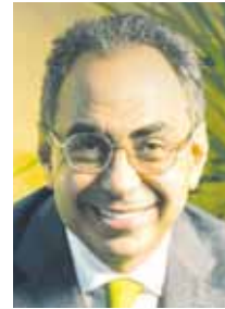
بقلم: د. هاني سري الدين