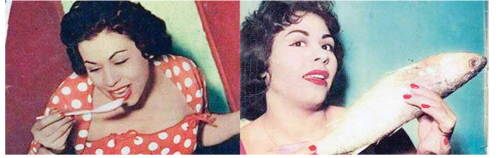
المزيد من الأخبار والتقرير المصورة ALWAFD.NEWS