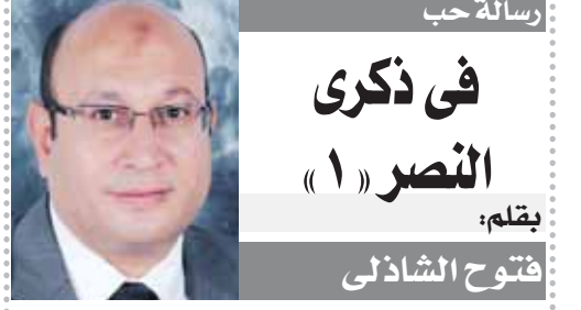
رسالة حب في ذكرى النصر (١) بقلم: فتوح الشاذلى

نعيش هذه الأيام ذكرى النصر العظيم.. ذكرى معركة الكرامة والشرف.. ذكرى حرب أكتوبر التي غيرت مجرى التاريخ وحضرت لأبطال مصر البواسل مكانة في سجل الأبطال.. وأعدت للعسكرية المصرية هيبتها وتبوات مكانها الطبيعي وسط الجيوش الكبيرة. وعندما نتحدث عن حرب أكتوبر فإن هناك ثوابت راسخة لا يمكن أن نتجاهل أي منها أو نتجهد عنها أبداً.. أول هذه الثوابت أن النصر كان من عند الله ويتوفيق منه.. هذا ما أكد أبطال العبور للزميل محمد صلاح في الحوارات التي نشرتها «الوفد» في ذكرى العبور.. قالوا إن صيحة الله أكبر كانت الشرارة التي أشعلت حماس الجنود، وتحت صيحة الله أكبر لجميع المقاتلين اقتحمت قواتنا الضفة الشرقية على طول المواجهة في ٥ رؤوس كبارى ومجور بورسعيد بواسطة ٧٥٠ قارباً مطاطياً و ١٥٠٠ سلم خشبي.. لقد تسلح جنودنا بالإيمان والصبر وخاضوا المعركة وهم صائمون فكان النصر حليفنا. ومن الثوابت في هذه الحرب أن الرئيس أنور السادات كان صاحب قرار المعركة.. لم يتردد ولم يتراجع.. واتخذ القرار بكل شجاعة وحكمة.. كان داهية في الحرب.. وداوية في السياسة.. أصلح ما أفسده سلفه.. أعد للحرب عدتها من أول يوم تولى فيه المسئولية.. وأعاد الثقة لجنودنا وقواتنا المسلحة بعد الهزيمة التي تسبب فيها عبدالناصر وأعدائه الذين خدعوا الشعب وكسروه.. ودخلوا حرباً ليسوا أهلاً لها.. فقد كانوا غارقين في التسلسل ومزقهم الخلافات.. والغريب أنهم لم يتواروا خجلاً بعد الهزيمة وإنما ضحكوا على الشعب بتمثيلية التنحى وبرأوا الزعيم المهمل رغم أنه المسئول الأول عن هذه التكلفة.