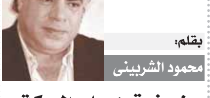
صوك في آخر النطق

ستتجلى الأمور في موضوع الميكروباص بكل تأكيد خلال أيام أو ساعات، والمهم هو الوصول للحقيقة في هذه الواقعة حتى لا تتكرر مرة أخرى بهذا الشكل الساخر.