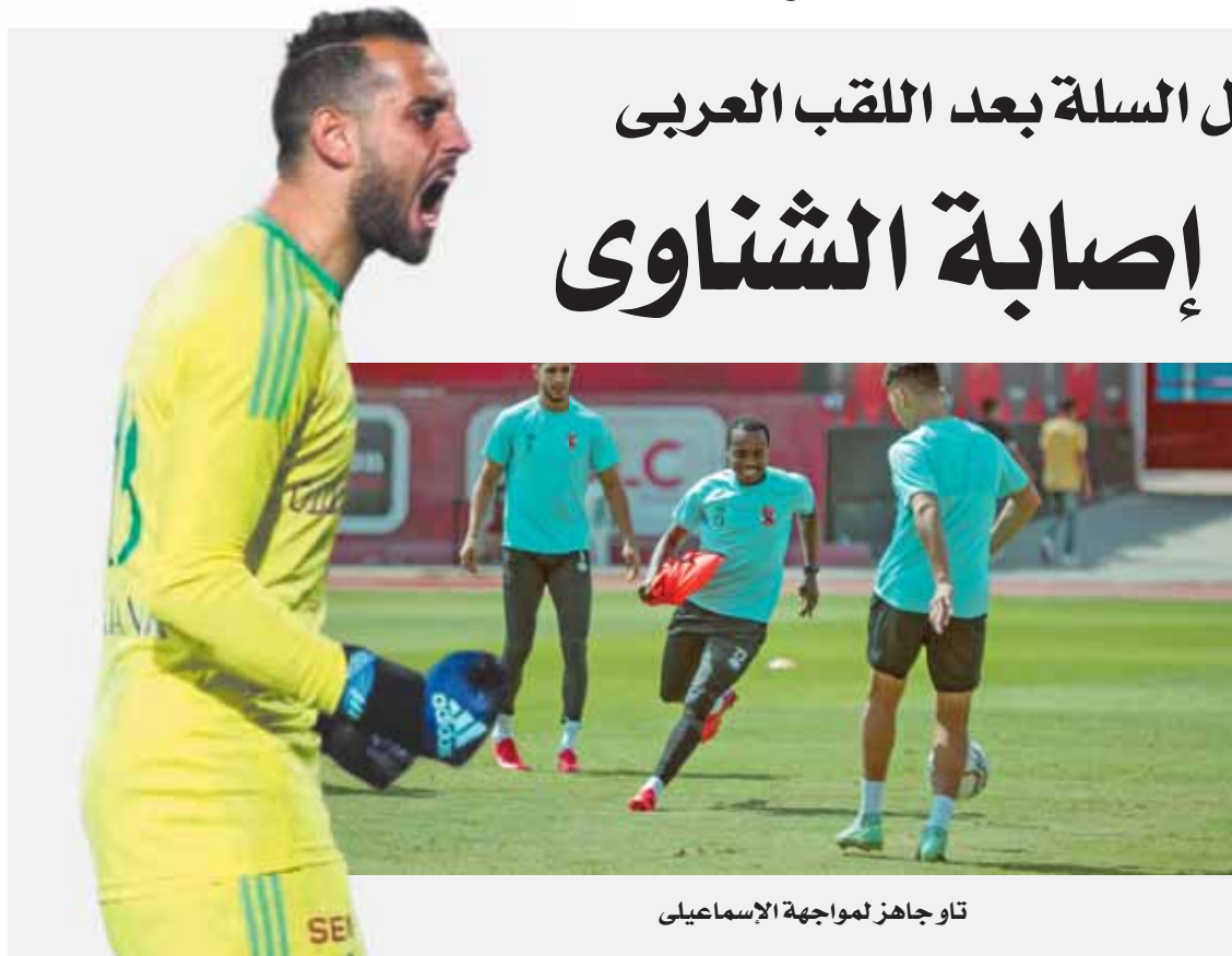
تاو جاهز لمواجهة الإسماعيلى