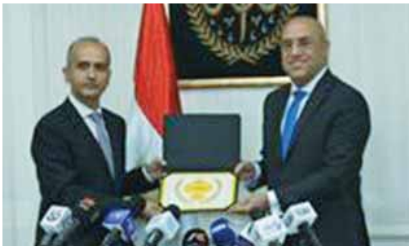
وزير الإسكان يتسلم الجائزة

وأشار الدكتور عرفان على، إلى أنه تم اختيار هيئة المجتمعات العمرانية الجديدة التابعة لوزارة الإسكان والمرافق والمجمعات العمرانية بمصر، لدورها المحورى فى تنفيذ برنامج الإسكان الاجتماعى فى مصر والذى قدم ٦٦٠ ألف وحدة لضمان توفير عادل للسكن اللائق من حيث الموقع، والاتصالية، والقدرة على تحمل التكاليف، والخدمات مثل المدارس والمستشفيات