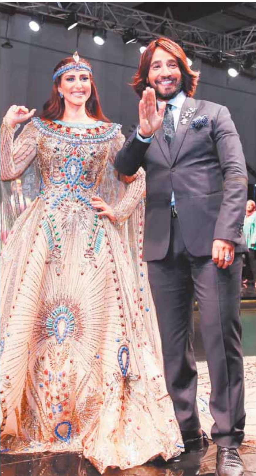
طبع بمطابع «الأخبار»

إذا كانت مصر قد عانت سابقاً بشدة من قضايا الفساد التي تجذرت في قطاعات كثيرة في الدولة، وصارت عرفاً سائداً بين بعض شرائح المجتمع، وانتهت إلى فساد كبير في قطاعات مثل المحليات والتعليم والصحة وغيرها من القطاعات الخدمية، وهو ما نتج عنه تفتش ظواهر اجتماعية كلفت ميزانية الدولة مئات المليارات مثل المناطق العشوائية، وتراجع شديد في مستوى التعليم وتفتش بعض الأمراض الوبائية مثل فيروس C ووصل الفساد ذروته في الجانب السياسي عندما تمت مصادرة الحياة النيابية لحساب فضيل سياسي واحد، واستشعر الشعب أنه لم يعد له صوت حقيقي في مواجهة الحكومة سواء مركزياً أو على مستوى المحافظات والأقاليم، وتحولت كثير من الوظائف إلى وراثة وحكر على العاملين بها.. وغيرها من العوامل التي ساهمت في الانفجار الشعبي في ٢ يناير وأعطت الفرصة للجماعة الإرهابية لاختطاف السلطة ومحاولة اختطاف الوطن بأسره لولا وعى الشعب المصري الذي انتفض في ثورة شعبية عارمة وجارفة في ظل حماية قواته المسلحة التي تتحاز دائماً للشعب وشرطته الوطنية الباسلة.