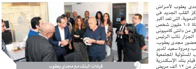
قيادات البنك مع مجدى يعقوب

دعم في المركز وغيره من المؤسسات. وأضاف الدكتور مجدى يعقوب، رئيس مجلس أمناء مركز القلب بأسوان وخبير جراحات القلب، «يسعدنى أن أعرب لمؤسستكم المصرفية العريقة عن عميق الشكر والامتنان على مساندتكم المستمرة للجهود الخيرية للمؤسسة في مركز أسوان للقلب، وذلك في إطار التعاون بين مؤسسة مجدى يعقوب وبنك الإسكندرية في مجال تقديم المساعدات الإنسانية والصحية. وأوضح لىلى حسنى، رئيس مكتب المسئولية المجتمعية والتميز بالبنك الإسكندرية، «أنه من المتوقع أن يحتوى مركز القلب الجديد على ٥ غرف لتخطيط صدى القلب، وحرصنا على توفير الدعم المادى اللازم لإنشاء إحدى هذه الغرف.