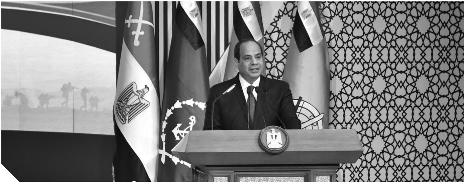
الرئيس يلقى كلمته في الندوة التثقيفية الـ ٢١