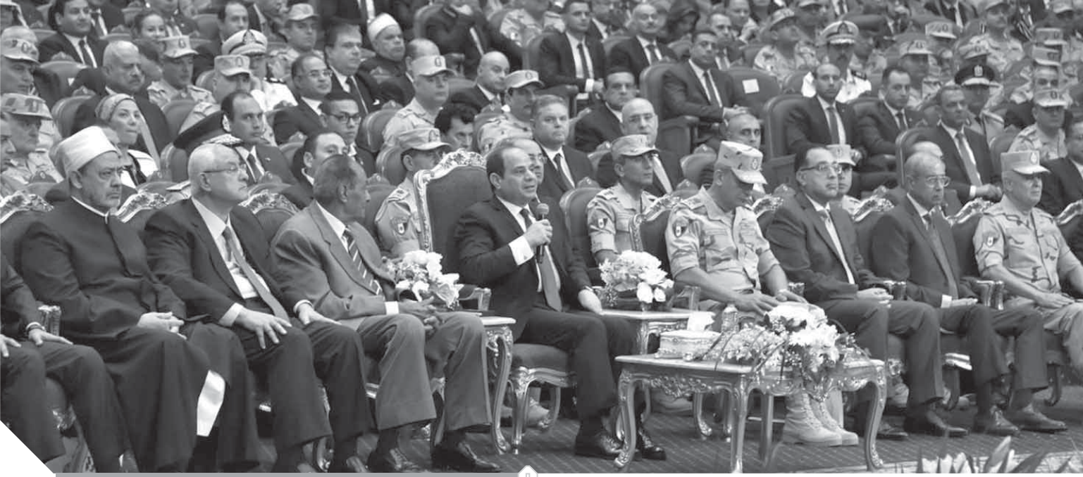
الرئيس في الندوة التحقيقية ويجواره المشير طنطاوى وقيادات الدولة