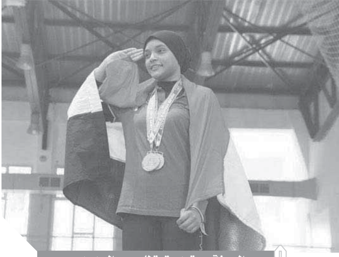
الجودة يستعد بقوة للموسم الجديد