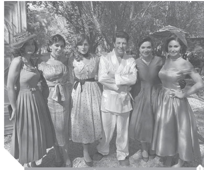
إياد نصار وعدد من نجوم المسلسل

الذي تقدمه إنجي المقدم سيكون «مفاجأة» للجمهور.