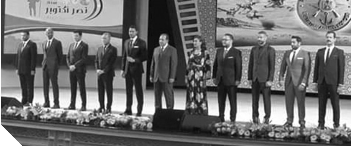
الرئيس يكرم أبطال فيلم «المصر»

وتابع: «أنا مطمئن أوى على الدولة المصرية.. وحد يقولى ليه..؟ انتوا بتصدقوا أن فيه حد يقدر يخدع رينا.. ياترى رينا يساعد الفساد ولا الصالح؟.. رينا مطلع على مصر وأهلها.. إنها بيعسوا من سنين طويلة.. أن مصر شهدت تجلى الله سبحانه وتعالى.. ومصر لها مكانة وشرف.. محدش يقدر يقرب منها.. وهذا يقين.. وليس كل ما يعرف يقال.. الفترة اللي فاتت شهدت إساءة للجيش..