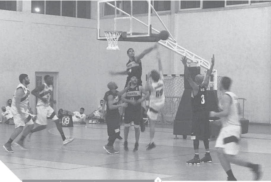
الزمالك خسر أمام مصر للتأمين