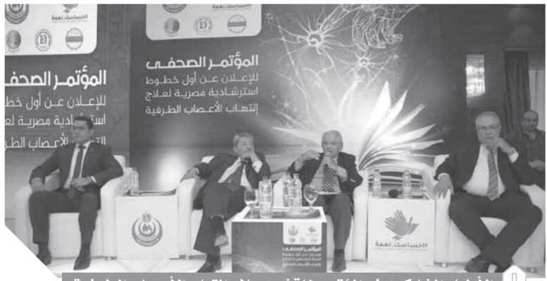
الأطباء المشاركون في المؤتمر يناقشون علاج التهاب الأعصاب الطرفية