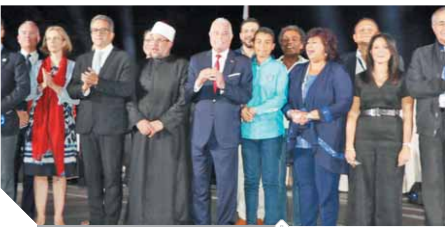
جانب من الاحتفالية الكبرى

بعض وزير الآثار والأوقاف والثقافة والهجرة والتنمية والشباب والرياضة. وأعربت الوزيرة عن تقديرها لجهود محافظ جنوب سيناء لإنجاح الملتقى للعام الخامس، كما قامت وزيرة السياحة ووزير الآثار باصطحاب السفراء الذين حضروا الملتقى في جولة بدير سانت كاترين حيث زاروا كنيسة التجلي ومسجد الأمر بأحكام الله وشجرة العليقة واستمعوا إلى شرح مفصل عن تاريخ الدير والدور المهم الذي لعبه عبر العصور التاريخية المختلفة.