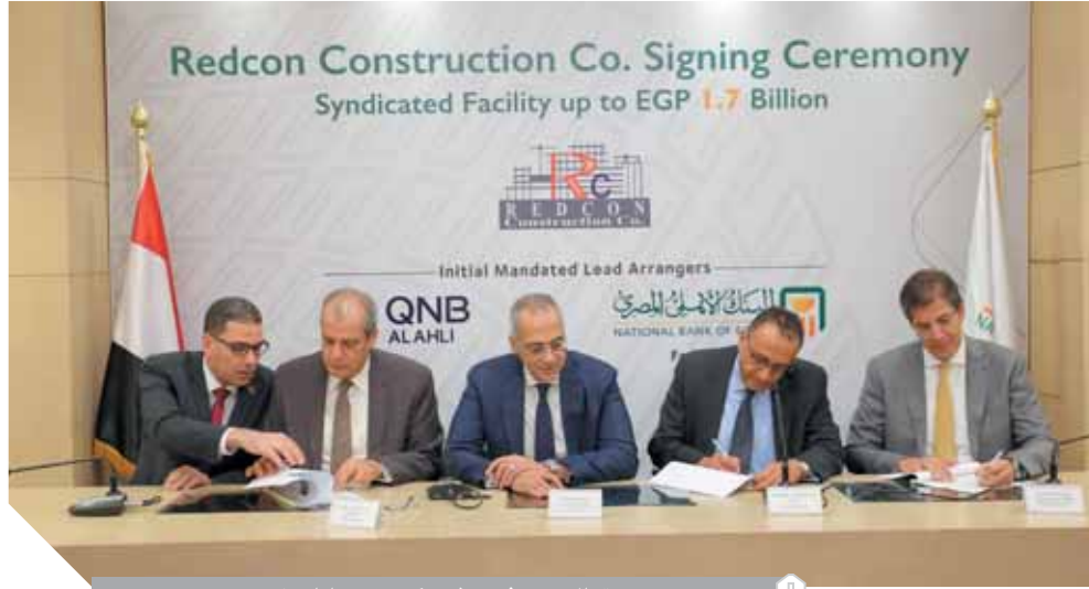
تحالف مصرفى يمول ريدكون بـ ١,٧ مليار جنيه