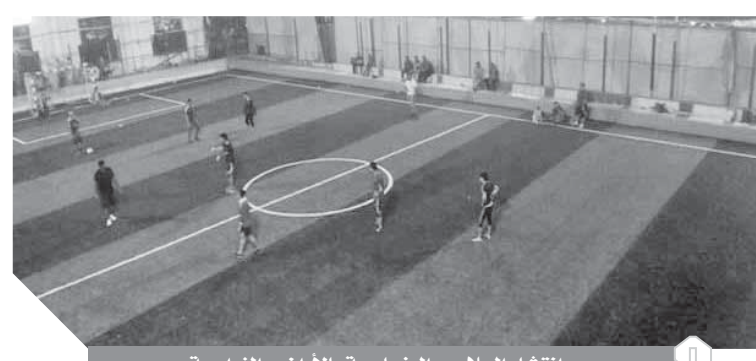
انتشار الملاعب الخماسية بالأراضي الزراعية

وفي الجيرة تحسوت أغلب الرقعة الزراعية إلى ملاعب خاصة، لعمارة لعبة كرة القدم، واضمحلال الرقعة الزراعية، حيث يتم تجهيز مساحة الأرض الزراعية المخصصة، ويلجا البعض منهم إلى سرقه التراب الكبريتاتي ثم يحول إلى نظام الممارسة المعمول به داخل شركات الكبرياء، وسط غياب تام لأجهزة المحليات.