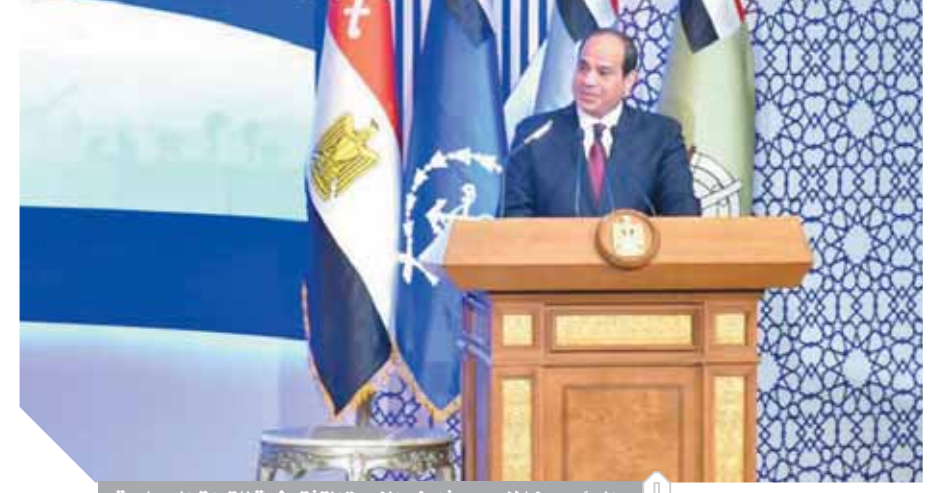
الرئيس خلال حديثه في الندوة التقييضية للقوات المسلحة

لم نهجر أحداً في سيناء والدولة دفعت التعويضات وأقامت المدن الجديدة