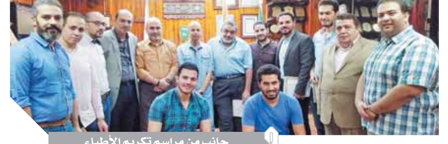
جانب من مراسم تكريم الأطباء