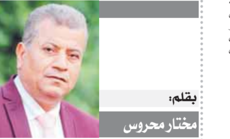
بقلم: مختار محروس

وقد ألقى الرئيس بكلمته، الكرة في ملعب منظمات المجتمع المدني، عندما أعلن العام المقبل، «عاماً للمجتمع المدني في مصر»، فيما يشبه التحدي الجديد، لجمع الكوّنات السياسية والاجتماعية في البلاد، وهو تحدٍ يفرض حماية الاهتمام بإثراء التجربة السياسية المصرية، وعودة الأحزاب من جديد، للقيام بدورها في بناء كوادرها المبردة، والعمل على توسيع دائرة المشاركة والتعبير عن الرأي، في مناخ يجب ألا يخلو من تفاعل خلاق وحوار موضوعي، وتغزير ثقافة حقوق الإنسان في المجتمع، وتمكين واحترام وحماية كل الحقوق والحرثيات الأساسية، باعتبارها إحدى ركائز الجمهورية الجديدة، التي تفخر جميعاً بأننا من مواطنيها، وشركاء في لبنات بنائها.