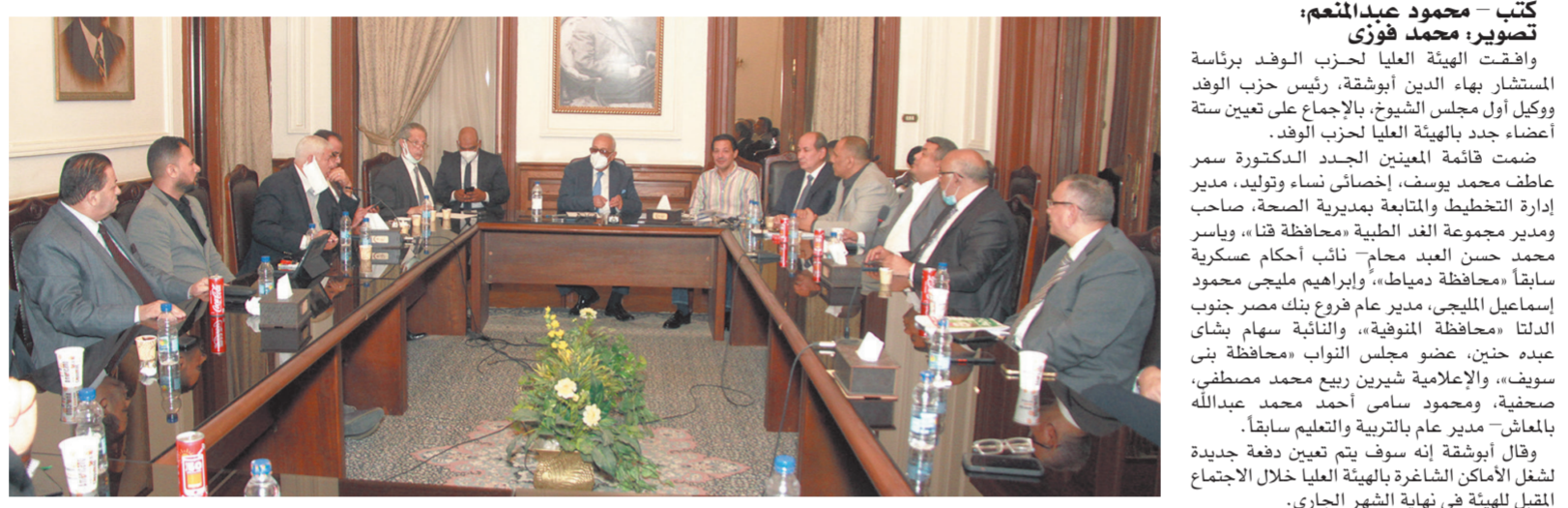
أوشقة خلال رئاسة الهيئة العليا للحزب