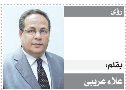
رؤى بقلم: علاء عريبي

كتبت- نغم هلال: أعلنت شركة تنمية الريف المصري الجديد، المستولة عن تنفيذ وإدارة المشروع القومي المليون ونصف المليون فدان، استمرارها في تلقي جميع الطلبات المقدمة من متنقعي المشروع للاستفادة بحزمة التيسيرات التي أقرتها الشركة مؤخرا، حتى يوم ٢٠ سبتمبر الجاري. وتأشدت الشركة جميع المتنقعي بأراضي الـ ١.٥ مليون فدان ممن لم يقوموا بالاستفادة من تيسيرات السداد الجديدة