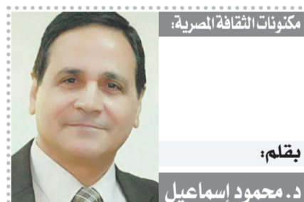
بقلم: د. محمود إسماعيل