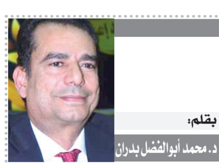
بقلم: د. محمد أبو الفضل بدران