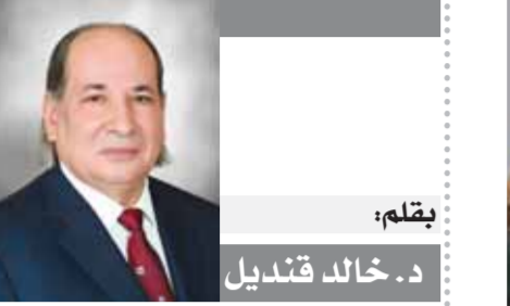
بقلم: د. خالد قنديل

١٠ آلاف دولار أمريكي. يمكن الوصول لاستمارة التقديم أو اللوائح والأحكام من خلال موقعنا الإلكتروني. ستقام الدورة الثالثة لمهرجان الجونة السينمائي في الفترة من ١٤-٢٢ أكتوبر ٢٠٢١، بينما ستقام فعاليات منصة الجونة السينمائية في الفترة من ١٦-٢١ أكتوبر ٢٠٢١ في مدينة الجونة المطلّة على البحر الأحمر.