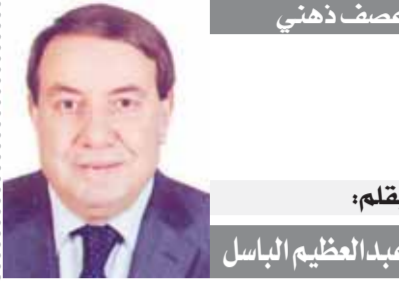
بقلم: عبد العظيم الباسل

لمزيد من الأخبار والتقارير الصورة ALWAFD.NEWS