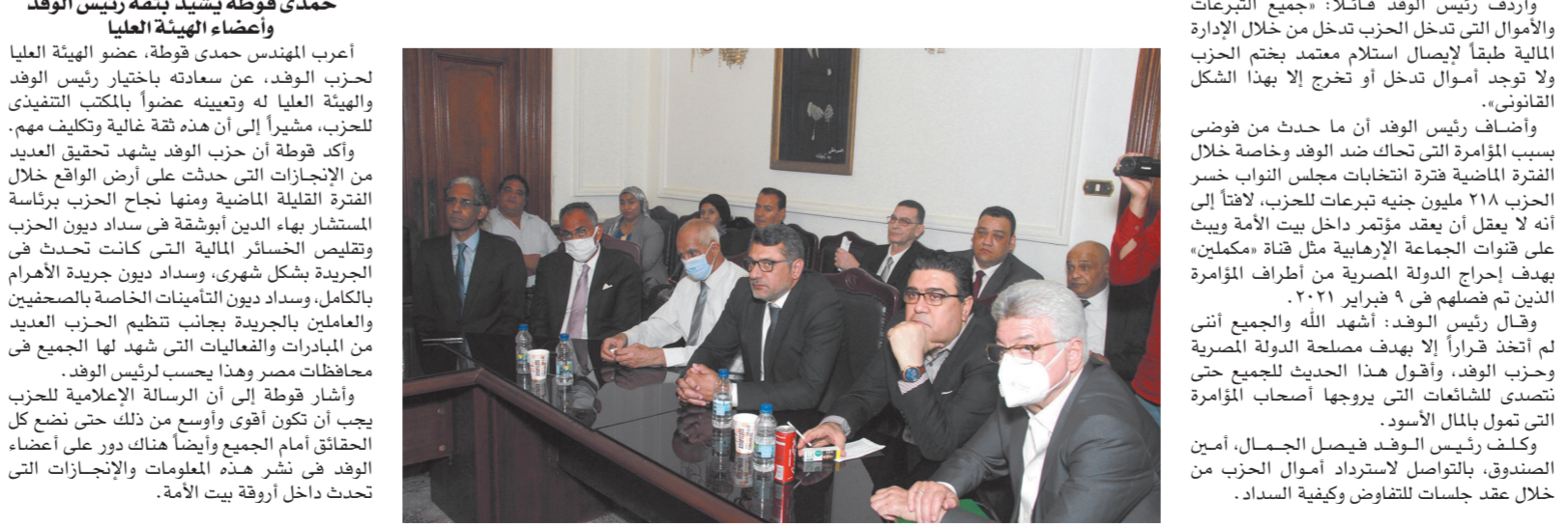
مجلس إدارة الحزب يوافق على تعيين ٦ أعضاء جدد بالهيئة العليا للحزب