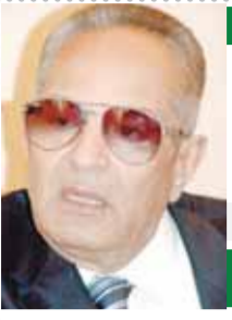
كلمة عدل بقلم: بهاء الدين أبو شقة