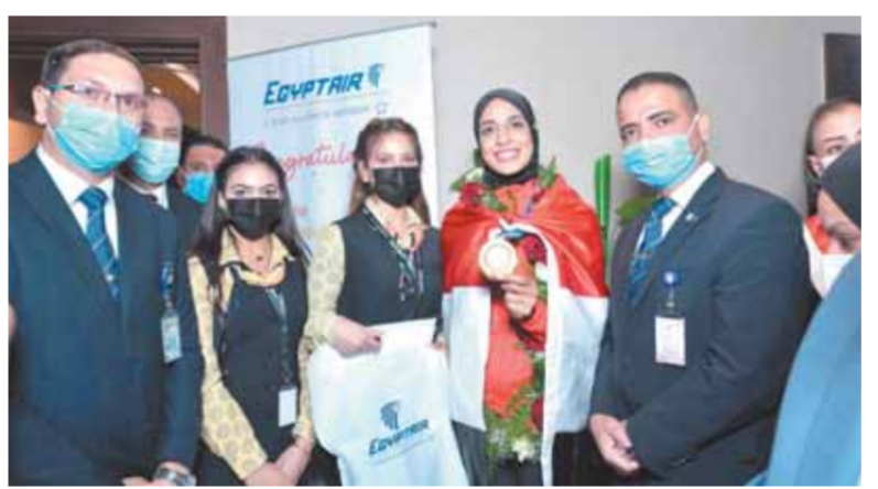
استقبال فريال أشرف بطللة الذهب

كتب. عبد الخالق خليفة وأمانى سلامة: عادت للقاهرة أمس البطللة فريال أشرف الحاصلة على الميدالية الذهبية فى منافسات الكاراتيه والبطل أحمد الجندى الحاصل على الميدالية الفضية فى منافسات الجودو الحديث فى دورة الألعاب الأولمبية طوكيو ٢٠٢٠، فريق عمل العلاقات العامة بمصر للطيران باستقبال أبطال مصر وتهنئتهم بالإنجاز الكبير