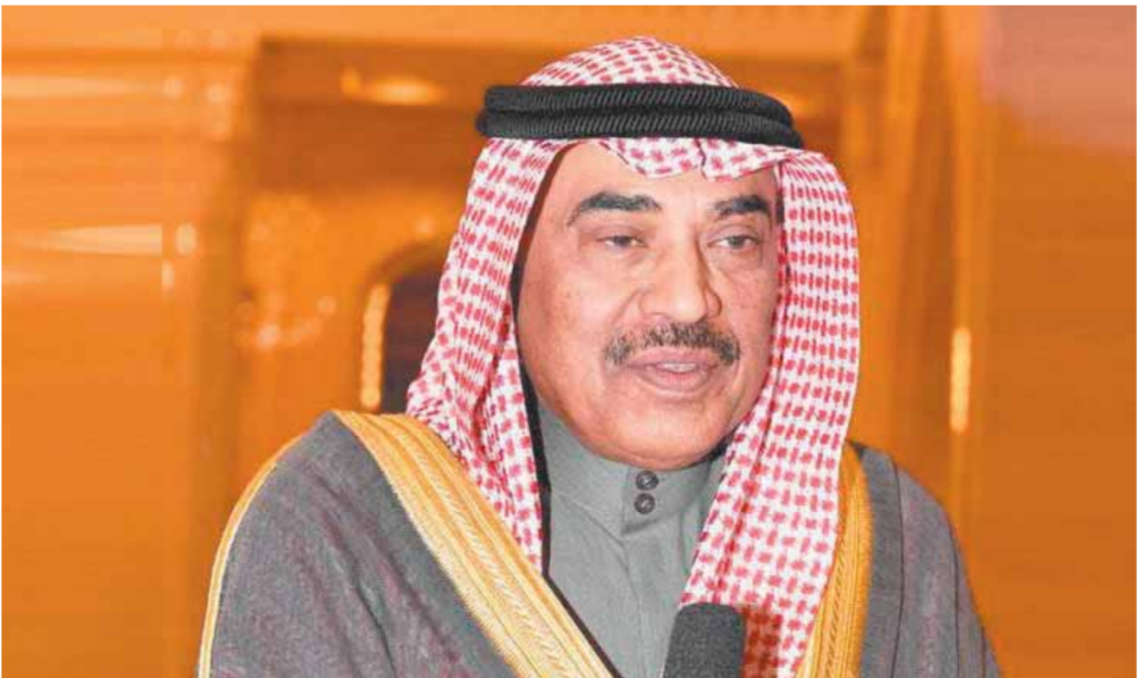
الشيخ صباح الخالد

الفارس، أن هناك توجهاً لتطوير أدوات إضافية لتتوعب احتياجات التعليم لتلائم سوق العمل سواء على مستوى إنشاء جامعات حكومية أو خاصة جديدة، لتفعل منظومة البعثات الداخلية، ومن ثم خدمة سوق العمل بشكل أساسي، جاء ذلك في مستهل فعاليات منتدى التعليم الخليجي الافتراضي الثاني ما بعد جائحة كورونا، الذي نظمه معهد المرأة للتنمية والسلام، تحت شعار «التعليم قاطرة التنمية»، واختتم الأربعاء الماضي عبر منصة «زوم»، وقال الفارس، وهو راعى المنتدى: إن آثار جائحة فيروس كورونا المستجد (كوفيد ١٩) طالت مختلف مناحي الحياة في العالم أجمع، مبيّناً أن الكويت ودول مجلس التعاون الخليجي من ضمن الدول التي تأثرت بالجائحة وبآثارها المدمرة.