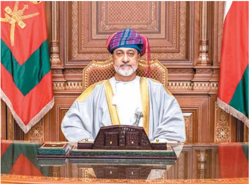
السلطان هيثم بن طارق سلطان عُمان «مؤسس النهضة العُمانيّة المتجددة»

وتحظى الحرب في اليمن منذ فترة ليست ببعيدة، بزخم دبلوماسي إقليمي وعالمي ساهم في تسليط الضوء كثيفاً على القضية اليمنية وتطوراتها ومسارات الحل فيها، كما أنه مارس ضغطاً كبيراً على الكثير من الدول المنخرطة في أزمة الحرب المشتعلة منذ عدة سنوات، ما يُفهم أن