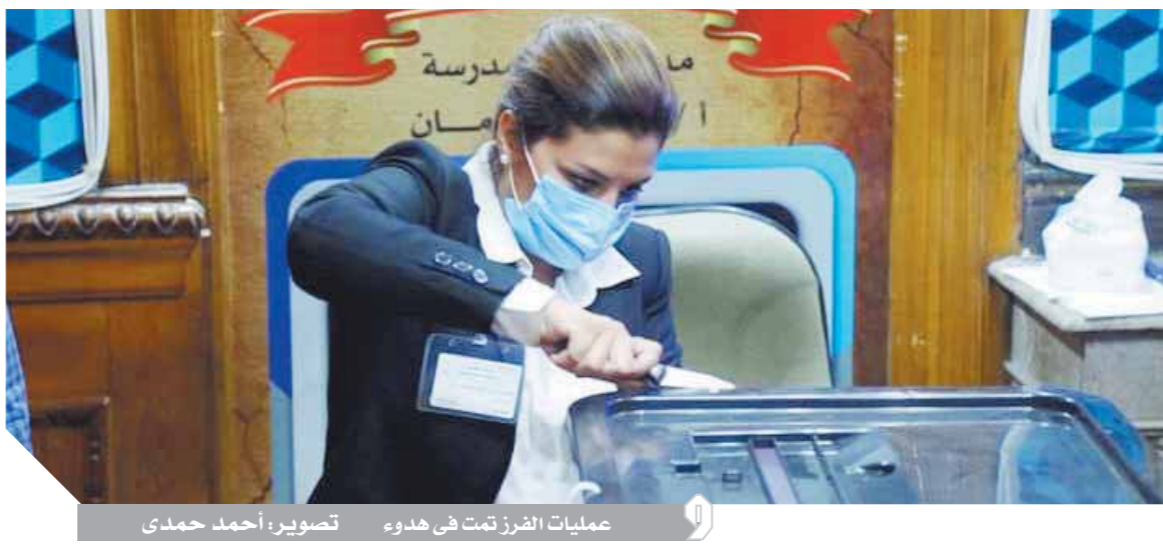
عمليات الفرز تمت في هدوء

واصلت لجان الانتخابات في جميع المحافظات أمس عملية فرز الأصوات في انتخابات مجلس الشيوخ التي عقدت في الخارج يومي الأحد والاثنين الماضيين وفي الداخل يومي الثلاثاء والأربعاء الماضيين، وشهدت إجراءات احترازية صحية مشددة للوقاية من فيروس «كورونا». وشهدت الانتخابات إقبالاً من المواطنين رغم ارتفاع درجة الحرارة وضرب المصيرين أزوع الأمثلة في الالتزام بالتعليمات وأداء واجبيهم الوطني في الإلاء بأصواتهم في جو ديمقراطي يعكس ثقة المواطن فيما تبذله الدولة من جهود للإرتقاء بمصر ووضعها بين مصاف الدول المتقدمة، وهو ما انعكس في حرص المواطنين على التصويت لانتخاب أعضاء تقع على عواتقهم مسئولية وضع التشريعات تنهض بالوطن، وحرصت السيدات وذوو الاحتياجات الخاصة على المشاركة في الصورة المشرفة للانتخابات. يذكر أن الدعاية الانتخابية في جولة الإعادة تبدأ يوم ٢٠ أغسطس على أن تبدأ عملية التصويت يومي الأحد والاثنين ٦ و٧ سبتمبر المقبل، في الخارج ويومي الثلاثاء والأربعاء ٨ و٩ من الشهر نفسه في الداخل، وتعلن النتائج النهائية يوم ١٦ سبتمبر المقبل.