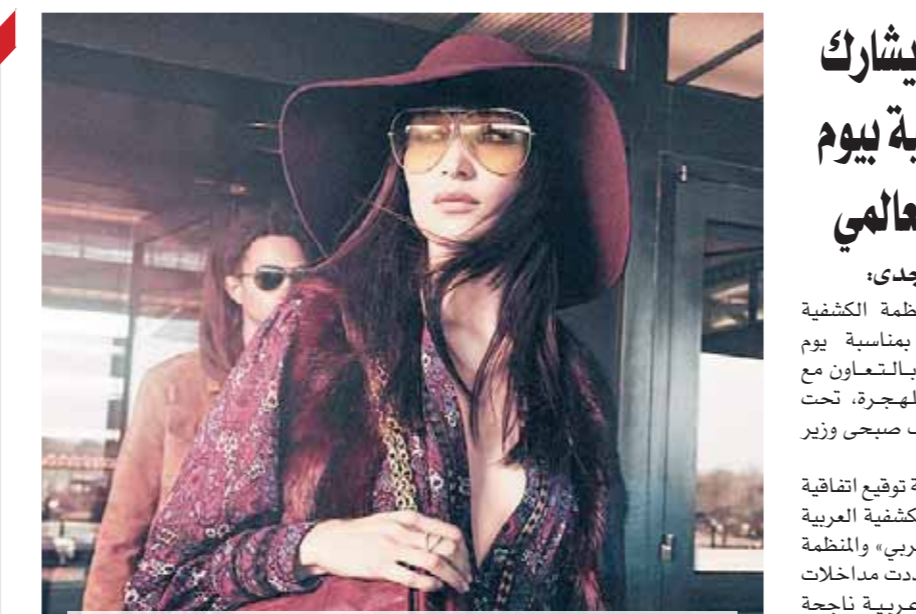
بيلا حديد بأزياء مستوحاة من الثمانينات

«ساعد عندما يدفن تراب لبنان الخونة، وعندما يحترم من يحكمون الوطن شعيم ليعيش الشعب فى أمان» بهذه الكلمات أعلنت الفنانة اللبنانية المعروفة نادين نسيم نجم، مغادرتها وطنها فى هجرة طويلة، فى وأطفالها والعيش فى بلد آخر تتماسا للأمان والاستقرار، بعد إصابتها فى انفجار ميناء بيروت، وقالت نادين نجم فى تغريدة على «تويتر»: «من هذه اللحظة من الحشى اتخذت قراراً، راح أترك البلد وأعيش بإمان فى بلد آخر يحترم شعبه أحسن ما أكون فى بلد حاكميته زعران وأموت»، وأضافت نادين بنسجم كلامها إلى المسئولين: «يس تقفروا أنتم تحت التراب نحن نبرج على وطننا، غير هيل ما له لزوم الحكى وشكرا».