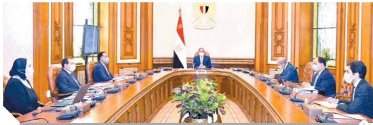
الرئيس خلال اجتماعه أمس مع رئيس الوزراء والمهندس شريف إسماعيل ووزراء البترول والمالية والتجارة