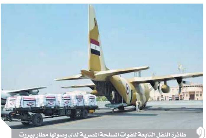
طائرة النقل التابعة للقوات المسلحة المصرية لدى وصولها مطار بيروت

كتب- محمد صلاح وأبو زيد كمال وسامية فاروق: استكمالاً لتنفيذ توجيهات الرئيس عبدالفتاح السيسي رئيس الجمهورية القائد الأعلى للقوات المسلحة باستمرار فتح الجسر الجوي من المساعدات العاجلة وتقديمها إلى الأشقاء في الجمهورية اللبنانية لتجاوز آثار انفجار مرفأ بيروت، وصلت إلى مطار بيروت الدولي طائرة النقل العسكرية الرابعة والمحملة بشحنة مساعدات عاجلة تضمنت كميات كبيرة من المستلزمات الطبية والمواد الغذائية المقدمة من مصر إلى لبنان الشقيقة. وأعرب المعيد طيار روجيه حلو ممثل قائد الجيش اللبناني عن عميق شكره وامتنانه للقيادة المصرية التي تواصل تقديم الدعم للشعب اللبناني خلال تلك الفترة الحرجة من تاريخ لبنان، وأكد الدكتور حسين مجيدلى مستشار وزير الصحة اللبناني على مدى أهمية تلك المساعدات في مساندة قطاع الصحة اللبناني لتجاوز آثار تلك الأزمة. تأتي تلك المساعدات تأكيداً على عمق العلاقات والروابط التاريخية الراسخة بين البلدين.