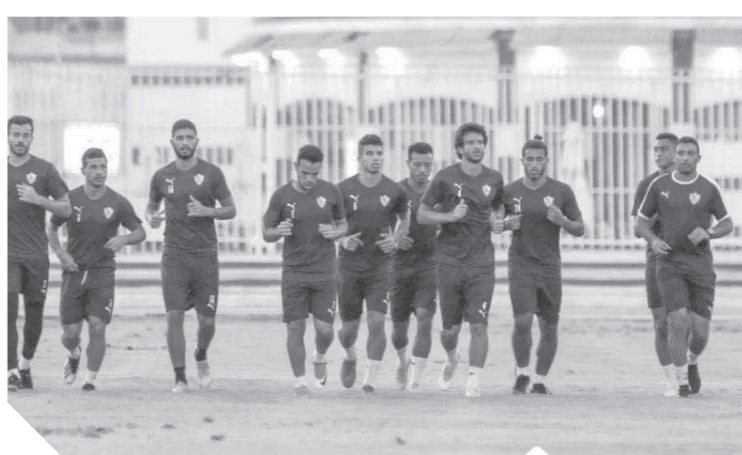
الزمالك جاهز لمواجهة المقاصة