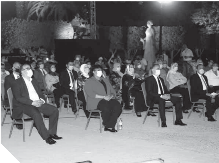
حضور الجمهور في المسرح المكشوف

وحول عدد الجمهور مقارنة بالحفلات ما قبل كورونا قال: عدد الجمهور الذي حضر الحفل فاق توقعاتنا، فقد امتلأت المقاعد في حدود ٧٥٪، وكان علينا الالتزام بها، لأن عودة الحفلات لا يعني انتهاء الولاء، دورنا متمثل في مساعدة الجمهور على التعلق والتعاشي مع الوضع الراهن، وبالفعل الجمهور تلالى كورونا، وشاركنا فرحتنا، وكان يتفاعل معي في كل أغنية، وكنت أسمع مدحهم وما يملونه عن كلمات الثناء والشكر من خلف الكمامة.