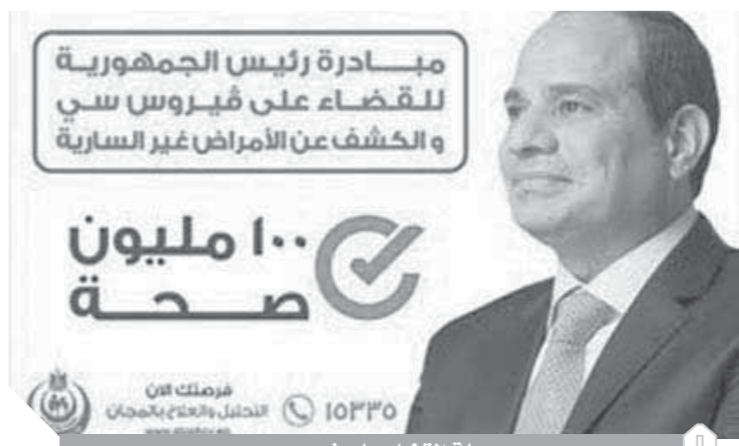
حملة القضاء على فيروس سي