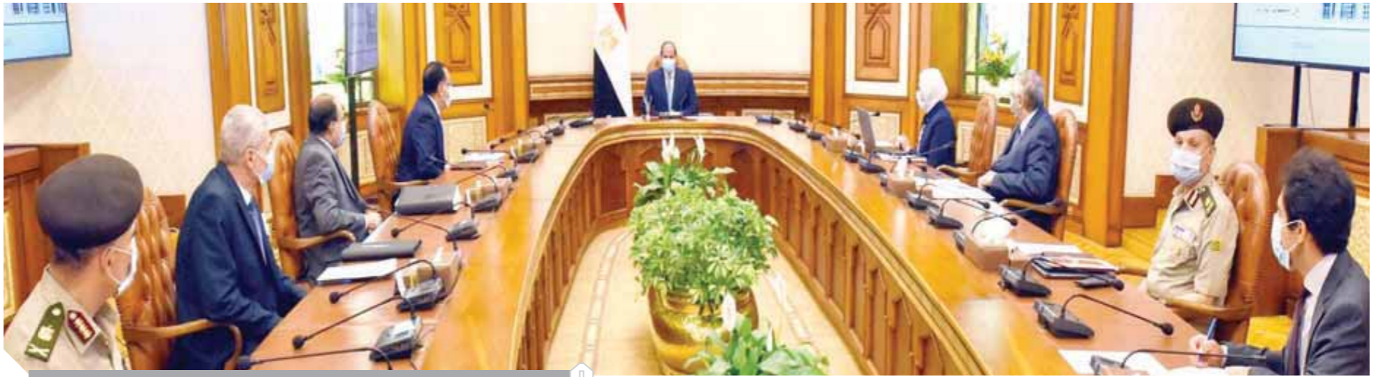
الرئيس السيسي خلال اجتماعه مع رئيس الوزراء ووزيرة الصحة

تم من خطوات في هذا السياق من التعرف على الخبرة والتجارب الدولية ذات الصلة والزيارات الميدانية لمراكز تصنيع وتوزيع البلازما مع الشركاء الدوليين ذوي الخبرة والتكنولوجيا المتقدمة في كافة جوانب هذا المجال.