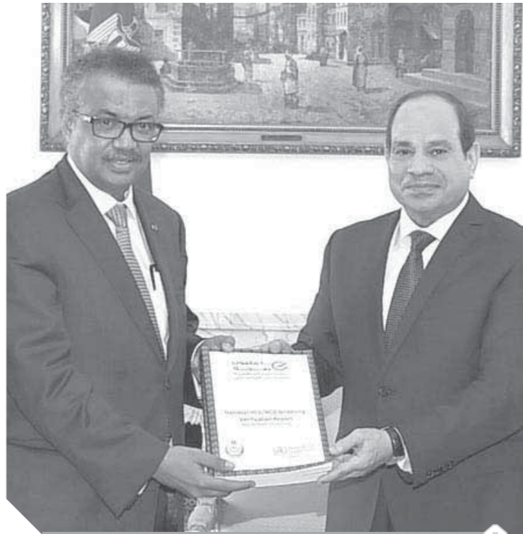
الرئيس السيسي يتسلم تقرير منظمة الصحة العالمية عن مبادرة ١٠٠ مليون صحة