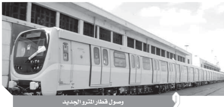
وصول قطار المترو الجديد

هواء عالى السعة، كما أنه مزود بممر آمن يسمح بانتقال الركاب بين العربات لمزيد من الراحة فى ظروف التشغيل العادية. كما تم تزويده بكاميرات تلفزيونية مثبتة فى مقدمته للمراقبة المركزية.