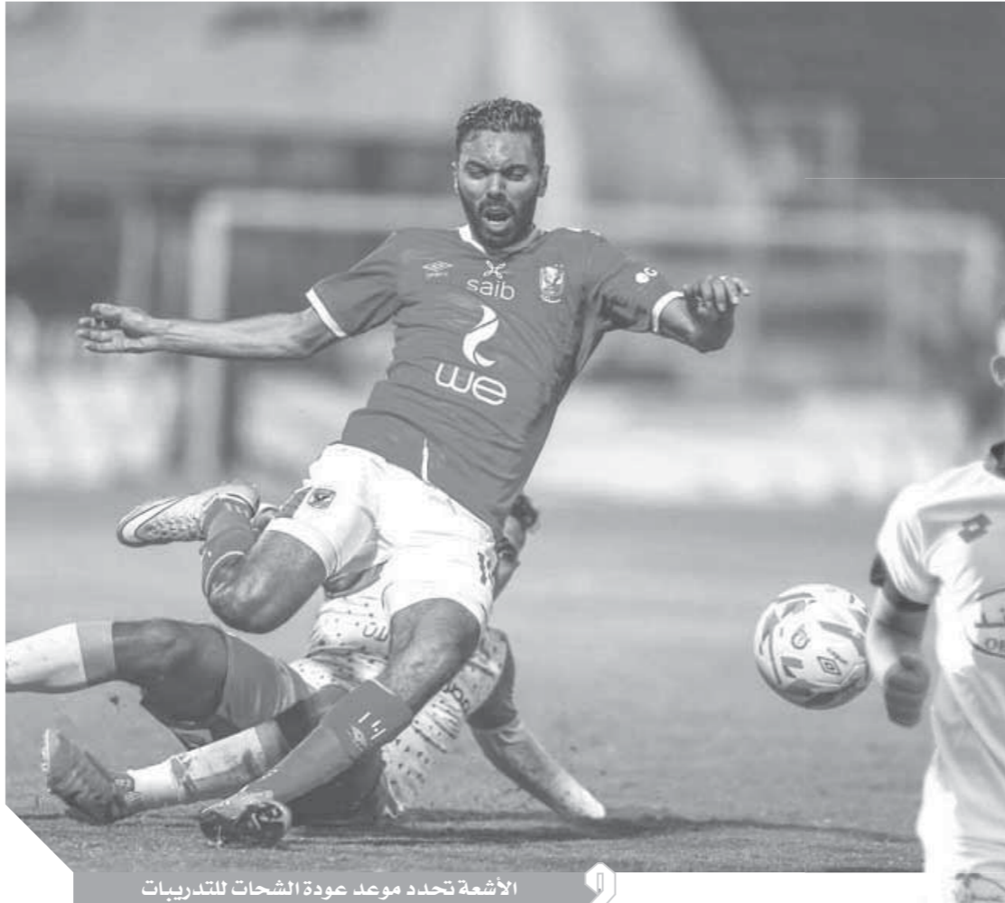
الأشعة تحدد موعد عودة الشحات للتدريبات