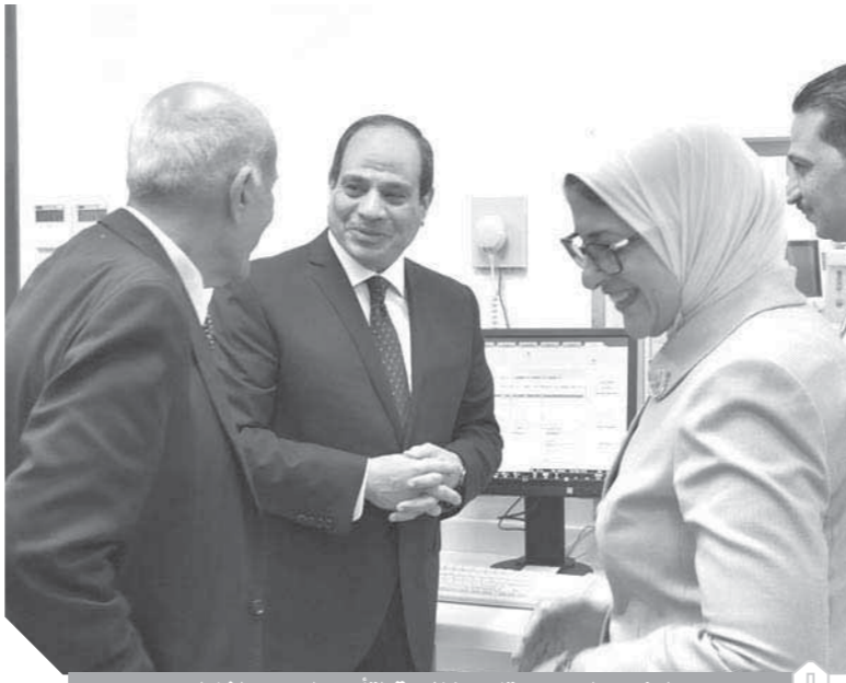
الرئيس السيسي يتابع منظومة التأمين الصحي الشامل