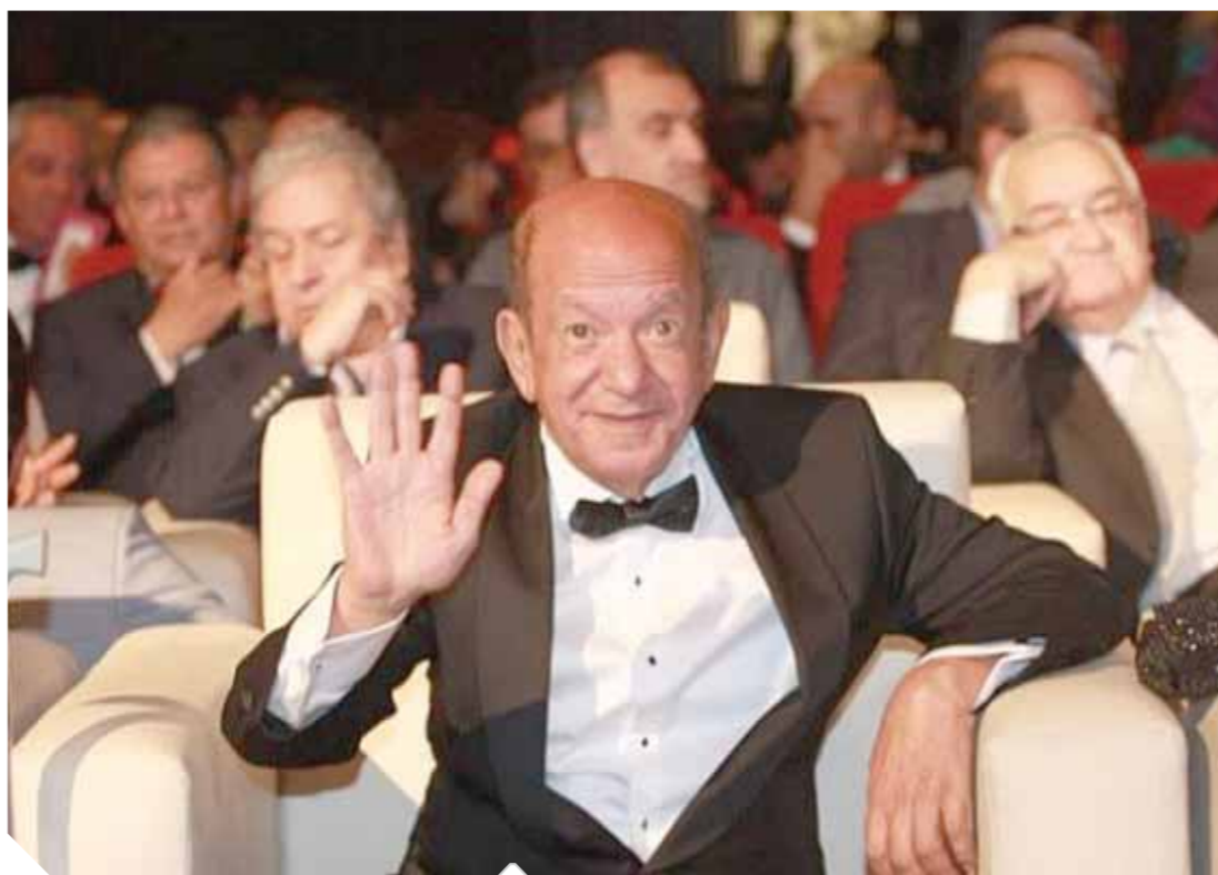
لطفى لبيب يودع الجماهير