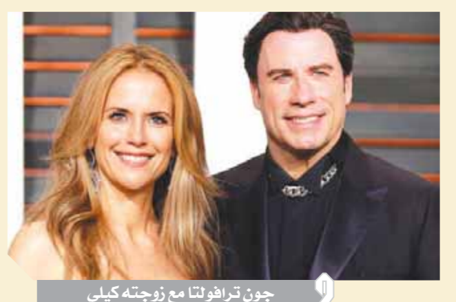
جون ترافولتا مع زوجته كيلي

أعلن الممثل الأمريكي جون ترافولتا وفاة زوجته الممثلة كيلي بريستون، عن عمر ناهز ٥٧ عاماً، الأحد الماضي، بعد معركة مع سرطان الثدي لمدة عامين. وكتب ترافولتا في منشور على «إنستجرام»: «أبلغكم بقلب يعترضه الألم أن زوجتي الجميلة كيلي خسرت معركتها التي استمرت عامين مع سرطان الثدي، لقد قابلت بشجاعة يوازها حب ودعم الكثيرين.