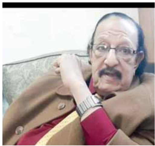
كتب - دينا دياب:

شيعت ظهر أمس جنازة المنتج والكاكب فاروق صبرى أحد أهم أعمدة الإنتاج السينماتى في مصر من مسجد مصطفى محمود بالمهندسين، وسط عدد من محبيه من الفنانين والجمهور. فاروق صبرى هو رئيس غرفة صناعة السينما، ومنتج سينماتى من الطراز الأول قدم العديد من الأفلام الهامة التي تعتبر من أهم كلاسيكات السينما في العالم، وهو أحد مؤسسي شركة «الأخوة المتحدون» للإنتاج الشهيرة، وشغل منصب عضو مجلس إدارة «اتحاد الصناعات المصرية».