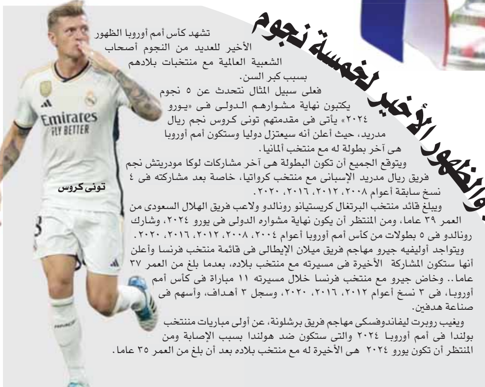
تشهد كأس أمم أوروبا الظهور الأخير للعديد من النجوم أصحاب الشعبية العالمية مع منتخبات بلادهم بسبب كبر السن.

فعلى سبيل المثال نتحدث عن ٥ نجوم يكتبون نهاية مشوارهم الدولى فى «يورو ٢٠٢٤» يأتى فى مقدمتهم تونى كروس نجم ريال مدريد، حيث أعلن أنه سيعتزل دوليا وستكون أمم أوروبا هى آخر بطولة له مع منتخب ألمانيا. فريق ريال مدريد الإسباني مع منتخب كرواتيا، خاصة بعد مشاركته فى ٤ نسخ سابقة أعوام ٢٠٠٨، ٢٠١٢، ٢٠١٦، ٢٠٢٠. ويبلغ قائد منتخب البرتغال كريستيانو رونالدو وللاعب فريق الهلال السعودى من العمر ٢٩ عاما، ومن المنتظر أن يكون نهاية مشواره الدولى فى يورو ٢٠٢٤، وشارك رونالدو فى ٥ بطولات من كأس أمم أوروبا أعوام ٢٠٠٨، ٢٠١٢، ٢٠١٦، ٢٠٢٠. ويتواجد أوليفيه جيرو مهاجم فريق ميلان الإيطالى فى قائمة منتخب فرنسا وأعلن أنها ستكون المشاركة الأخيرة فى مسيرته مع منتخب بلاده، بعدما بلغ من العمر ٣٧ عاما.. وخاض جيرو مع منتخب فرنسا خلال مسيرته ١١ مباراة فى كأس أمم أوروبا، فى ٣ نسخ أعوام ٢٠١٢، ٢٠١٦، ٢٠٢٠، وسجل ٤ أهداف، وأسهم فى صناعة هدفين. ويغيب روبرت ليفاندوفسكى مهاجم فريق برشلونة، عن أولى مباريات منتخب بولندا فى أمم أوروبا ٢٠٢٤، والتي ستكون ضد هولندا بسبب الإصابة ومن المنتظر أن تكون يورو ٢٠٢٤ هى الأخيرة له مع منتخب بلاده بعد أن بلغ من العمر ٣٥ عاما.