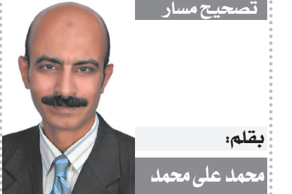
تصحيح مسار بقلم: محمد على محمد

بطلقتين خرطوش أنهى عامل خرسانة حياة زوجته بطريقة مأساوية أمام أعين أطفالها، دون شفقة أو رحمة، وبعد خلاف بينهما داخل منزل الزوجية، وحاول إخفاء معالم جريمته بوضع أسمنت خرسانة على جثتها ودفنها لكن القدر أفضل مخطئه وكشف جريمته الكراهة.. قبل ٩ سنوات انتقلت الزوجة الثلاثينية من محافظة الإسكندرية في محافظة البحيرة حيث سكن أسرتها إلى محافظة الغربية بقريه توما بمدينة المحلة حيث سكن الزوجية، بعدما قررت أن تنزوح من «صبرى»، رغم أنها تستكون زوجة ثانية لكن نشأتها البسيطة وسط أسرة متوسطة الحال جعلها تقبل بتلك الزيجة لتغيير حياتها.