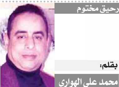
بقلم: محمد على الهوارى