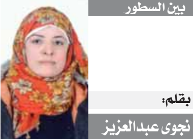
بقلم: نجوى عبد العزيز

وسبق للحكم الفرنسى إدارة ٤ مباريات للمنتخب الألمانى، حقق خلالها الفوز فى ٣ مباريات والتعادل فى واحدة، بينما لم يدر أى مباراة للمنتخب الاسكتلندى.