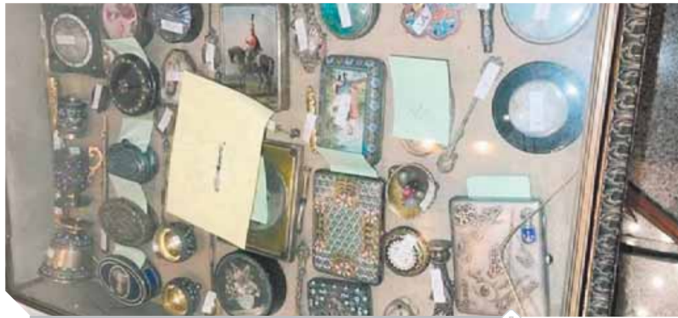
جانب من المقتنيات الأثرية والمضبوطات الثمينة فى شقة الزمالك