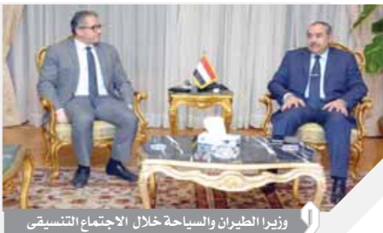
وزيرا الطيران والسياحة خلال الاجتماع التنسيقي

كتب: أمانى سلامة، تم عقد اجتماع تنسيقي بين وزيرى السياحة والآثار الدكتور خالد العنانى، والطيران المدني الطيار محمد منار، حيث ناقشا توفير حزمة من التخفيضات من أجل تحفيز السياحة الوافدة إلى مصر عند عودتها في التوقيت الذي سوف يحدده مجلس الوزراء. وأشار وزير الطيران المدني إلى أن وزارة الطيران قررت منح شركات الطيران تخفيضات بنسبة قدرها ٥٠٪ على رسوم الهبوط والإيواء ونسبة ٢٠٪ مقابل الخدمات الأرضية المقدمة بالمطارات في كل من محافظات البحر الأحمر وجنوب سيناء