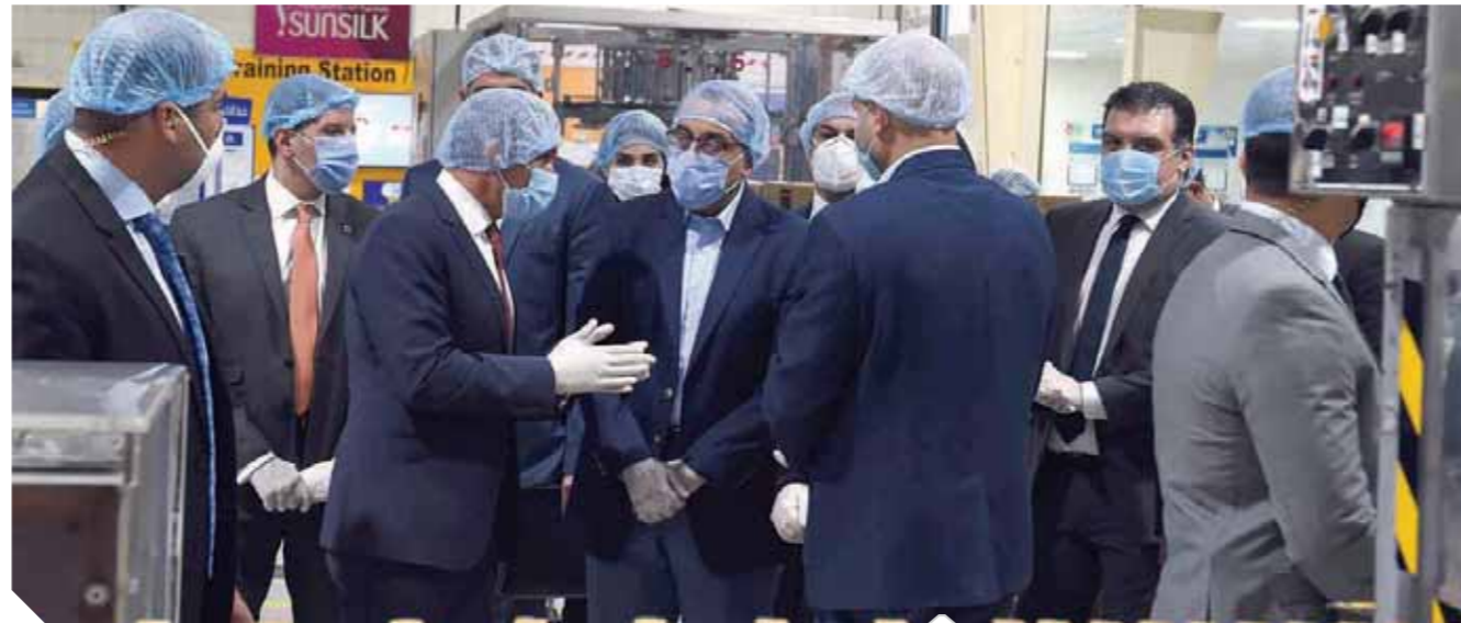
مدبولي خلال جولته بمصنع الضفائر الإلكترونية للسيارات

طريق الإسكندرية الصحراوي شمال غرب مدينة ٦ أكتوبر، حيث توجد ٢٠ بحيرة رميلة تتجمع فيها تلك الحماة للتعامل معها بطريقة آمنة لحين الانتهاء من الدراسات المتعددة لمعالجة الحماة لاختيار أفضل طرق التعامل معها. ولقب رئيس الوزراء تكثيف العمل في المرحلة الحالية لمشروع توسعة القدرة الاستيعابية للمحطة، والتي تشمل أعمال المعالجة البيولوجية، والالتزام بالتوقيتات المحددة لتنفيذها؛ سعياً لدخول المشروع حيز التشغيل في المواعيد المحددة لذلك، مؤكداً أن مشروعات معالجة مياه الصرف الصحي من المشروعات ذات الأولوية.