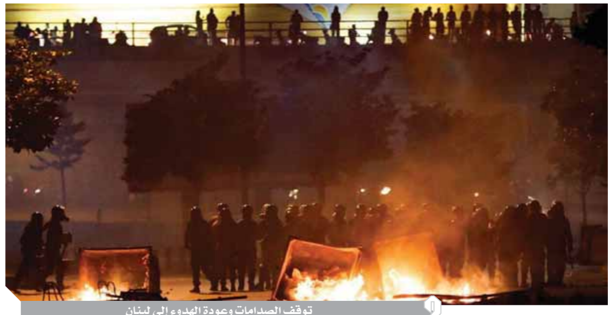
توقف الصدامات وعودة الهدوء إلى لبنان

ساد هدوء حذر أمس السبت، في العاصمة اللبنانية بيروت، بعد ليلة صاخبة خلقت باشتباكات وأعمال شغب بين متظاهرين، وقوات مكافحة الشغب والجيش اللبناني. وأسفرت الاشتباكات وأعمال الشغب التي شهدتها بيروت عن إصابة عشرات الأشخاص واعتقال آخرين. تسببت أعمال الشغب بتحطيم واجهات المحال التجارية وحرقها في شوارعى رياض الصلح والمغازية، حيث تعمل فرق الإطفاء على معالجة الأضرار. وتحول وسط بيروت إلى ساحة اشتباك بعد مسيرة سلمية، حيث حضر العشرات من مناصري حركة أمل وحزب الله على دراجاتهم النارية، واقفعلوا أعمال شغب، وتحطيم للمباني والمحال التجارية، قبل أن تتدخل القوى الأمنية. في مدينة طرابلس شمالي لبنان أعلن جهاز الطوارئ في المدينة عن إصابة ٢٢ شخصاً في المواجهات التي وقعت بين متظاهرين والجيش اللبناني. وتأتي هذه التطورات بعد ارتفاع سعر صرف الدولار في الأسواق إلى مستويات قياسية، وبعد اجتماعات متتالية للحكومة في محاولة للجم الارتفاع الحاصل والهبوط الجنوني للعملة الوطنية. شهدت البلاد قطعاً للطرق في مختلف المناطق تديداً بالوضعين المعيشي والاقتصادي.