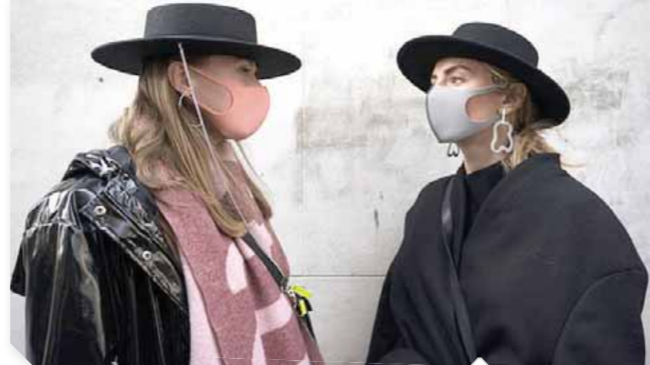
انطلاق أسبوع الموضة فى نسخة إلكترونية