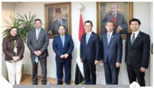
لقاء وزير المالية والسفير الكوري الجنوبي