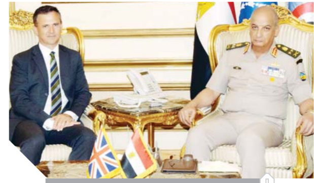
وزير الدفاع خلال لقائه نظيره البريطانى

التقى الفريق أول محمد زكى القائد العام للقوات المسلحة وزير الدفاع والإنتاج الحربى، السيد مارك لانكستر وزير الدولة للقوات المسلحة البريطانية والوفد المرافق له، الذى يزور مصر حالياً في زيارة رسمية تستغرق يومين تناول اللقاء عدداً من الموضوعات ذات الاهتمام المشترك خاصة في مجال مكافحة الإرهاب والتدريب المشتركة، وسبل تعزيز العلاقات العسكرية بين البلدين كما تم التطرق إلى المستجدات على الساحتين الإقليمية والدولية وفرص