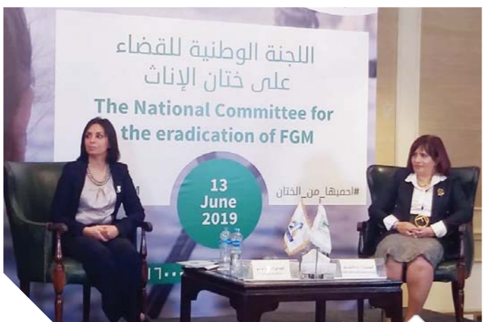
جانب من مناقشات وفعاليات لجنة القضاء على ختان الإناث