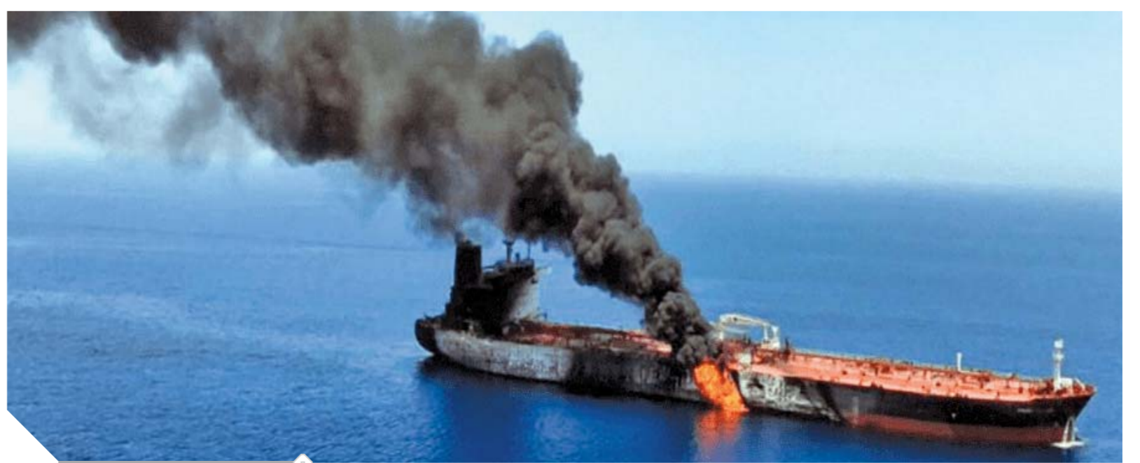
التييران تشتعل بناقلتي البترول