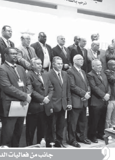
جانب من فعاليات الدورة التدريبية

وثنى «كور» التزامات المنتدى من قبل هيئة الرقابة الإدارية المصرية، مع بلاده للتعاون مع الأكاديمية الوطنية لمكافحة الفساد المصرية، وحسن الاستقبال وكرم الضيافة.