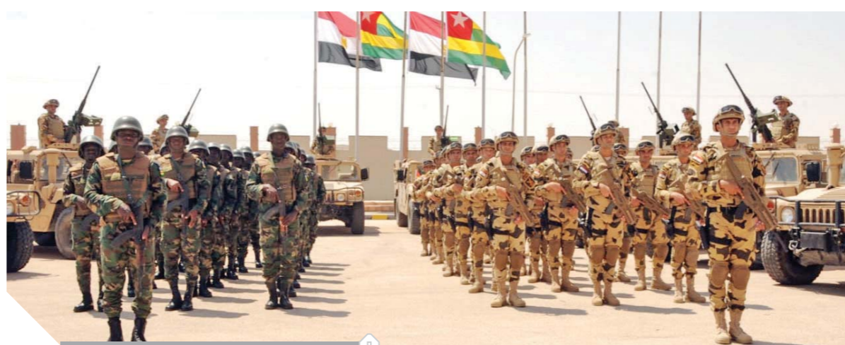
تدريبات مشتركة بين مصر وتوجو