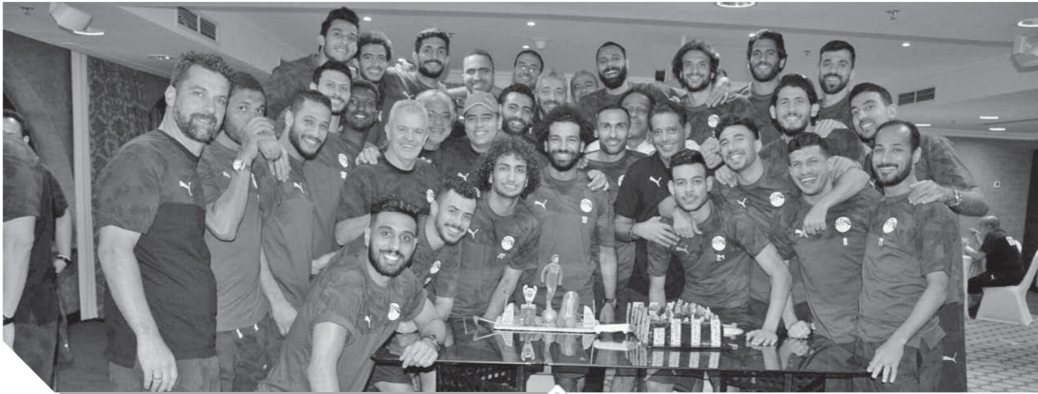
لاعبو المنتخب يحتفلون بصالح بعد انضمامه لمعسكر المنتخب

اللاعبون احتفلوا بانضمام «صالح».. ومدرب الأحمال يبعث برسالة مباشرة