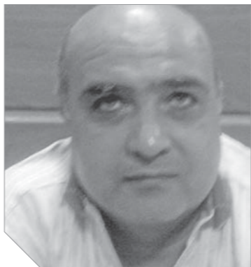
العميد اشرف قريشى

تم تشكيل فريق بحث برئاسة اللواء عصام الحملى مدير أمن الأقصر - مفتش مباحث سوهاج آنذاك - وبداننا العمل فى البداية عن كشف هوية القاتيل لمدة أسبوعين لكننا لم نتوصل إلى أى شيء نظراً لأنه كان لا يحمل