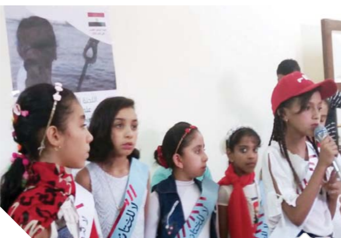
فتيات من الحملة

للشخصيات العامة، والاحتفاء بجهود المؤسسات والمنظمات المجتمعية في القضاء على ختان الإناث، وزيادة الوعي بالقضية وتشجيع فاعلين جدد. كما تم تكريم السفيرة مشيرة خطاب عن دورها الفارق من خلال رئاستها لمجلس القومى للطفولة والأمومة ثم توليها لوزارة الأسرة والسكان، وإسهاماتها في إرساء بنية تشريعية وإحداث حراك مجتمعي وسياسي للتصدي لملف ختان الإناث.