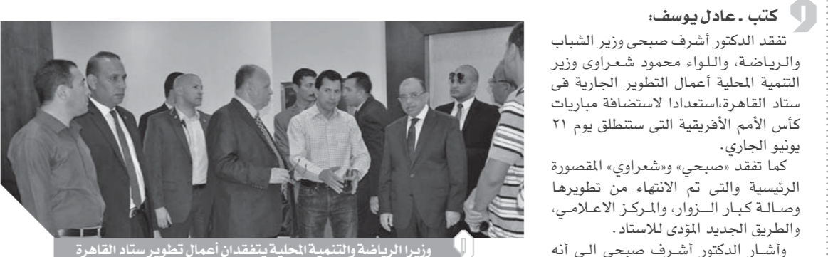
وزير الرياضة والتنمية المحلية يتابعان أعمال تطوير استاد القاهرة