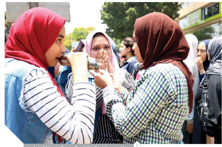
اتزعاج طالبات الثانوية من امتحان الإنجليزي

إيجابية ومنها كلمة أزمان وأزمة وأزمن، من المقرر عرض نتائج العينة على وزير التربية والتعليم ورئيس الامتحانات لاعتمادها وإعلانها اليوم أو غداً. وتبدأ الإختبارات اعتباراً من غد السبت في تصحيح أوراق الإجابة في الاقتصاد والإحصاء.