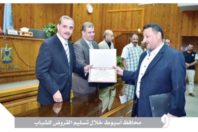
محافظ أسبوط خلال تسليم القروض للشباب