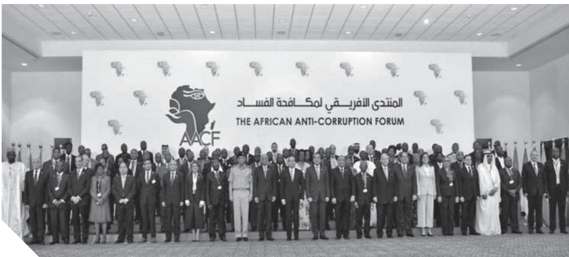
رئيس الهيئة الوطنية للوقاية من الفساد بالجزائر، حضور «السيدي» يعكس إرادة مصر القوية في القارة