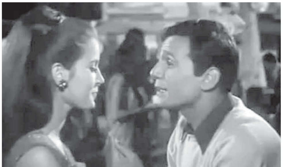
مشهد من فيلم «أبي فوق الشجرة»