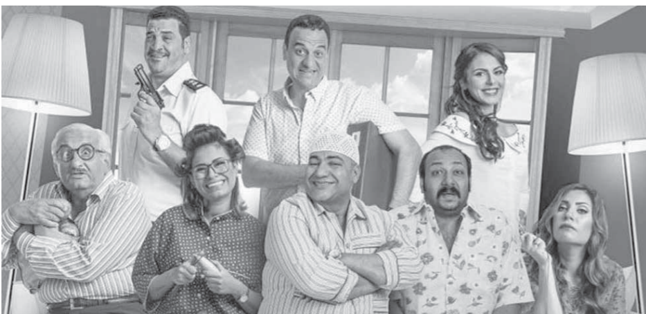
بيومي فؤاد نجم أفلام الربيع يتوسط زملائه

الحياة في ظروف غامضة، حتى تعلم أسرته أنه توفي اثر حادث، وخلال الأحداث تعود روحه لتطارد زوجته وأسرتة في قالب ربع مشوق. فيلم «قلب أسود»، من بطولة أحمد هارون ونهال عنبر وأشرف طلبة ومراذ فكري ومصطفى درويش وبسمة الفيظاني وفتحى سعد ونادية العرافية ومحمود السمنط وآخرين، من تأليف مصطفى عامر، وإخراج وأثالث عبدالقادر، والفيلم يعرض اليوم بدور العرض السينمائية. وعن ضعف الإيرادات قال الفنان هانى رمزي الغائب منذ فترة عن السينما: للأسف الفيلم تأجل عرضه أكثر من مرة لعدة ظروف، ولكنه ما زال في أسبوعه الثاني، ولا يمكن الحكم على الإيرادات في هذا الوقت، وأنا أراهن على موضوع الفيلم فهو يهيم عدداً كبيراً من الجمهور، المصرين جميعاً يتعاملون بالتقسيم، ويتعوقن في العديد من المشكلات بسبب هذا الموضوع، ولذلك ما زلت أنتظر ردود الفعل عن العمل، وأكد هانى أنها مغامرة بالطبع ان يعرض الفيلم في هذا الموسم، لكني مؤمن ان الفيلم الجيد يحقق نجاحاً في أي وقت. أما محمد نجاتي فقال إن الفيلم تعرض للظلم بعد تصنيف الرقابة له لـ 18+ خاصة وأنه لم يستحق ذلك لعدم احتوائه على مشاهد خارجة فهو فيلم لكافة افراد الأسرة. وأشار نجاتي الى أن التصنيف العمرى أدى لعدم تحقيق إيرادات عالية، وقال شاهدت أطفالاً كثيرين بدور العرض يريدون دخول الفيلم، وتم رفضهم بسبب التصنيف العمرى، وكنت أتمنى أن يتال الفيلم حقه في البداية ليحقق الإيرادات التي نتمناها.