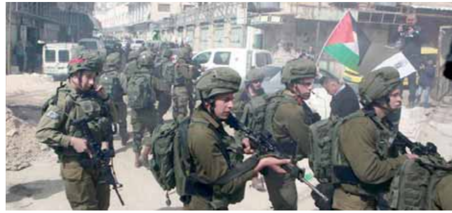
قوات الاحتلال قشلت في وقت المسيرات الفلسطينية

من ناحية أخرى، اندلعت، أمس، مواجهات بين عشرات الفلسطينيين والجيش الإسرائيلي في مواقع متفرقة من الضفة الغربية المحتلة.