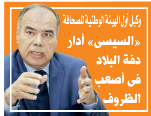
وكيل أول الهيئة الوطنية للمصاحفة «السيسى» أدار دفة البلاد فى أصعب الظروف