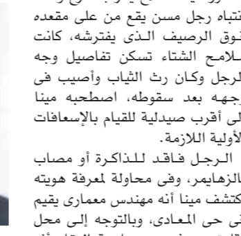
المهندس عمر فى حياة القصور