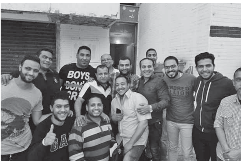
موظفو الزمالك يحتفلون ببراءة زملائهم

والنزاهة وكذلك فى جميع مؤسسات الدولة المصرية، مشيراً إلى أن حق الزمالك لن يضيع مهما كانت المؤامرات والألاعيب الخارجية ضد النادي. وشدد مرتضى على أن مجلس الزمالك لا توجد لديه أى مخالفات مالية أو قانونية، وكل ما يسرب شائعات وأكاذيب مغرضة الهدف منها التشهير بسمعة أعضاء المجلس وموظفي النادي.