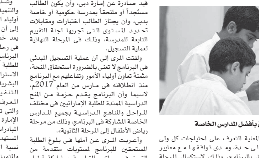
إتاحة الفرصة للطلاب الإماراتيين للالتحاق بأفضل المدارس الخاصة