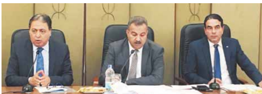
وزير الصحة يتحدث أمام البرلمان