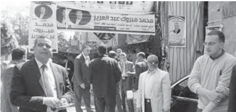
إقبال محدود على انتخابات «البيطريين»