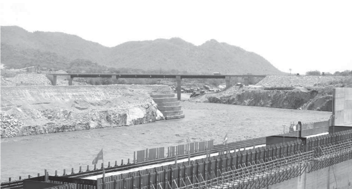
مفاوضات سد النهضة لاتزال جارية بين الدول الثلاث