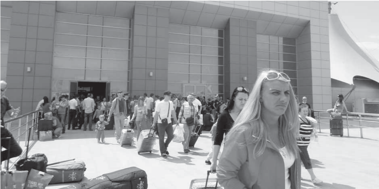
عودة حركة الطيران الروسي إلى مصر رسالة للعالم باستقرار الأوضاع في مصر

وأوضح «زين» أن عودة السياحة الروسية، أكبر شهادة إثبات على أن مصر آمنة ومستقرة، كما أنها ستحقق أرباحاً كبيرة، وتسهم في إنعاش حركة السياحة المتوقفة منذ فترة في مصر، مطالباً القطاع السياحي المصري، بضروة العلاقات الثنائية بين «القاهرة وموسكو»، وأن العلاقة بين مصر وروسيا علاقة وطيدة قائمة على التعاون المشترك، خاصة بعد نجاح الرئيس عبدالفتاح السيسي في عودة مصر مرة أخرى إلى سياحتها ومكانتها الريادية بين دول العالم.