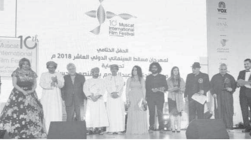
مشاهد من فعاليات مهرجان مسقط السينمائي الدولي