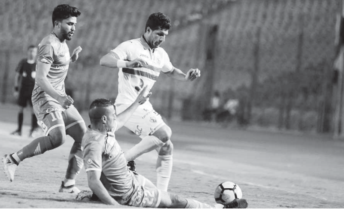
الزمالك يسقط من جديد أمام الاتحاد السكندري