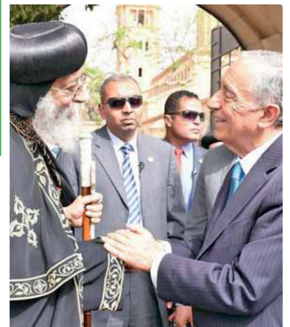
البابا تواضروس خلال استقباله رئيس البطريرك

كما تشهد جلسة غد مناقشة 6 مشروعات قوانين، تضم تقرير لجنة الخطة والموازنة عن مشروع قانون مقدم من الحكومة بتعديل بعض أحكام قانون الضريبة على الدخل الصادر بالقانون رقم 91 لسنة 2005، وتقرير اللجنة