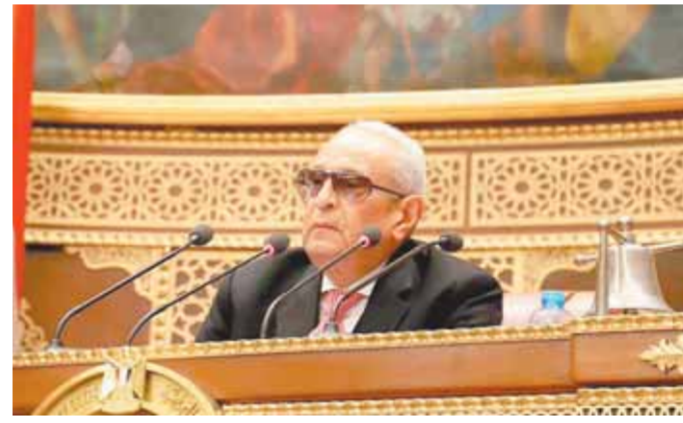
أبووشة خلال تروسه جلسة الشيوخ

قانون العمل استحقاق دستوري يوفر الحياة المستقرة والأجر العادل والسلام الاجتماعى