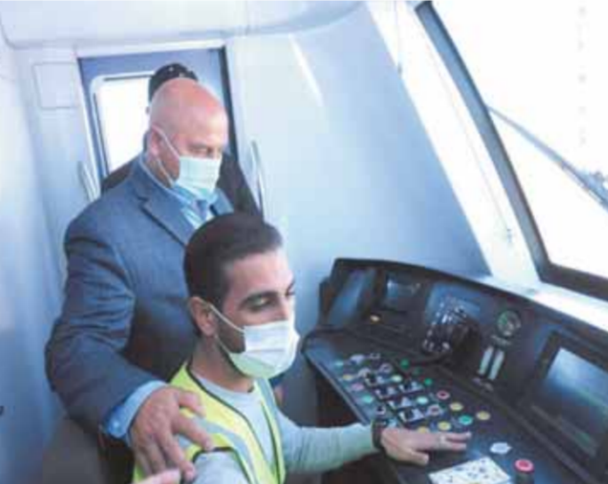
المفظة للمشروع وبحضور ممثلى شركة أفليك الصينية واستشارى المشروع وقيادات هيئى الأفاق وسلك مدير مصر.

ل (قطر 6 عربيات) من إجمالي ٢٢ قطاراً لازمة التشغيل، وجرار ديزل خاص بالورشة، وجار شحن ال-١ قطارات المتبقية حيث تستعمل تباطوا وفقاً للمواعيد المخططة ويبلغ إجمالي تكلفة القطارات ٢٢٧ مليون دولار، والصنعة والموردة من شركة كريك/ أفيك أنتل الصينية.