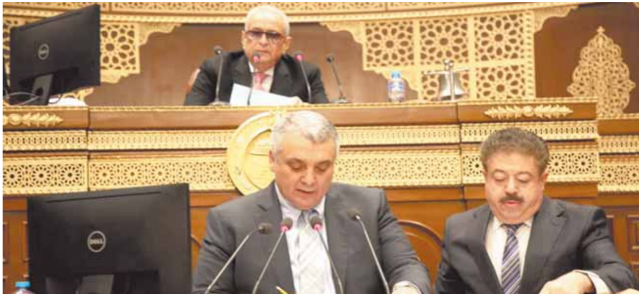
أبوشقة خلال رئاسته جلسة الشيوخ