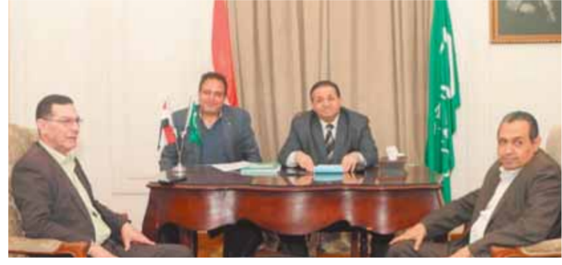
جانب من لجنة الإشراف على انتخابات الوفد