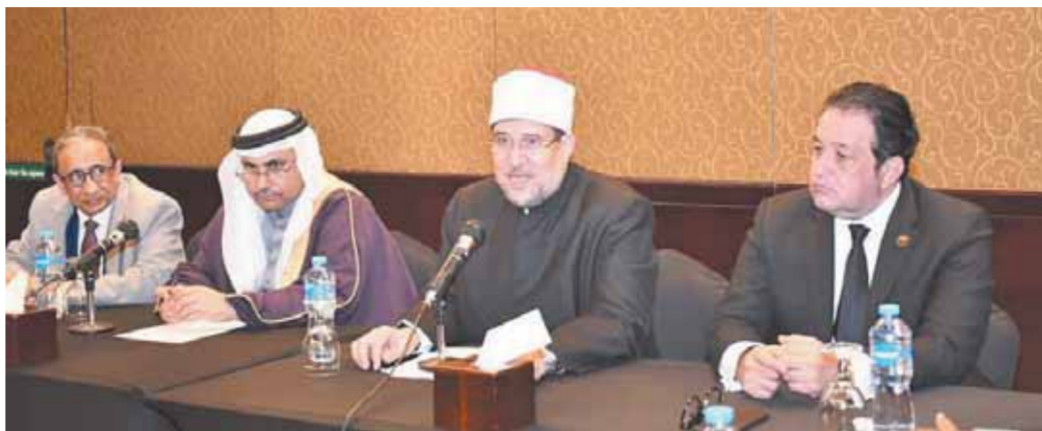
وزير الأوقاف خلال الجلسات