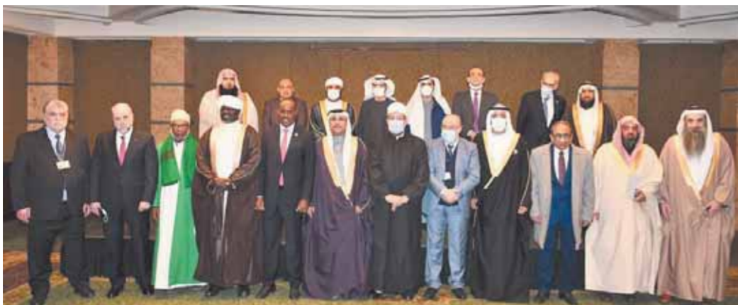
محمد مختار جمعة وسط وزراء الأوقاف في الدول الإسلامية