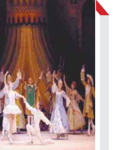
الأوبرا تستقبل فرقة «موسكو على الجليل»