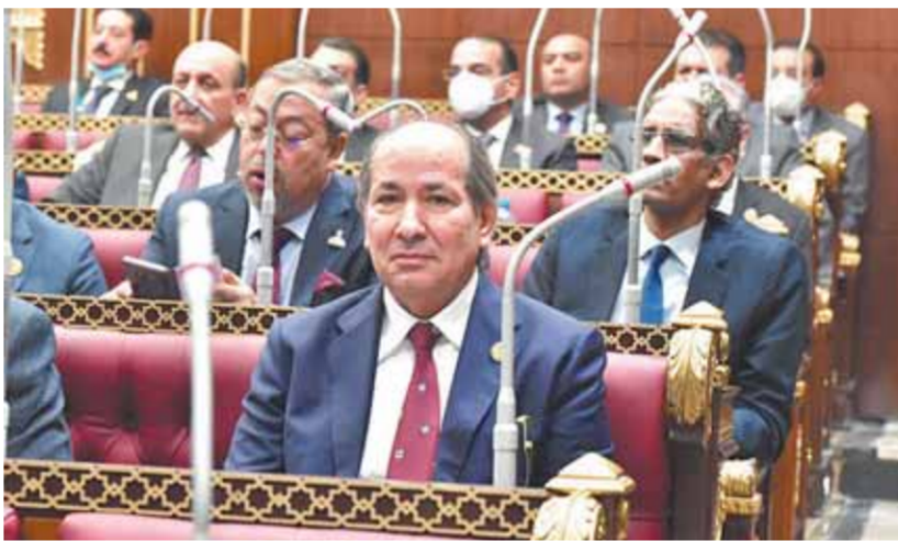
قنديل وتهاى خلال الجلسة