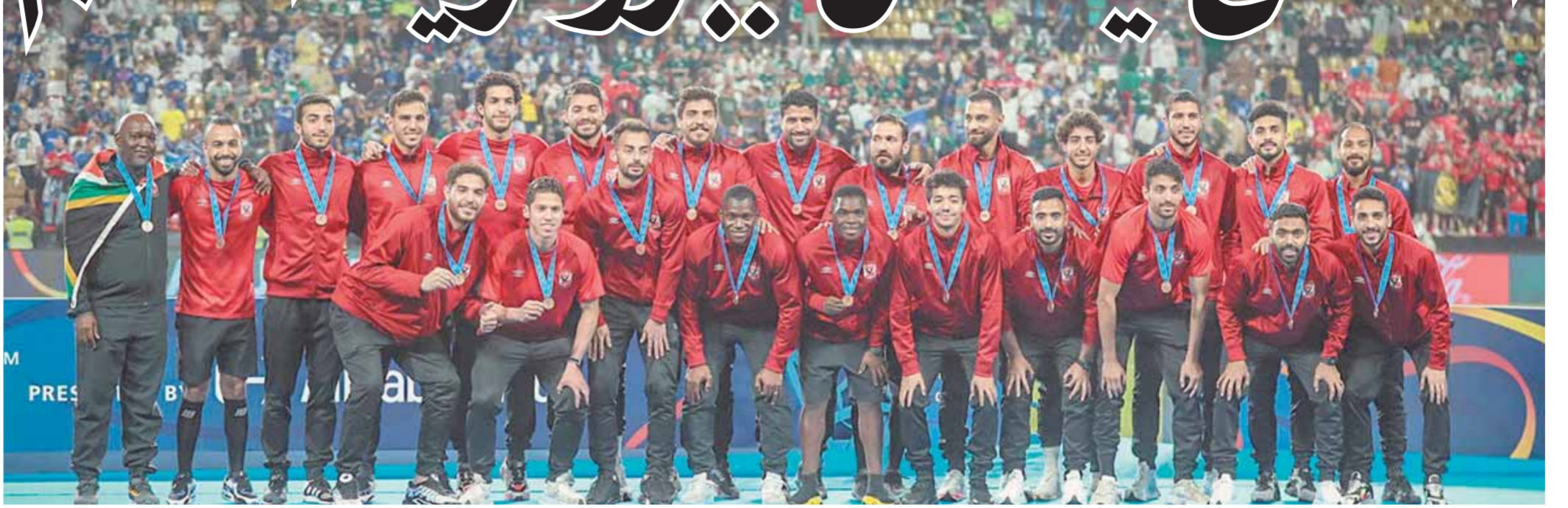
تتويج الأهلى بالبرونزية