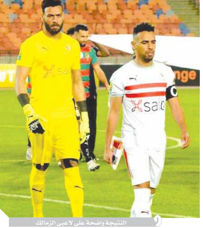
النتيجة واضحة على لاعبي الزمالك