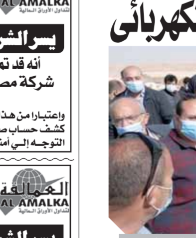
وزير النقل يتفقد العمل بمشروع القطار الكهربائى

كتب - أحمد دراز وشيرين عمجى: تابع الفريق مهندس كامل الوزير - وزير النقل، أمس، في جولة تفقدية أعمال تنفيذ مشروع قطار العين السخنة - الإسكندرية - العين السخنة في المسافة من حلوان حتى العين السخنة مروراً بالعاصمة الإدارية الجديدة، حيث تم الانتهاء من أعمال أبحاث التربة والرفع المساحى وتخطيط المسار. يأتى ذلك في إطار توجيهات القيادة السياسية بتنفيذ شبكة خطوط القطار الكهربائى السريع بإجمالى أطوال ١٧٩٥ كم، وجار العمل في تنفيذ الجسور الترابية والكبارى والأعمال الصناعية للمسار والمحطات والأسوار بواسطة كبريات الشركات المصرية المتخصصة في هذه المجالات. هذا بالإضافة إلى الأعمال الصناعية على الطرق المتقاطعة مع مسار القطار، وبالتزامن مع هذه الأعمال تطلق شركة سيمز الألمانية في أعمال الإشارات والاتصالات والتحكم ونظم الكهرباء، بجانب تصنيع وتوريد ٣٥ قطار ركاب سريعة وإقليمية و١٠ جرارات لنقل البضائع. وأكد الوزير خلال جولته أهمية تكثيف العمل على مدار الساعة والالتزام بالجدول الزمني