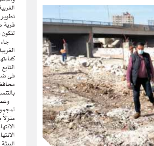
محافظ الجيزة خلال تفقده كوبرى البرنسيصة

كما تفقد المحافظ نسب تنفيذ أعمال التطوير بمحور المنصورة ومحيط المتحف المصرى الكبير والمنطقة الأثرية والبر الشرقى والغربى لطريق المنصورة وهو محور أنور السادات بدءاً من شارع خاتم المرسلين وحتى طريق المنصورة.