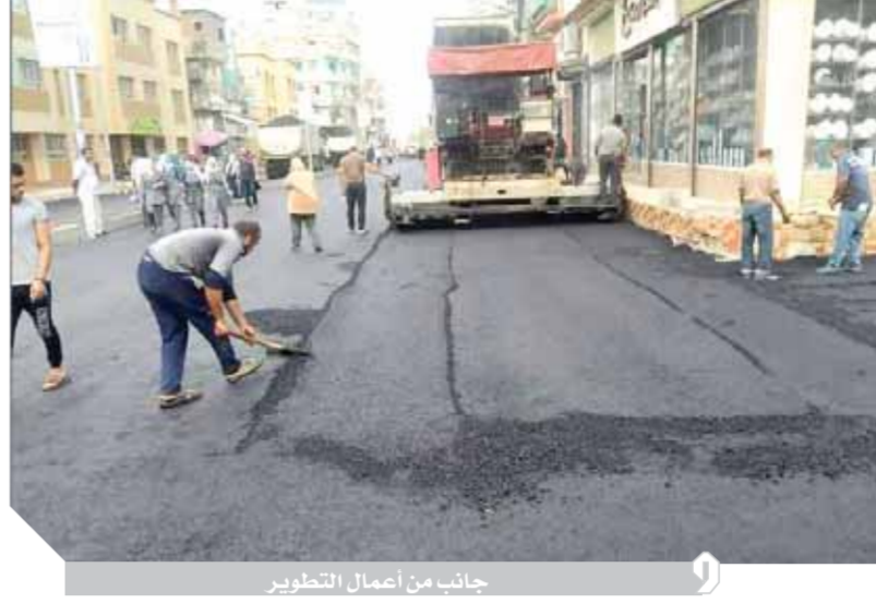
جانب من أعمال التطوير