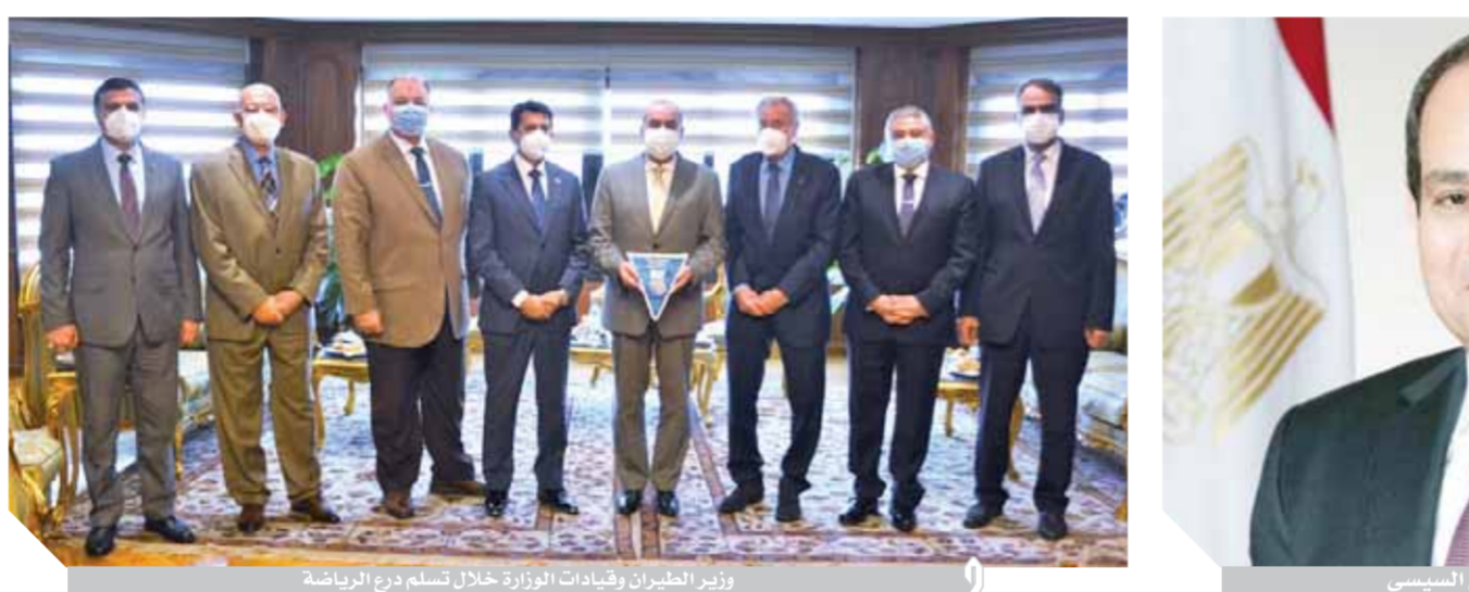
وزير الطيران وقيادات الوزارة خلال تسلم درع الرياضة

«صباحي»: النموذج المصري أثبت كفاءة وفاعلية عالية لأكبر تحد واجهه العالم «جائحة كورونا»