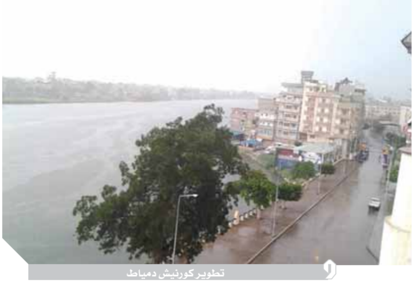
تطوير كورنيش دمياط