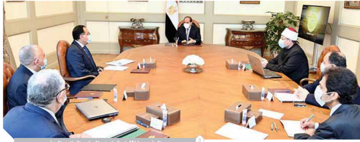
الرئيس خلال اجتماعه بالمجلس الوزاري المصغر

الإسلامية بالخارج بإصدارات الأوقاف، وقد وجه الرئيس في هذا السياق بالاستمرار في تطوير برامج تأهيل الأئمة وكذلك الواعظات، وصقل قدراتهم في التواصل من خلال إتاحة الدراسات العليا للمعلمين بالوزارة، خاصة في مجالات علم النفس وعلم الاجتماع. كما شهد الاجتماع عرض محاور المشروع القومي للتوسع الأفقى للرفعة الزراعية على مستوى الجمهورية، لا سيما في مناطق وسط وشمال سيناء، وتوشكي، والحمام، وغرب المنيا. وقد وجه الرئيس بتعزيز جهود تطبيق الأساليب التكنولوجية الحديثة في الزراعة والتوسع في تطبيق ونشر نظام الري الحديث للأراضي الزراعية على مستوى الجمهورية، وذلك في إطار المشروع القومي لتعظيم الرفعة الزراعية، والتسيق بين وزارتي الزراعة والري وتوفير مياه الري، فضلاً عن رفع كفاءة شبكة الترع وتطهيرها على مستوى الجمهورية وكذلك مشروعات محطات معالجة مياه الصرف.