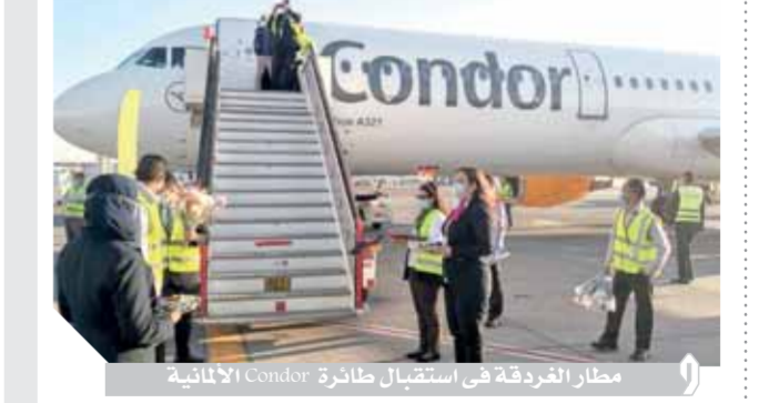
مطار الغردقة في استقبال طائرة Condor الألمانية