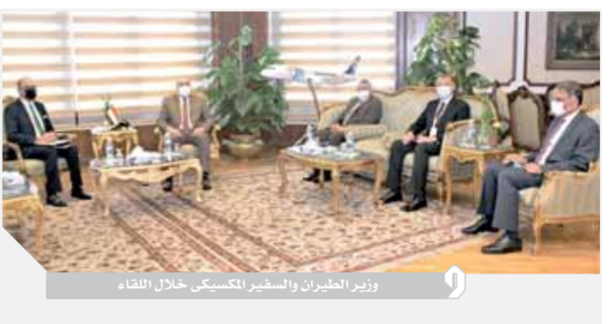
وزير الطيران والسفير المكسيكي خلال اللقاء

منع نائب وزير الطيران المدني وياسم عبدالكريم مساعد وزير الطيران للعلاقات الدولية والإعلام والدكتور مهندس أشرف نوير رئيس سلطة الطيران المدني، وخلال الاجتماع أكد «منار» أن العلاقات الثنائية بين البلدين تشهد تعاوناً ملموساً في العديد من المجالات، مشيراً إلى أن هناك فرصاً وأبعاداً لتعاون مصر والمكسيك في مجال النقل الجوي، وخاصة أن المكسيك تعد من أهم الدول اقتصادياً وسياسياً وأمريكا اللاتينية، وأضاف إلى أهمية الشركة والتعاون في مجال التدريب وتبادل الخبرات بجميع