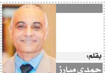
بقلم: حمدي مبارز