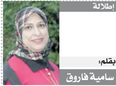
بقلم: سامية فاروق