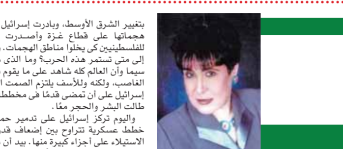
بقلم: سناء السعيد

تتبع رئاسة الجمهورية، وتكون لها الشخصية الاعتبارية، وتتبع مع الاستقلال الفنى والمالى والإدارى، وتهدف الهيئة إلى منع الفساد ومكافحته بكافة صوره واتخاذ الإجراءات والتدابير اللازمة للوقاية منه، ضماناً لحسن أداء الوظيفة العامة وحفاظاً على المال العام وغيره من الأموال الملوكة للدولة. أن انتقال التبعية لرئاسة الجمهورية أعطى المزيد من الاستقلال للهيئة، ولوحظ خلال الفترة الأخيرة دور ملموس وفعال للهيئة في محاربة الفساد وتحررت من أية قيود وتطلعيدها لمكافحة الفساد. حق علينا ومن باب إسناد الفضل لأهله ونحن نكتب للتاريخ