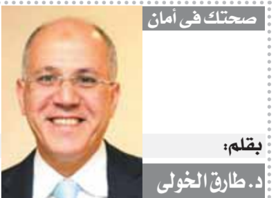
صحتك في أمان

فهد سخر الرجل كل علاقاته وقدراته من أجل الارتقاء بالمحافظة وخدمة أهلهما والحديث عن الاجازات يحتاج مبدات، فضلا عن زمامته وسياسته وأخلاقه الراقية وحركته النشطة في ربيع المحافظة وقوة قراره. وعودة إلى زيارة الوزير للوادي الجديد، حيث حرص المحافظ على اطلاع الدكتور أشرف صبحي على كل ما هو جديد بالمحافظة في زيارات سريعة للعديد من المواقع. وخلال لقاء تم مع شباب بربران الطالع من أبناء الوادي الجديد وشباب من محافظات أخرى كانوا في زيارة للمحافظة ضمن فروع أفواج برنامج «عرب بلده» الذي تنظمه وزارة الشباب، تم فتح باب النقاش وانضمت الوزير والمحافظ لأسئلة الشباب والحاضرين باقتناع بكل صدر رحب دون ملل أو ضجر من أسلوب وحدة حديث بعض المتحدثين من الشباب. بل بالمكنس كان الوزير والمحافظ يستمانان بتكرير وطول بال وتحمل بعض الأسئلة والأسلوب الذي قد يكون به بعض التجاوزات من السائلين.