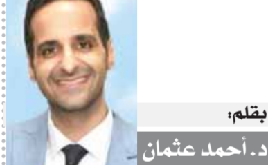
بقلم: أحمد عثمان