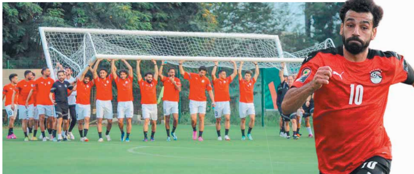
لاعبو المنتخب يتقلون الرمي قبل التدريب الأخير