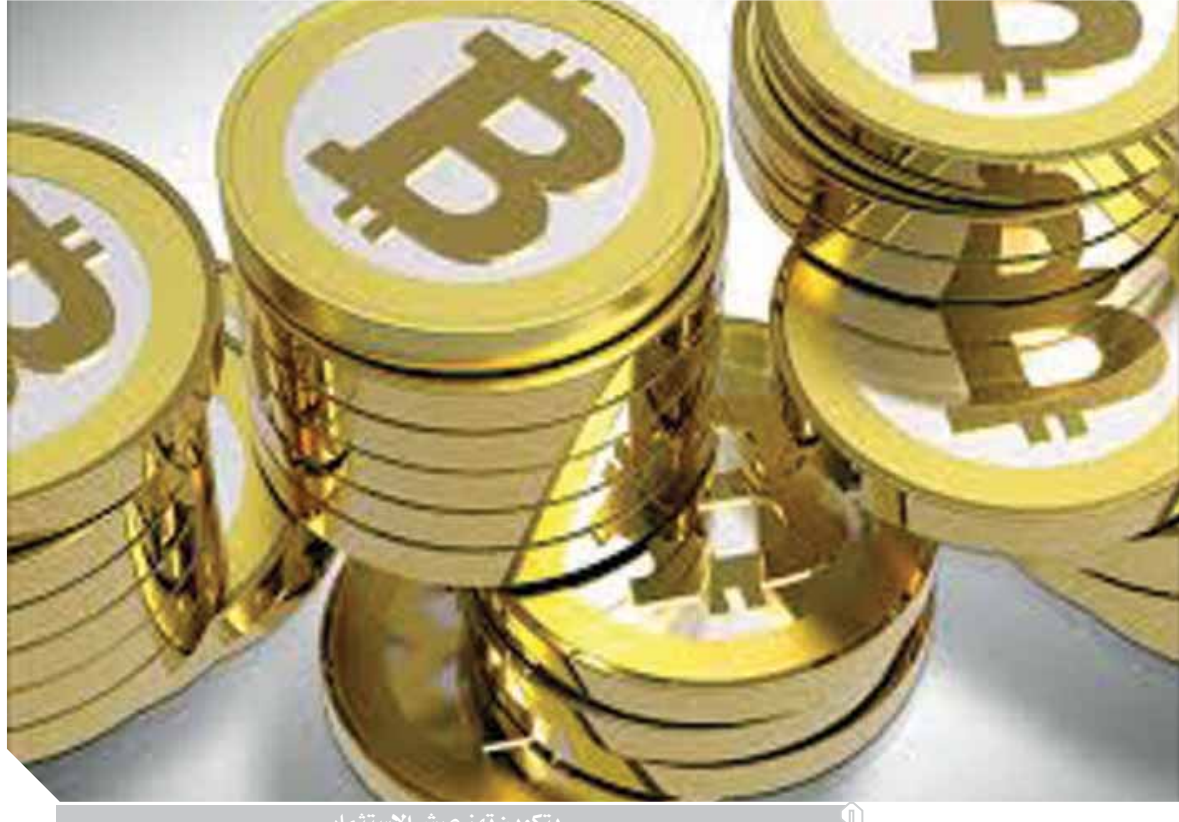
بيتكوين تهز عرش الاستثمار

لغاية قياساً على أرباح البيتكوين التي فاقت الـ ٣٠٠٪. وهنا يجب الانتباه إلى أن عملة البيتكوين تحمل مخاطر عالية للغاية كونها عملة غير رسمية وغير معترف بها إضافة إلى تقلباتها