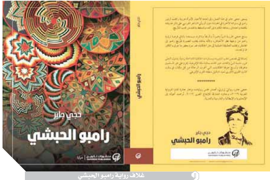
غلاف رواية رامبو الحبشى

عديدة بعضها سبقتنى فى التجربة وأخرى جاءت بعدى لكن شتاتنا يصعب من فرصة أن تكون على دراية تامة بما يستجد من أعمال أو أسماء.