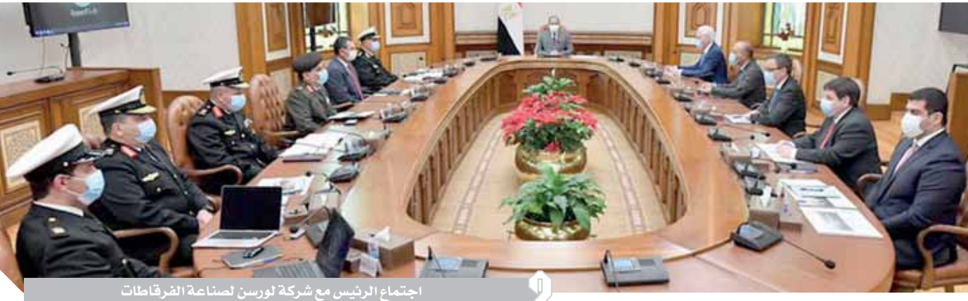
اجتماع الرئيس مع شركة لورسن لصناعة الفرقاطات