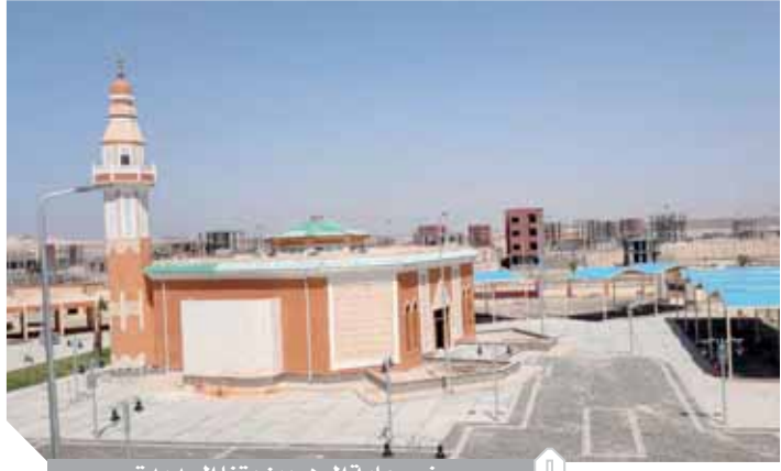
مبنى رعاية الموهوبين بقنا الجديدة