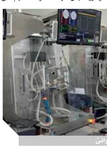
إنشاء معامل بالموانئ

وأضافت أن وجود هذه المعامل المركزية بكل ميناء سوف تسهم في