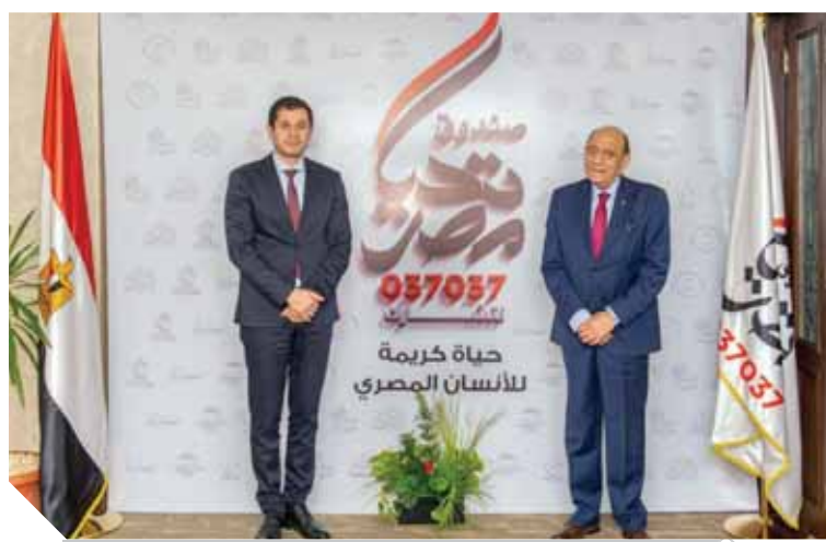
المستقبل تدعم صندوق تحيا مصر

جدير بالذكر أن شركة المستقبل دعمت صندوق تحيا مصر في يوليو من العام الماضي بقيمة ٥ ملايين جنيهه لمواجهة الأزمات وخاصة تداعيات جائحة فيروس كورونا المستجد «Covid-١٩».