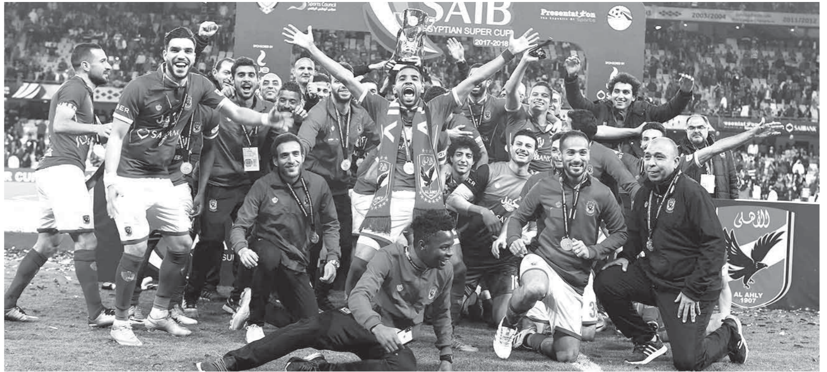
فرحة لاعبي الاهلى