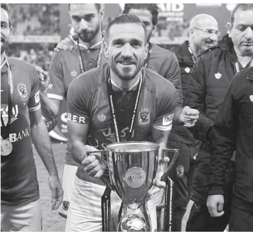
على معلول وفرحة الكأس