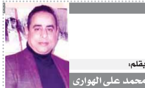
بقلم: محمد على الهوارى