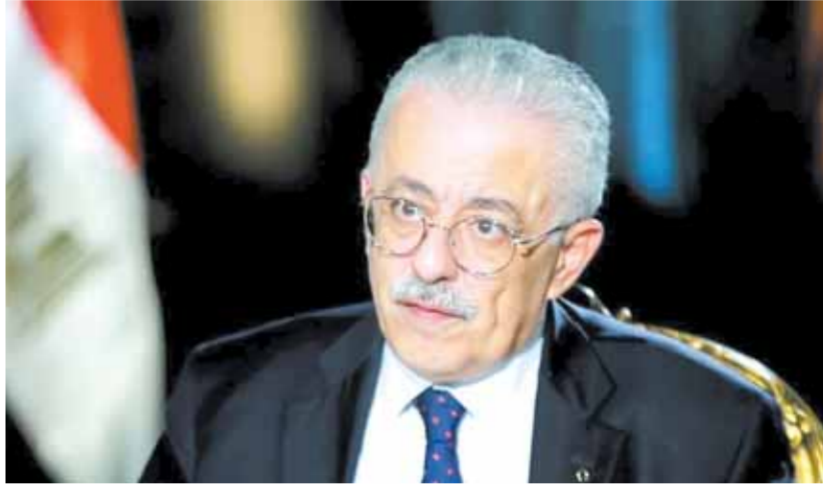
شوقي يهوب من مواجهة البرلمان