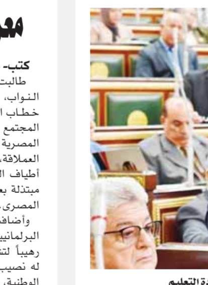
وهذان يوافق على تعديلات قانون إنشاء الهيئة القومية لضمان جودة التعليم

وأقر القانون إنشاء لجنة تسمى اللجنة الاستشارية العليا للإطار الوطنى للمؤهلات وترئسها وعدد أعضائها، ومدة رئاسة وعضوية اللجنة، ويصدر بتشكيلها قرار من رئيس مجلس الوزراء بناء على عرض رئيس مجلس إدارة الهيئة، كما تعتمد توصيات اللجنة من مجلس إدارة الهيئة، وتحدد اللائحة التنفيذية لهذا القانون ضوابط وإجراءات عملها. ونص القانون على أن تختص اللجنة الاستشارية المنوطة بتبعية الإطار الوطنى للمؤهلات واقتراح السياسات والاستراتيجيات اللازمة لتحقيق أهداف الإطار، على أن تحدد اللائحة التنفيذية لهذا القانون الاختصاصات الأخرى للجنة، وكذلك اختصاصات رئيسها.