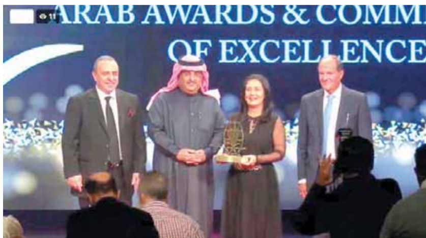
كشميري تتسلم الجائزة من الاتحاد الدولي للمصرفيين