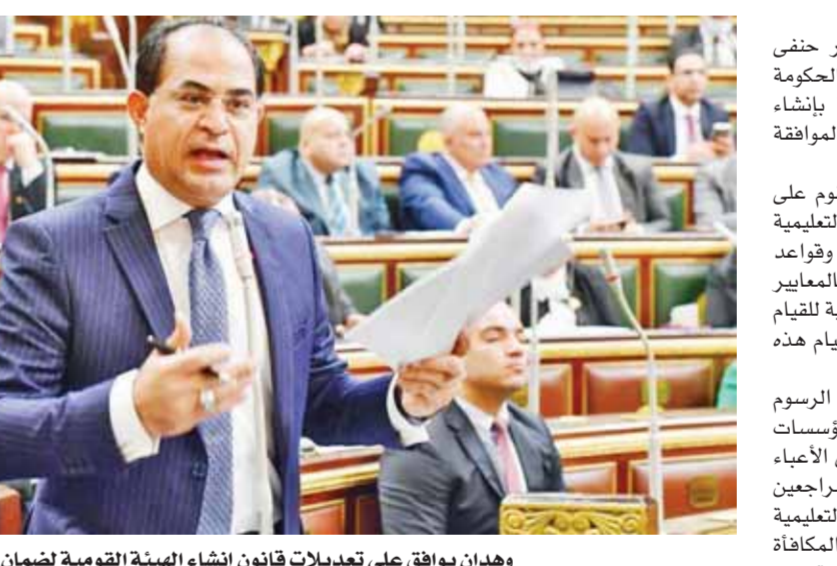
وهذان يوافق على تعديلات قانون إنشاء الهيئة القومية لضمان جودة التعليم

وأقر القانون إنشاء لجنة تسمى اللجنة الاستشارية العليا للإطار الوطنى للمؤهلات وترئسها وعدد أعضائها، ومدة رئاسة وعضوية اللجنة، ويصدر بتشكيلها قرار من رئيس مجلس الوزراء بناء على عرض رئيس مجلس إدارة الهيئة، كما تعتمد توصيات اللجنة من مجلس إدارة الهيئة، وتحدد اللائحة التنفيذية لهذا القانون ضوابط وإجراءات عملها. ونص القانون على أن تختص اللجنة الاستشارية المنوطة بتبعية الإطار الوطنى للمؤهلات واقتراح السياسات والاستراتيجيات اللازمة لتحقيق أهداف الإطار، على أن تحدد اللائحة التنفيذية لهذا القانون الاختصاصات الأخرى للجنة، وكذلك اختصاصات رئيسها.