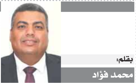
بقلم: محمد فؤاد