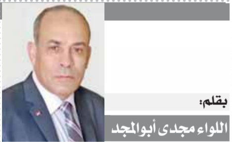
بقلم: اللواء مجدى أبوالمجد