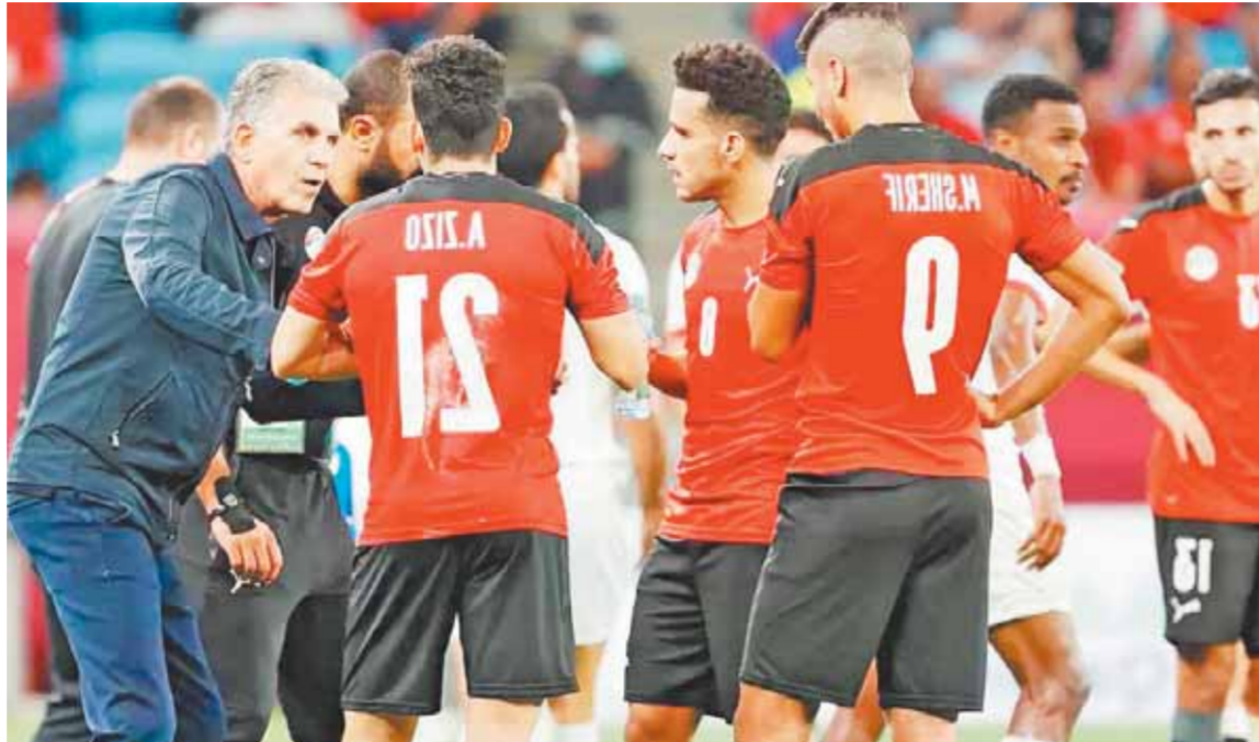
المنتخب خرج بانتصار مهم أمام الأردن

وقبل منح أي شاب مقادير السيارة وتركه يتحكم في زمامها، علينا أولاً أن نتأكد من قدرته على ضبط النفس، وقدرته على أن يتحكم في انفعالاته، وأدراكه لحجم المسؤولية الملقاة عليه في الحفاظ على أرواح الآخرين، وعدم استخدام السيارة بشكل خاطئ يضر بالغير، أو يخل بقدسية الطريق، واختيار مدى التزامه بشكل قاطع بلوائح الطرق وقوانينها، وعلى إدارة المرور أن تأخذ بمقياس الاختبارات النفسية قبل إعطاء رخصة القيادة، وعلى المجتمع قبل المرور أن يمنع أي شخص غير مسئول من قيادة السيارة. أرجو من كل من يقود سيارة حماية نفسه وغيره من هذا الخطر الداهم، من خلال الالتزام بالسرعات المحددة ولا يتسابقوا بسرعات جنونية على الطرق، وألا يتساقطوا بالهواتف المحمولة أثناء القيادة، والالتزام بقواعد المرور، وميمنة السيارة بشكل دوري والتحقق من معايير الأمان قبل شرائها، حتى تقلل من نزيف الطرق. علينا جميعاً أن ننتبه لتلك الأزمة قبل أن تتحول إلى كارثة حقيقية تهدد المجتمع بأسره، ونربى أبنائنا على الالتزام بالحكمة، وإتباع آداب الطريق، وتحمل مسؤولية قيادة السيارة، حتى نتفقد أرواح أخواتنا المواطنين، ونوقف نزيف الدماء على «الأسفلت»، ونحمي قلوب الآباء من الانفطار على أبنائهم الذين يموتون فجأة نتيجة التهور والاندفاع غير المسئول.