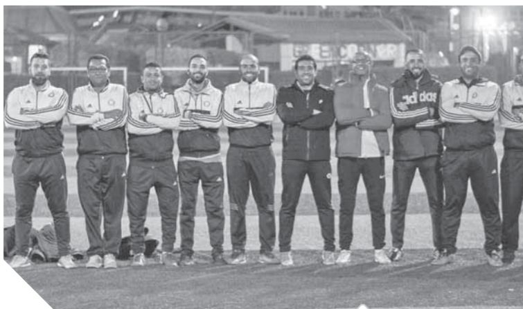
تفلة جماعية لتدريبي قطاع الناشئين

الحرب الآن ليست على الإرهاب الأسود فقط ولكن كما طلب الرئيس عبد الفتاح السيسي على الفاسدين المنتشرين الآن في كل مكان.