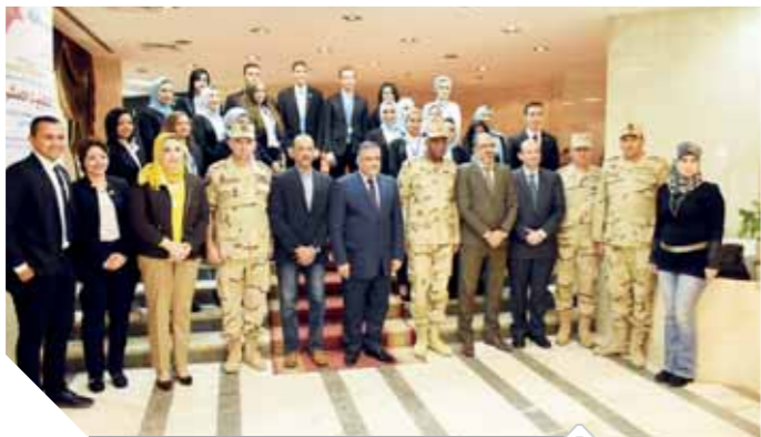
المشاركون في الندوة التثقيفية

الشارح المصري من جديد، مشاركاً وداعفاً للدولة المصرية بقيادة الرئيس عبدالفتاح السيسي. وقال «الشرفاوي» إن حزب الوفد بما يملك من تاريخ كبير في العمل السياسي، يمثل قاطرة المعارضة الوطنية البناءة قيادات بيت الأمة. وأعرب «الشرفاوي» عن سعادته بالانضمام لبيت الأمة الذي يمتد تاريخه لـ ١٠٠ عام من الكفاح والنضال، مشيداً بالرؤية الحكيمة للمستشار بهاء الدين أبو شقة، الذي أعاد الوفد بقوة إلى