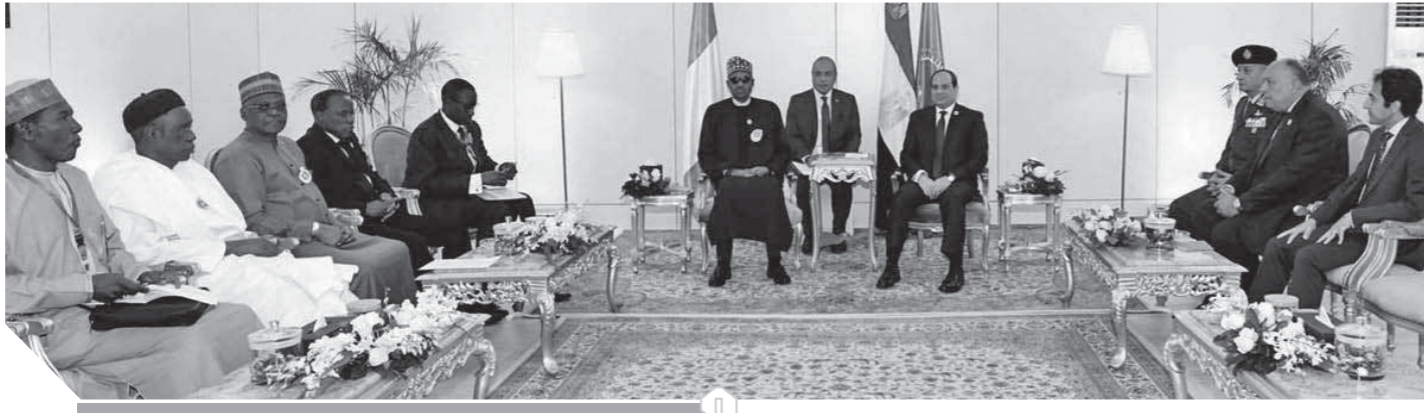
السيسي، يستقبل نظيره النيجيري