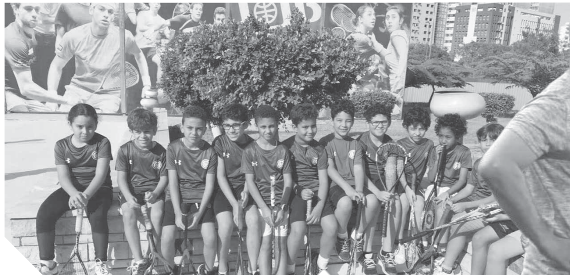
سموحة يفرخ ويخرج العديد من أبطال الاسكواش سنوياً