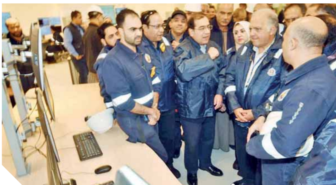
وزير البترول والوقود البرلماني خلال زيارة المحطة البرية لحقل ظهر