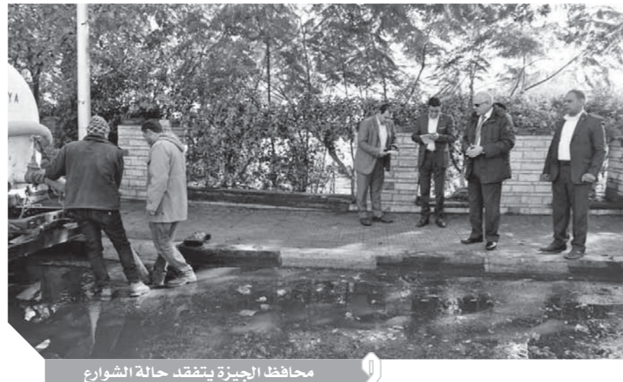
محافظ الجيزة يتفقد حالة الشوارع

شفت مياه الأمطار من على الحاور والطرق الرئيسية والانفاق والكبارى بالتزامن مع هطول الأمطار، حيث تابع المحافظ أعمال شطف وإزالة آثار الأمطار بأحياء جنوب وشمال الجيزة والدقى والعجوزة والهرم والطابية للتأكد من عدم تأثير مياه الأمطار على