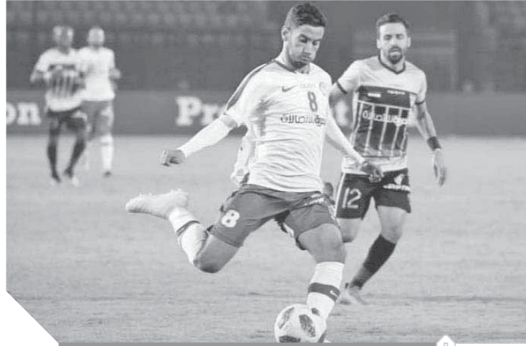
فريق سموحة يسعى للتواجد في المريخ الذهبي