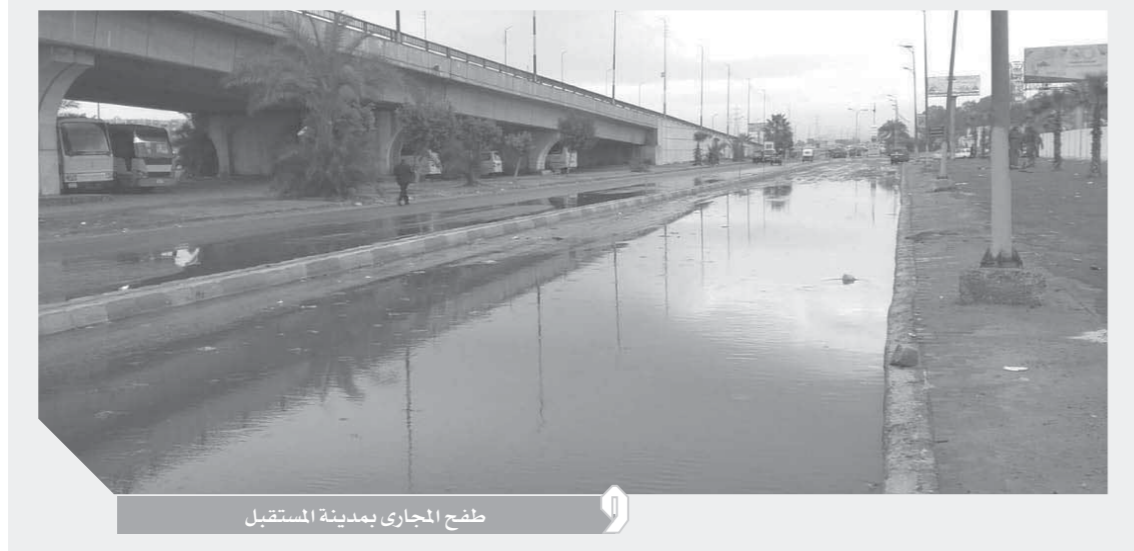
طفح المجارى بمدينة المستقبل