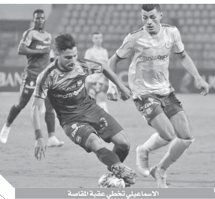
الإسماعيلي تحطى عقبة المقاصة