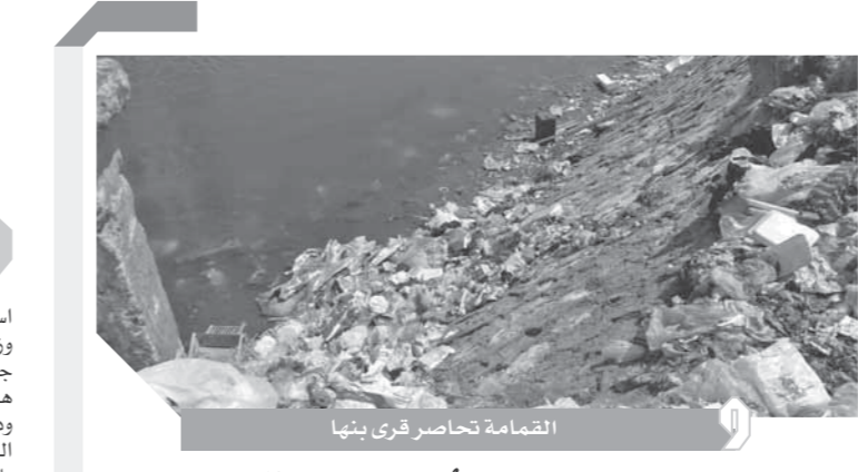
القمامة تحاصر قري بنها