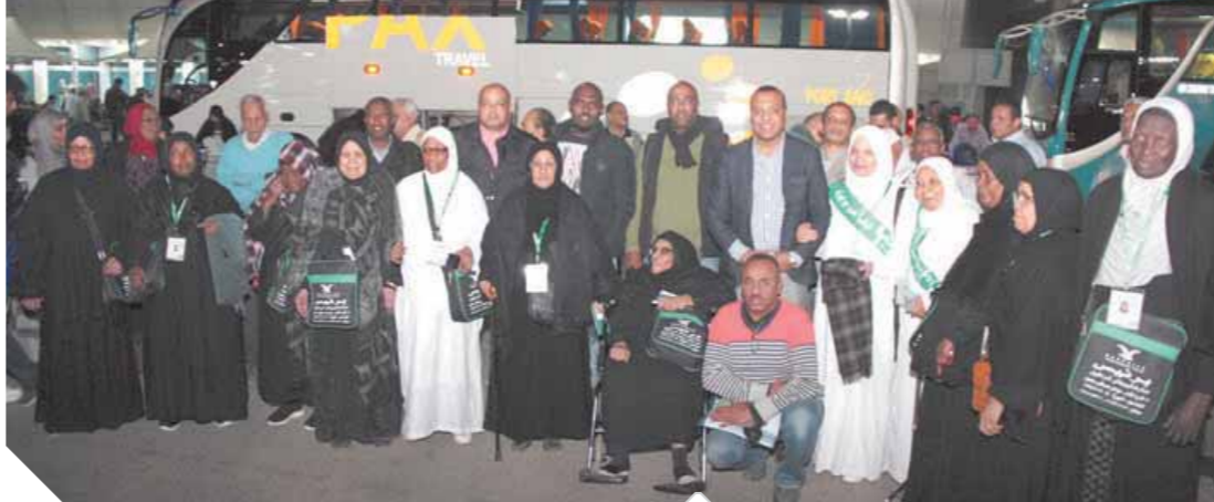
الفاضون بالعمرة من بولاق الدكرور والنوبة

عام، مؤكداً أن هذه الرحلات مجانية بدون تكاليف.