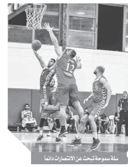
سلة سموحة تبحث عن الانتصارات دائماً

تعيش فرق كرة السلة للرجال والسيدات بنادي سموحة أفضل عصورها من خلال تحقيقها التي تحققت في البطولات، حيث نجح الفريق الأول للرجال الموسم الماضي في الفوز بالمركز الثالث في بطولة أفريقيا للأندية الأبطال وتحقيق نتائج ممتازة في بطولة الدوري المرتبط هذا الموسم واحتلال المركز الخامس ثم الإطاحة بفريق الجزيرة حامل اللقب من دور ال١٦ بطولة كأس مصر أما فريق الانشاد فقد كان قاب قوسين أو أدنى من الوصول إلى نهائي الدوري المرتبط قبل أن يخسر بصعوبة بالغة من فريق النادي الأهلي في الدور نصف النهائي ويحقق في النهاية المركز الثالث.