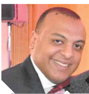
عمرو أبو اليزيد

تشمل العمرة قضاء ١٥ يوماً منها ١٠ فى مكة المكرمة وهى المدينة المنورة من خلال التعاقد مع أفضل الشركات السياحية لتنظيم العمرة، موضعاً أنه ستتم زيادة رحلات العمرة فى السنوات المقبلة حسب الإمكانيات المادية. وتابع «أبو اليزيد» «نكن كل الاحترام والتقدير لسيدات بولاق الدكرور لأنهن تاج على رأسى ودى أهل حاجة تقدم لهن وأتمنى تنظيم رحلات عمرة لسيدات بولاق الدكرور ٢٣ مليون سيدة، ووجهت سيدات بولاق الدكرور الشكر للنائب عمرو أبو اليزيد الذى كان فى وداعهن بمطار القاهرة معبرات عن فرحتهن الكبيرة بتحقيق حلمهن بزيارة الكعبة والرسول عليه الصلاة والسلام داعيات الله أن يزيد من النعيم وعمل الخير لأهالى الدائرة. وأشارت السيدات إلى أنهن لم يتوقعن فوزهن فى مسابقة الأم المثالية ولكن حلمهن تحقق.