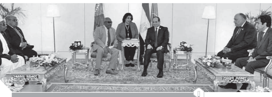
..وخلال لقائه رئيس جزر القمر

عقد الرئيس عبدالفتاح السيسي أمس بأسوان، لقاء قمة مع الرئيس غزالي عثمان، رئيس جمهورية جزر القمر. وصرح السفير بسام راضي، المتحدث الرسمي باسم رئاسة الجمهورية، بأن السيسي أشاد بالعلاقات التاريخية التي تجمع بين البلدين، على المستويين العربي والإفريقي، فضلاً عن الروابط المتميزة بين الشعبين الشقيقين، في ظل العدد الكبير للدارسين الوافدين من جزر القمر في مصر.