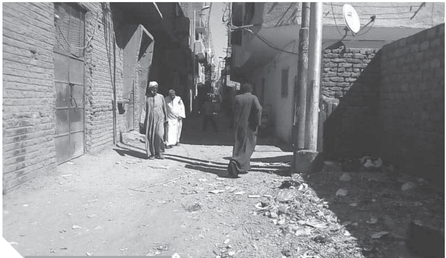
المنازل تعوم في مياه الصرف الصحي

على يرك من المياه الجوفية ومياه البيارات التي تحتاج إلى الكسح مرتين يوميا وربما أكثر، ويمبالغ تصل إلى ١٥٠٠ جنيه شهريا للأسرة الواحدة. وتحولت تلك الأمل إلى خيبات فور علم الأهالي بحرمان الشارع من توصيل الصرف الصحي له، بالرغم من أنه أكبر الشوارع الحيوية في مدينة نقادة كونه يحتوى على السنترال ومدرسة التجارة وعدد من مدارس التعليم الأساسي.