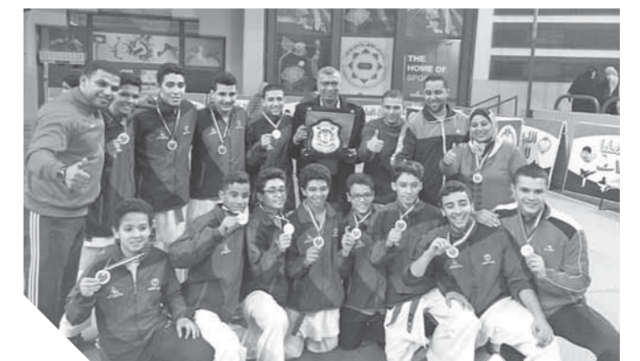
كاراتيه سموحة حقق العديد من البطولات