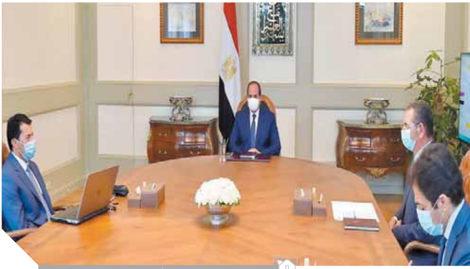
السيسي، خلال لقائه أشرف صبحي وزير الرياضة

الرياضة التي ستشملها البطولة، مشيراً إلى أن البطولة ستشهد مشاركة ٢٢ دولة لأول مرة في تاريخها وإقامة ١٠٨ مباريات في ٤ صالات مختلفة بثلاث محافظات، بالإضافة إلى توفير ١٠ صالات رياضية أخرى لاستضافة تدريبات المنتخب، كما سيتم اختيار ما يقرب من ١١٠٠ متطوع من أفضل العناصر الشابة للمشاركة في تسيير البطولة، مع وضع برنامج تدريبي مكثف لهم حول التعامل مع الفرق والوفود ومبادئ الإسعافات الأولية، وذلك للمساهمة في إخراج البطولة بأفضل صورة مشرفة.