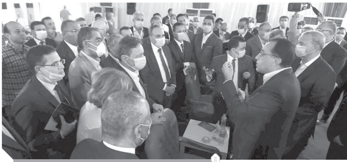
الدكتور مصطفى مدبولي خلال جولته بالقليوبية

أكد اللواء عبدالحميد الهجان، محافظ القليوبية، أن الحكومة تتصدى بكل حزم لأية محاولات جديدة للبناء المخالف، الذى يمثل تكريسا للعشوائية ويقوض جهود الدولة الرامية إلى مواجهة العشوائيات، ونقل سكانها إلى تجمعات سكنية حضرارية وأمنة وصحية، مشيراً إلى أن ذلك يظهر جلياً فى المشروعات القومية للإسكان كبدل للعشوائيات التى افتتحها الرئيس عبدالفتاح السيسى، رئيس الجمهورية، خلال الفترة الماضية، ولا يزال يتم تنفيذ العديد من تلك المشروعات.