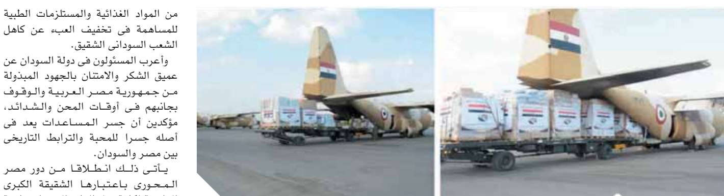
مازالت رحلات الجسر الجوي مستمرة لتقديم الدعم للسودان الشقيق

من المواد الغذائية والمستلزمات الطبية للمساهمة في تخفيف العبء عن كاهل الشعب السوداني الشقيق. وأعرب المسؤولون في دولة السودان عن عميق الشكر والامتنان بالجهود المبذولة من جمهورية مصر العربية والوقوف بجانبهم في أوقات المحن والشدائد، مؤكداً أن جسر المساعدات يعد في أصله جسراً للمحبة والترابط التاريخي بين مصر والسودان.