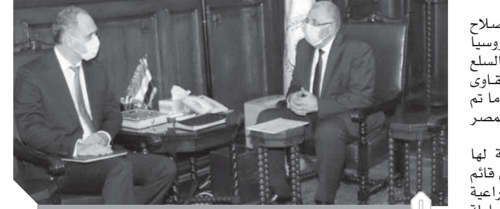
وزير الزراعة مع سفير بيلاروسيا

بياروسيا وهناك عدد من المعارض للمعدات البيلاروسية الزراعية تم إنشاؤها فى عدد من المدن المصرية، إلا أنه شدد فى الوقت نفسه على أهمية إنشاء مراكز لصيانة هذه المعدات حتى يكون هناك استفادة قصوى من هذا التعاون. وأشار السفير البيلاروسى إلى أن مصر تمثل حجر الزاوية بمنطقة الشرق الأوسط وناطقة للانطلاق نحو أفريقيا وأن هناك تعاوناً قائماً بالفعل بين وزارة الإنتاج الحربى وبعض الشركات العاملة ببيلاروسيا فى هذا المجال، كما أن بلاده ترغب فى توسيع علاقات التعاون مع مصر فى قطاع الزراعة خاصة فيما يتعلق بمجال إنتاج التقاوى والبحوث الزراعية.