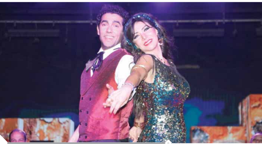
مشهد من مسرحية سيد درويش

إبراهيم واهتم بإبراز تفاصيل شيقة فى حياة فنان الشعب سيد درويش، وعلاقته بجلبلة العالمية، ورأيت فى دورى لونا أجه ويرضى طموحى سواء كان الدور أو العمل ككل. وعن أسباب حماسها لبطولة مسرحية سيد درويش قالت: أبحث دائماً عن التجديد والأدوار المختلفة وأميل للادوار التى تحوى مزيجاً من الفنون ويكون بها غناء واستعراض، بالإضافة إلى التمثيل، خاصة إذا كان الدور على خشبة المسرح، حيث المساحة التى تفرضها الشخصية، مع مواجهة الجمهور، كل ذلك يعطى دفعة للفنان على التألق، والمسرحية صنعت هذا المزيج الرائع الذى يقدم الطرب والاستعراض والحياة المليئة بالدراما. وعن الاستعداد لشخصية جلييلة قالت: جلييلة العالة، إحدى الشخصيات الواقعية الموجودة فى حياة فنان الشعب سيد درويش، ولذلك كان من السهل دراستها ومعرفة علاقتها بدرويش ومدى تأثره بها فى بداية حياته فى الإسكندرية، هذا التأثر الذى جعله يقدم أروع أغانيه وألحانه التى لا تزال محفورة فى وجدان كل مصرى، وفترات عن هذه الشخصية وتدرت على الرقص الشرقى.