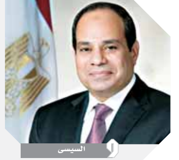
كتبت - أمانى سلامة:

الوقت في عهد الرئيس السيسي بعد بالهجوم أو الأسابيع ولا حتى بالأيام... والعرق والتعب ولا يتنازل الرئيس عن أن يكون مقابل ذلك جسداً من الإجازات رغم التحديات، وعندما يكون هذا هو نهج رئيس الجمهورية فياطلع لن يرضى عن أن يكون هذا هو أداء رحالته في مرحلة من أصعب المراحل في حياة مصرنا الحبيبة وهي مرحلة البناء، ويعد قطاع الطيران المدني جزءاً مهماً ولا يتجزأ من