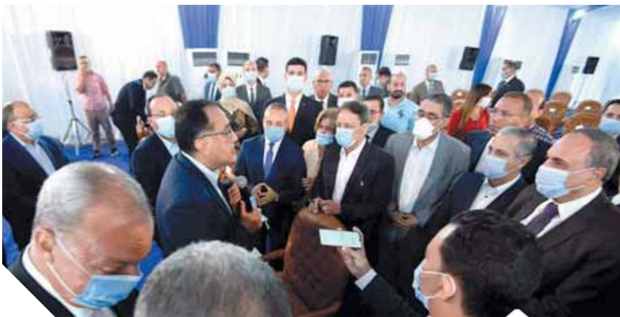
رئيس الوزراء خلال حوار مع الصحفيين بالقليوبية

المخالف حفاظاً على كنوز مصر من الأراضي الزراعية والحفاظ على الأمن الغذائي للأجيال القادمة. وقال مدبولي: إن استمرار تزييف الأراضي الزراعية يهدد قضية توفير الغذاء لـ 100 مليون مواطن في المستقبل، بعد الاعتداء على 400 ألف فدان زراعي على مدار 40 عاماً، منها الاعتداء على 90 ألف فدان زراعي منذ عام 2011 حتى الآن. وأضاف مدبولي أن الحكومة لن تسمح بأي مخالفات أو بناء عشوائي جديد ولا بد من تقنين المخالفات القديمة، ودعا المواطنين إلى الإسراع في تقديم طلبات التصالح قبل نهاية المهلة حتى 30 سبتمبر، وقال «مدبولي» إن الحكومة تعلم أن قرار تطبيق هذا القانون لا يلقى قبولا في الشارع من الناحية السياسية ولكن لا بد من وقف البناء العشوائي لمصلحة المواطن، موضحاً أن قانون التصالح لخدمة المواطن وليس لعقابه، وأشار في رده على أسئلة الصحفيين أن هناك المئات من موظفي المحليات من المتورطين في السماح بالبناء المخالف.