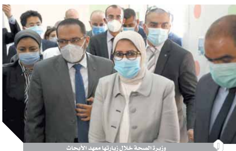
وزيرة الصحة خلال زيارتها معهد الأبحاث

الأولى وتمت على عدد من الأصحاء لاختبار المأمونية وقياس الفعالية والجرعة القياسية لإنتاج أجسام مضادة بمستوى مناسب، وتمت المرحلة الثانية على عدد أكبر من المتطوعين والتي انتهت إلى ثبوت فاعلية وأمان اللقاح على المشاركين، ثم بدأت المرحلة الثالثة لاختبار اللقاح على مجموعة أكبر من دول العالم المختلفة وتعد مصر من ضمن تلك الدول والتي تهدف لاستكمال اختبار المأمونية والفاعلية على عدد أكبر في أماكن مختلفة.