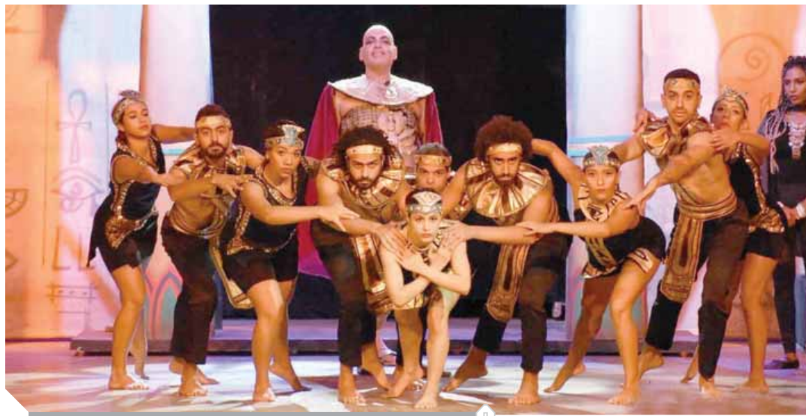
مشهد من حفل ختام المهرجان التجريبي