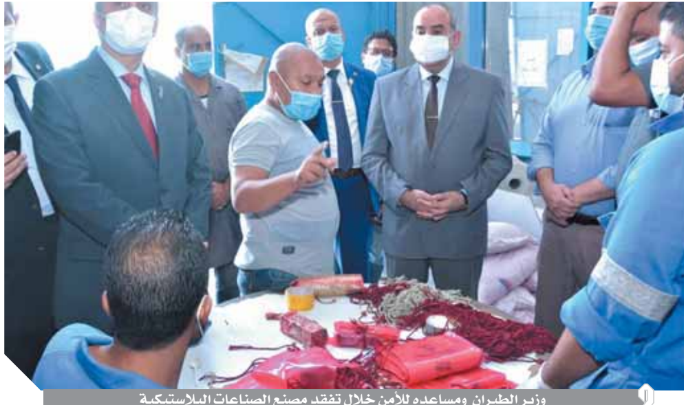
وزير الطيران ومساعدته للأمن خلال تفقد مصنع الصناعات البلاستيكية

تفقد الطيار محمد منار وزير الطيران المدني مصنع الصناعات البلاستيكية التابع لشركة مصر للطيران للصناعات المكملة رافقه اللواء طارق نصير مساعد وزير الطيران للأمن. وخلال الجولة تفقد وزير الطيران الإجراءات الاحترازية والوقائية المطبقة داخل المصنع للحفاظ على سلامة وصحة العاملين، كما استمع إلى شرح تفصيلي عن أنشطة وخدمات المصنع من الشركات التابعة لوزارة الطيران، بالإضافة إلى مستلزمات الوقاية من فيروس كورونا من كامات وواقى وجه وقنارات التي يقوم المصنع بإنتاجها خلال الفترة الحالية، كما اطلع على خطط التطوير والتحديث في خطوط إنتاج الشركة والتوسع في الصناعات البلاستيكية، خاصة تصنيع أدوات الوجبات على الطائرات.