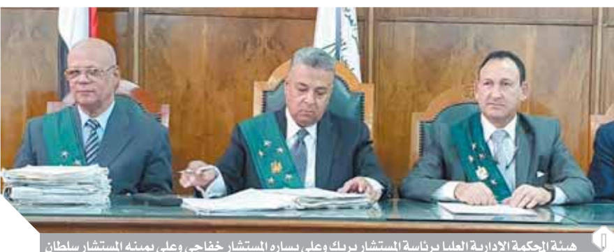
هيئة الحكمة الإدارية العليا برئاسة المستشار بريك وعلى يساره المستشار خفاجي وعلى يمينه المستشار سلطان

معاملة خاصة بوضع يده على موضع فتحة البنطلون ملاصقا جسدهن واصطحب بعض الطالبات بسيارته الخاصة إلى مقر مسابقة أوائل الطلبة بوضع يده تارة على كتافهن وتارة أخرى على أرجلهن. كما أكدت المحكمة أن سيل الطموح التي فصلت فيها المحكمة لمعلمين تحرشوا بالتلميذات والطالبات والأطفال بالمدارس تستهضه همة وزارة التربية والتعليم عن طريق أجهزتها التربوية المختصة إلى طرح الظاهرة ووضع النظم اللائحة الصارمة والتحرش بطالبات المدرسة بأكملها دون استثناء وموضوعياً لتجسس ظاهرة التحرش الجنسي في المدارس يجب التعامل معها باعتبارها فعلاً وسلوكاً اجتماعياً معيها يستحق الدراسة والتحليل لخلق الوعي المجتمعي.