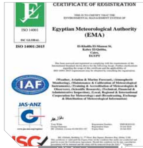
إحدى شهادات الأيزو

العالمية في كل أنشطة الطيران المدني. مؤكداً أن الوزارة تحرص دائماً بالسعي قدماً نحو التقدم والارتقاء بمستوى الخدمات المقدمة، وكذا الاهتمام بتطوير العاملين وتنمية مهاراتهم لمواصلة تطبيق أفضل الممارسات العالمية بما يتماشى مع تحقيق أهداف التنمية المستدامة ورؤية مصر المستقبلية ٢٠٣٠.