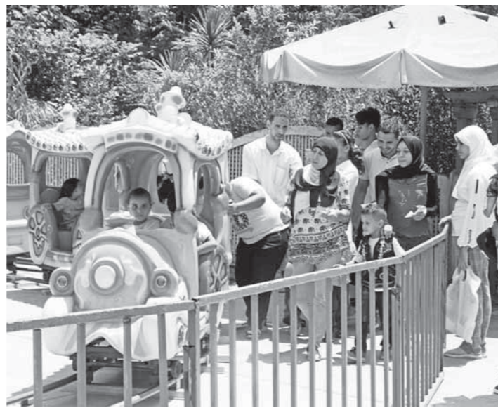
الأسر على التقاط الصور التذكارية أمام أقفاص الحيوانات والطيور النادرة بجانب السماح للبعوض بإطعام الحيوانات، كما شهدت الحديقة منذ الصباح الباكر تواجداً أمنياً مكثفاً لتنظيم عملية الدخول للحديقة منذاً لحديث تدافع أو أي شيء يفسد فرحة العيد على الزوار.