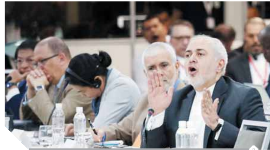
وزير خارجية إيران أثناء المشاركة فى المنتدى الاقتصادى الأول لدول بحر قزوين

وكان مجلس الوزراء قد وافق الخميس الماضى على الإسناد المباشر لشركة المقاولون العرب لتنفيذ أعمال إصلاح التلغفيات بالمعهد القومى للأورام، وذلك فى ضوء الحاجة الملحة لتسريع الإنجاز، وعودة المبنى إلى حالته الأصلية، واستكمال تقديمه الخدمة الطبية للمواطنين.