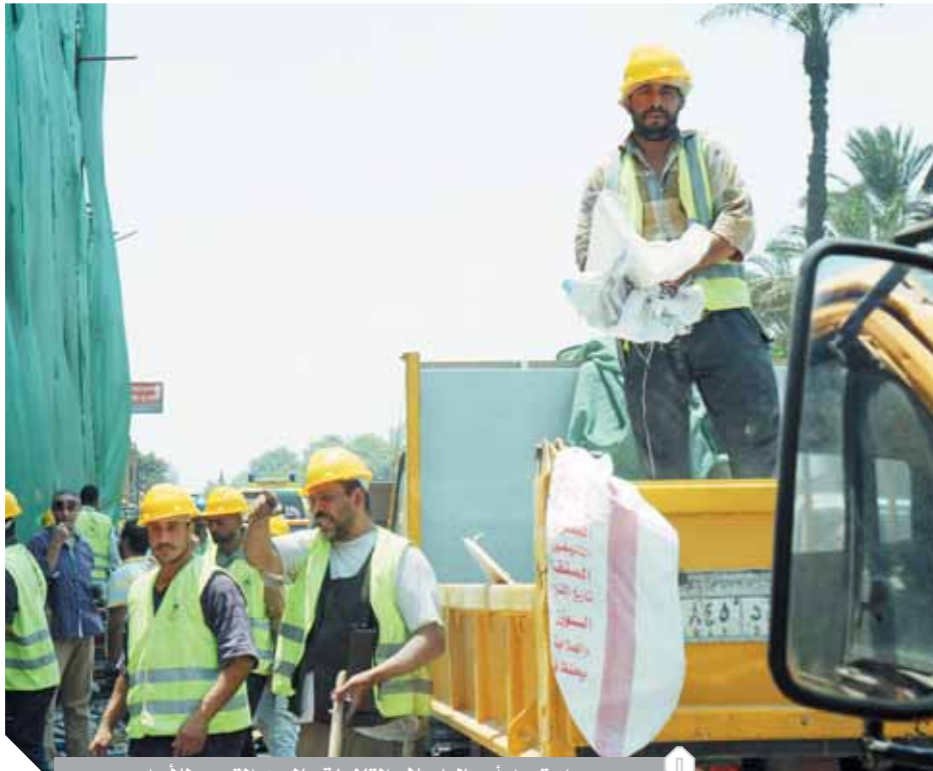
استمرار أعمال إصلاح التلغفيات بالمعهد القومى للأورام