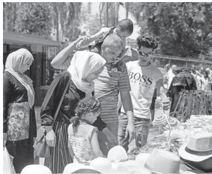
الباكر تواجداً أمنياً مكثفاً لتنظيم عملية الدخول للحديقة منذاً لحديث تدافع أو أي شيء يفسد فرحة العيد على الزوار.