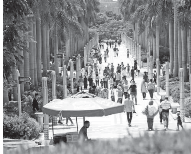
وعلى «نصر» في تصريحات خاصة له الوفد» أن نسبة زيادة الأعداد في ثاني أيام عيد الأضحى هو انشغال المواطنين بالذبح في اليوم الأول أكثر من الخروج للفسح، مؤكداً تواجد الأمن وكافة الاحتياطات من أجل سلامة المواطنين، تيسيراً لهم للاحتفال بالعيد كما تواجد منذ صباح أمس مئات الزوار على حديقة الأسماك.