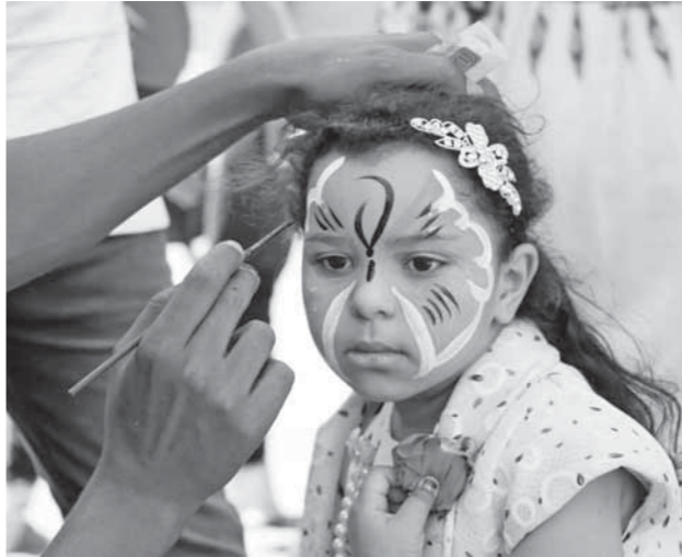
وقام الأطفال بلعب الكرة داخل مياه نافورة الحديقة المتواجدة عند المدخل الرئيسي، فضلاً عن الاستمتاع ببعدها بحديقة الحديقة، كما قامت فرق الأمن بالتواجد على أبواب الدخول والخروج وتوفير الأمن السنائي لفحص حثائب السيدات، فضلاً عن تواجد عناصر الشرطة لتأمين الاحتفالات.