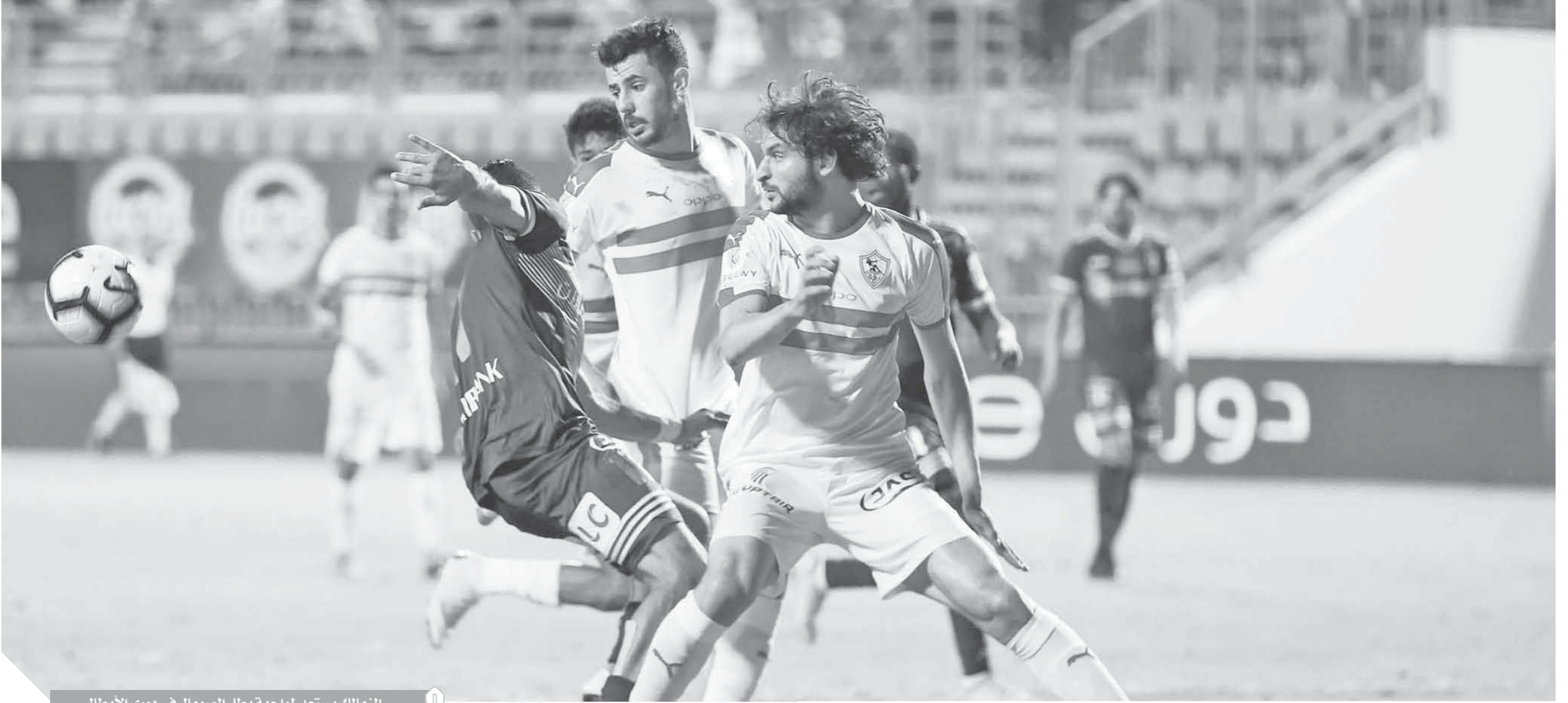
الزمالك يستعد لمواجهة بطل الصومال في دوري الأبطال