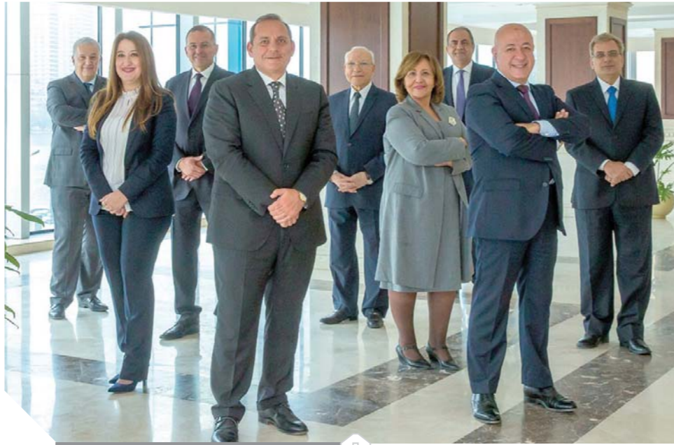
مجلس إدارة البنك الأهلي