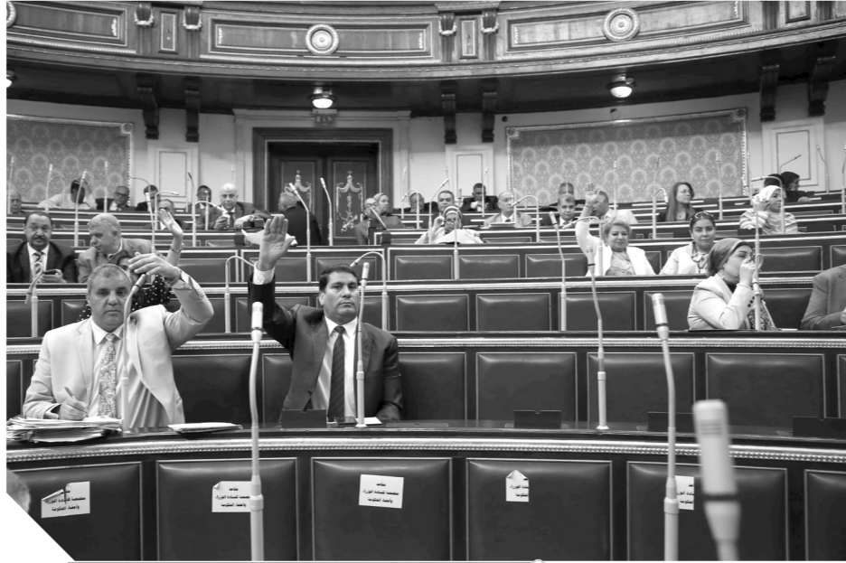
جانب من جلسة البرلمان