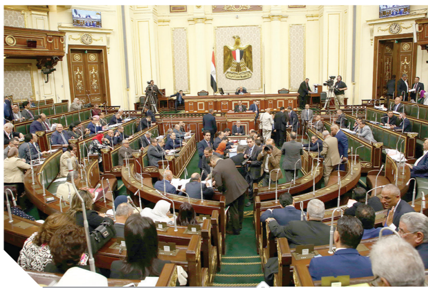
جانب من جلسة البرلمان

أكد الدكتور على عبدالعال رئيس مجلس النواب أن قانون الإيجار القديم غير مطروح الآن على البرلمان. لافتاً إلى أن الحديث عن قوانين جديدة لمجلس النواب ومجلس الشيوخ والنظام الانتخابي لا أساس له من الصحة. جاء ذلك في الجلسة العامة للبرلمان، أمس الأحد، مؤكداً أن مثل هذه التصريحات من بعض النواب تثير اللغط واللبلة بأوساط الرأي العام، وهذا أمر غير مقبول، مطالباً النواب بأن يكون لديهم حرص شديد إبان الحديث لوسائل الإعلام وإطلاق التصريحات، وتنادي إطلاق أى تصريحات تثير اللبلة بأوساط الرأي العام. وفتت إلى أن قانون الإيجار القديم غير مطروح أمام البرلمان حتى الآن، وبمجرد أن يتم الوصول إلى صيغة توافقية بين الملك والمستأجرين سيكون الوقت مناسباً للمناقشة. ويشأن قوانين مجلس النواب، ومجلس الشيوخ قال عبدالعال: «خرجت تصريحات بهذا الشأن في الوقت الذي توجد فيه قواعد حاكمة وأنه لا يجوز للحكومة أن تتقدم بتصريحات خاصة بالجلسات النيابية في ظل وجود برلمان قائم».