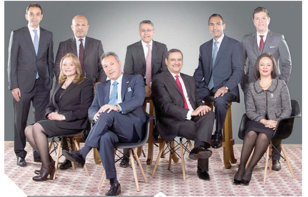
مجلس إدارة بنك مصر

وتوصي الدراسة بتكوين وحدة للبنك المركزي مهمتها علاج المشكلات المالية والمصرفية التي يمكن أن تنشأ عن التطورات العالمية والإقليمية المتلاحقة والتي تؤثر على الاقتصاد المصري وبالتحديد على البنوك المصرية ونسبة بنوكها مصر والأهلي والبنوك التي بها نسبة مساهمة حكومية برأس مالها لمحاولة تدعيم مراكزها المالية بشكل فعال وسريع لتلبية هذه البنوك للانطلاق بالاقتصاد المصري. والعمل على زيادة عدد فروع البنوك الأهلية والتي تعمل بالنظام الإسلامي في تلغ فرعين فقط مقابل ٢٧ فرعاً لبنك مصر. وزيادة عدد فروع البنوك بالخارج وكافة الدول العربية وغير العربية التي تسمح بفتح فروع للبنوك بها تمهيداً للانطلاق للإقليمية والعالمية ولا تستبعد على الإطلاق إمكانية دمج بعض بنوك القطاع العام بنوك مصر والأهلي كسبل لدعمها للانطلاق أولاً نحو الإقليمية ثم العالمية وضماً في الاعتبار عدم وجود فروع للبنوك بالملكة العربية السعودية والتي يتواجد بها أغلب المصريين العاملين بالخارج وكذا الحال بالنسبة للكويت.