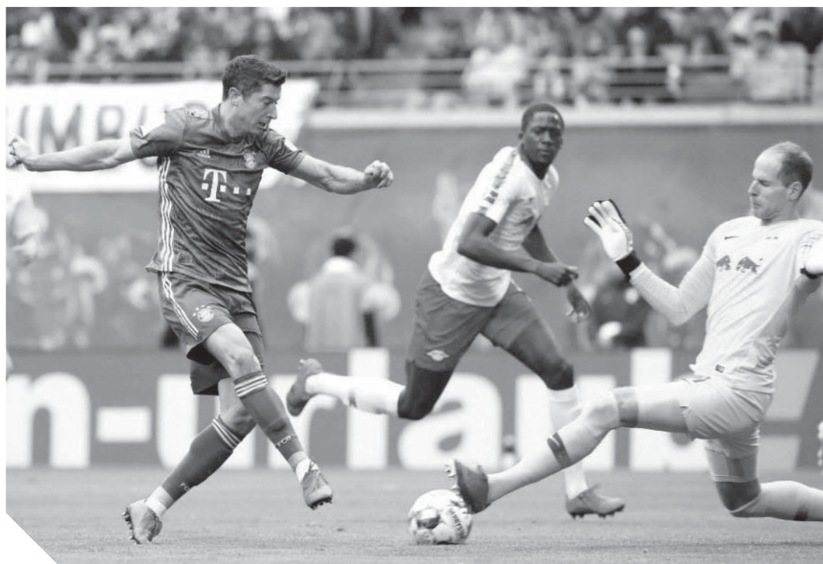
بايرن ميونخ سقط في فخ التعادل أمام لايبزيغ

تعثر «البايرن» يمنح الأمل لدورتموند.. و«كوفاتش» واثق من الحسم في «أليانز»