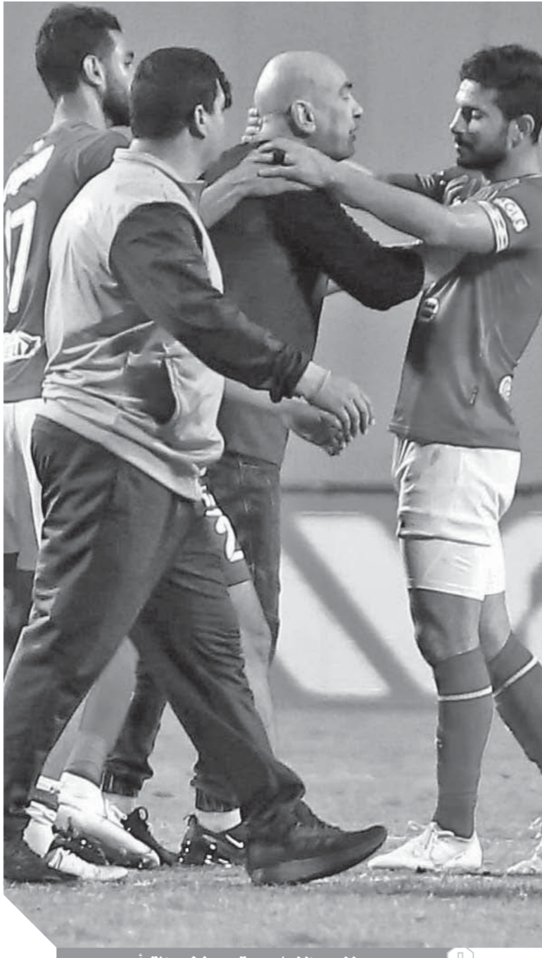
لاعبو الاهلي يحتوتون غضب التواء