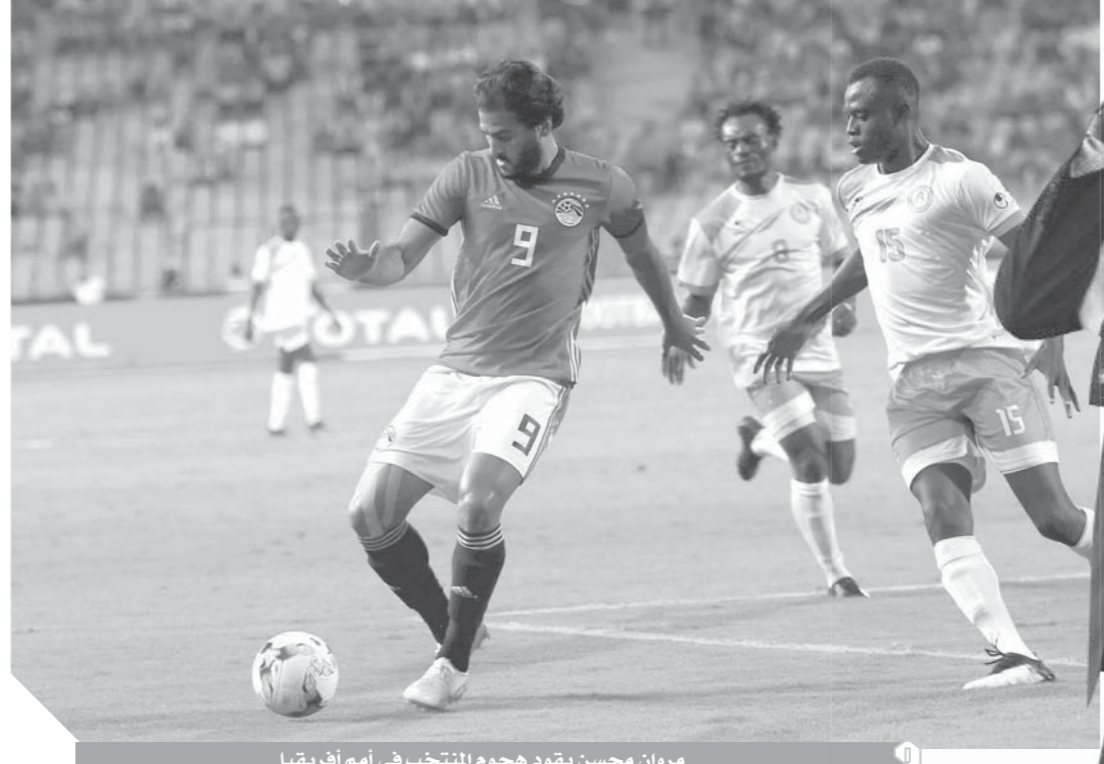
مروان محسن يتودد هجوم المنتخب في أمم أفريقيا