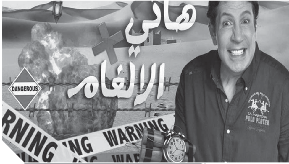
إفش برنامج هاني فى الألفام

– بكل تأكيد أحب مشاهدة أعمال صدقائى ولكن بصراحة لا أشاهد كل الأعمال.. واتصور ان الدراما فى السنوات الاخيرة شهدت تطوراً كبيراً على مستوى الصورة والتكنيك ولكن الموضوعات مازالت متشابهة ولا توجد افكار براقية تستوقف وعى الجمهور وتعالج قضايا اجتماعية كما كان فى الماضى.