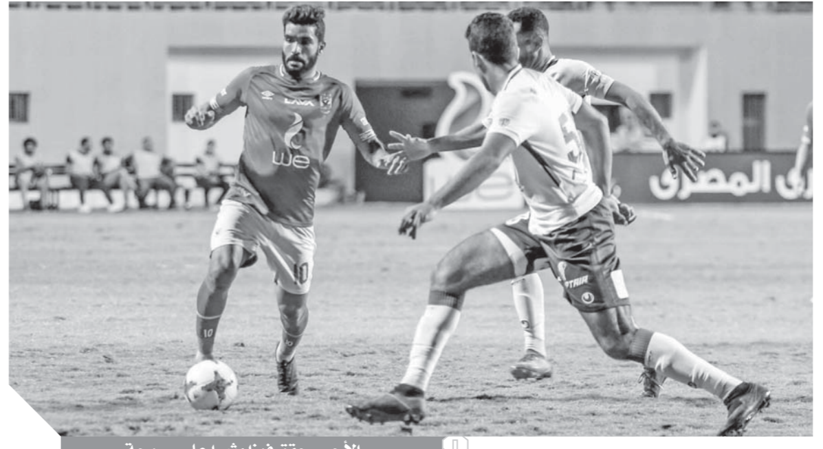
الأحمر حقق فوزًا مثيرونًا علي سموحة

الأهلي يبحث مقاطعة سموحة بعد تصريحات «عامر».. و«لاسارتي»: نتظرنا 4 مباريات صعبة للتتويج