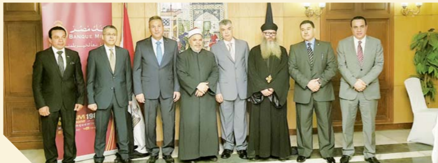
توقيع بروتوكول تعاون بين بنك مصر ووزارة الداخلية بحضور قيادات دينية

المسؤولية المجتمعية ومن أكثر المؤسسات إدراكاً للمسؤوليات البيئية والاجتماعية وقواعد الحكومة التي تقع على عاتق المؤسسة، وتتكامل مع معايير أدائها واستدامة أعمالها على المدى الطويل، وهو أول بنك مصري ملوك الدولة يحصل على موافقة منظمة المعايير الدولية لتقارير الاستدامة (GRI). ويقوم بتقرير الأعمال بالتوافق مع مبادئ الاستدامة من خلال مراعاة الحكومة وحقوق الإنسان، ومكافحة الفساد، والمشاركة المجتمعية، مع مراعاة معايير السلامة البيئية، هذا كما يتوافق البنك مع معايير الأمم المتحدة Global Compact للمواطنة (المسؤولية المجتمعية للمؤسسات).