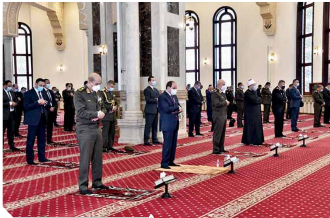
«السيسي» خلال أداء شعائر صلاة الجمعة أمس