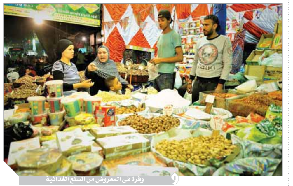
وفرة في المعروض من السلع الغذائية