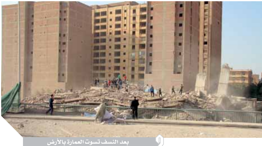
بعد النسف تسوت العمارة بالأرض