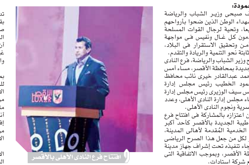
افتتاح فرع النادي الأهلى بالأقصر

وقال الوزير: «إن مدينة طيبة الجديدة بمحافظة الأقصر تدل بما لا يدع مجالاً للشك على حرص الدولة المصرية بقيادة الرئيس عبدالفتاح السيسى على الاهتمام بتنمية صعيد مصر فى شتى المجالات، فضلاً عن تنفيذ كبرى المشروعات القومية بمحافظة الصعيد فى صورة تؤكد أن أهلى الصعيد فى القلب، وأن كل ما يُثار من أقاليم حول غياب اهتمام الدولة بالصعيد لا يخرج عن كونها ادعاءات وأهية لا تمت للواقع بأية صلة». وأضاف: «تجتمع اليوم فى حفل افتتاح فرع النادي الأهلى بمدينة طيبة الجديدة والذي يعد بمثابة فرصة عظيمة للمواهب الشابة بمحافظة الصعيد بصفة عامة ومحافظة الأقصر بصفة خاصة من خلال ما يتضمنه الفرع الجديد من إنشاءات رياضية متنوعة من ملاعب لكرة وملاعب متعددة الأغراض وحمامات سباحة وصالة مغطاة وصالات إنشطار وقاعات اجتماعية»، مشيراً إلى أنه سيكون هناك إقبال كثيف على عضوية فرع النادي الجديد انطلاقاً من شعبية النادي الأهلى، وهو ما سيؤتى ثماره فى تعزيز الاستثمار فى الرياضة المصرية. وأوضح الدكتور أشرف صباحي أن افتتاح فرع النادي الأهلى بالأقصر يأتى بالتزامن مع مجموعة من المناسبات التى تشهدها مصر خلال الأونة الراهنه والتي كان من بينها