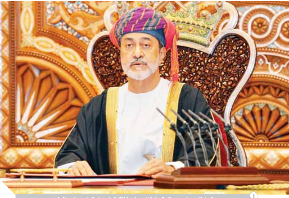
السلطان هيثم بن طارق سلطان عمان خلال ترؤسه اجتماع مجلس الوزراء

وعلى صعيد علاقات عمان الدولية، استعرض السلطان هيثم بن طارق أعمال السلطة على كل الجهود المبذولة لتحقيق الأمن والاستقرار لجميع دول وشعوب العالم.