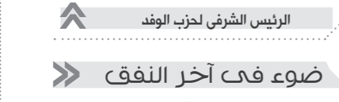
الرئيس الشرقى لحزب الوفد

سعدت كثيراً بما قرص الدعم الغذائي (التأمين) على طفلين فقط، فقد سبق لي أن طالبت منذ سنوات بشروعة رفع الدعم عن أمور كثيرة، أوثها مجانية التعليم التي لا وجود لها أصلاً - فضلاً عن الأمور الأخرى المحروقات والمواصلات - فكما تعلم أن جميع الأسر المصرية العنى منها والفقير، تتحمل مصاريف باهظة في تعليم أبنائها، ولكن بدلا أن تحصل عليها الحكومة، تخرج في صورة الدروس الخصوصية. لقد استجابت الحكومة - مشكورة - لرفع الدعم عن المحروقات تدريجياً، كالبنزين ومشتقاته، والغاز والبنوتاجاز، فقد وصل بنا الأمر أن نمن زجاجة المياه يزيد على سعر لتر البنزين، فهل هذا معقول؟! بالفعل رفعت الحكومة الدعم عن المحروقات، وتقبل شعبنا هذا الأمر، رغم ما ترتب عليه من زيادة في أسعار السلع والخدمات، لكنه وإيماناً منه بأن الدولة ستخصص قيمة هذا الدعم في سد التفرات التي حدثت في حياتنا نتيجة الحروب التي أقمنا أنفسنا فيها من قبل، فأغرتنا في يومنا هذا.