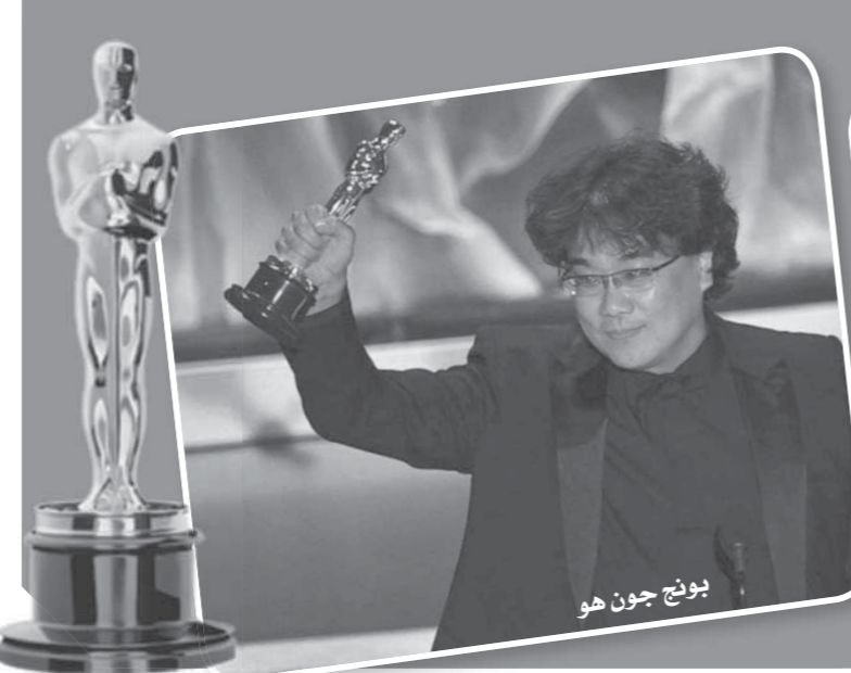
بونج جون هو