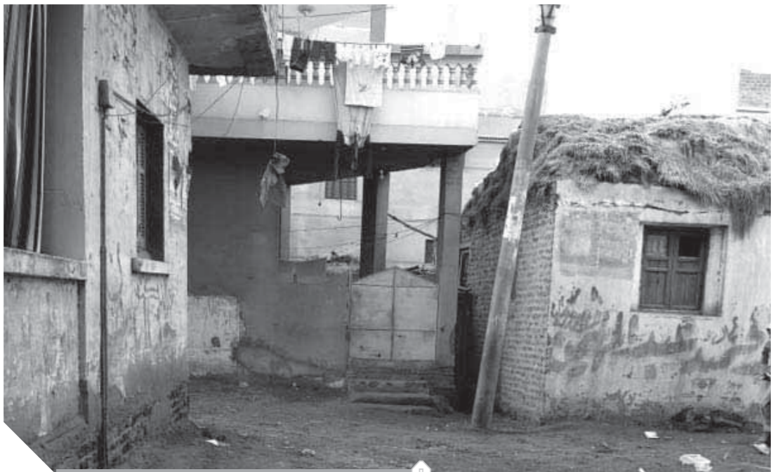
فرقص تفرق في مياه الأمطار