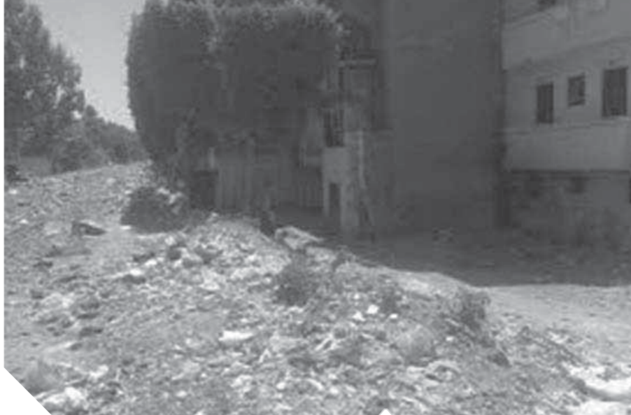
القمامة تغزو شوارع البصرة.