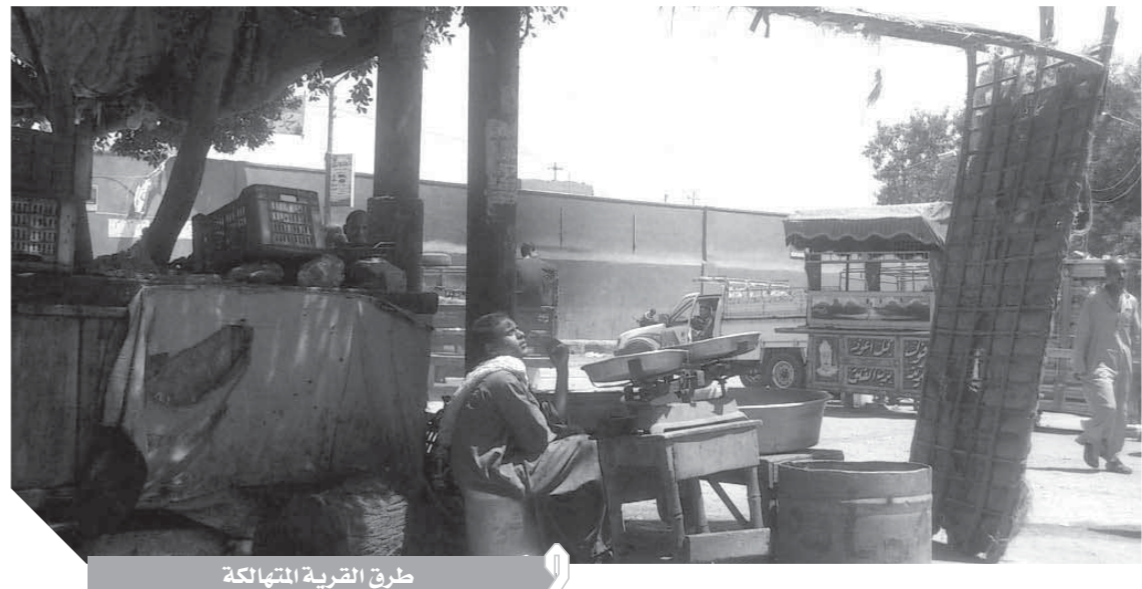
طرق القرية المتهاكة