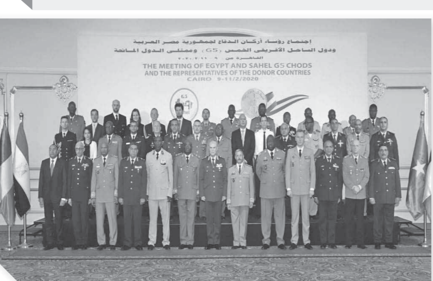
الفريق محمد فريد مع رؤساء أركان دول تجمع الساحل الخمس، G5.

التطاعات الخدمية، فضلاً عن جهود تطوير وتحديث البنوك، خاصة من خلال تنمية الكوادر البشرية وتوطين التكنولوجيا المالية لتنفيذ مبادرة الشمول المالى، وذلك بهدف مواكبة التطورات التى طرأت على العمل المصرفى، وتدعيم دور البنك المركزى ودعم الحفاظ على سلامة الجهاز المصرفى ودعم الاستقرار المالى.