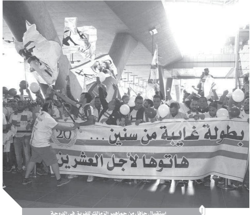
استقبال حافل من جماهير الزمالك للفريق فى الدوحة