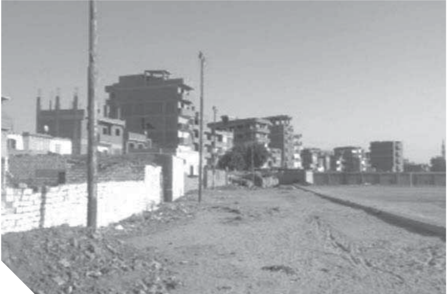
ملعب ميت راضي يحاصره الإهمال

قد تم تخصيص أرض أملاك الدولة لعمل ملعب كبير للمركز وبعد ثورة يناير قام بعض الأهالي بالتعدي بالمباني على أرض الملعب رغم أنها مخصصة لمركز الشباب بناء على قرار الترخيص رقم ٥١ لسنة ٢٠٠٢ الصادر من الشباب والرياضة إلا أن بعض الأهالي قاموا بالتعدي على الأرض بعد ثورة ٢٥ رغم تسجيل الأرض بالأف الجنيهات وتركها لعدم وجود ميزانية تكفي للمشروع.