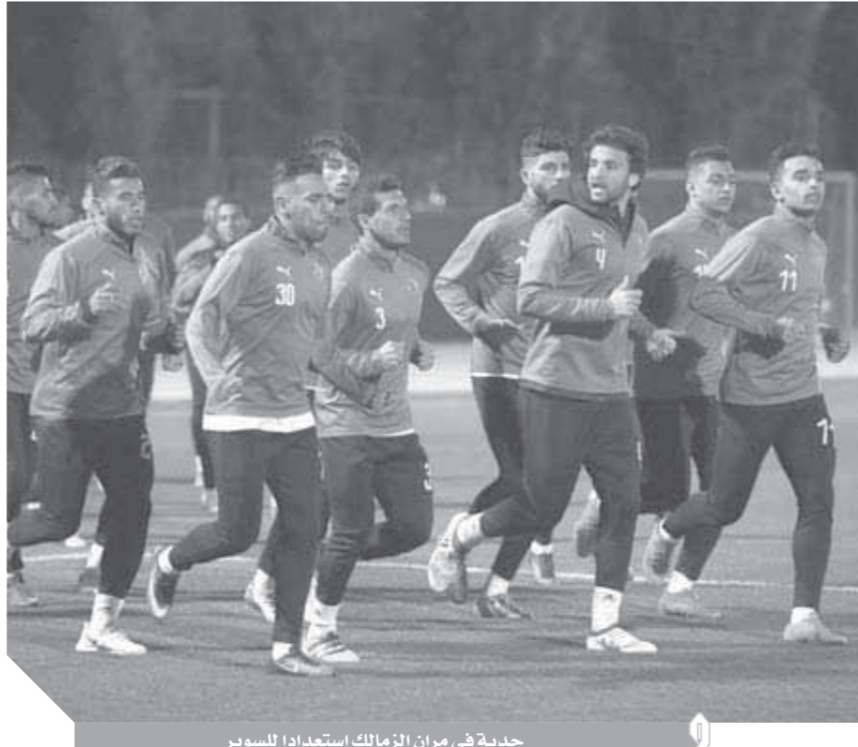
جدية فى مران الزمالك استعدادا للسوبر