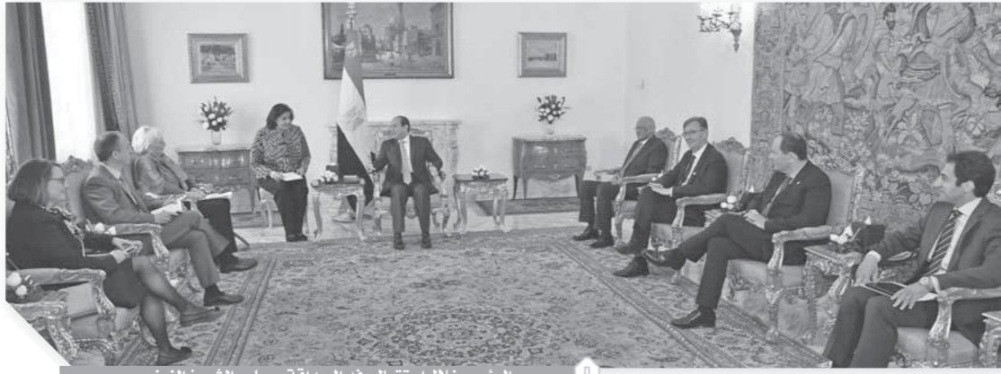
الرئيس خلال استقبال وفد الصداقة بمجلس الشيوخ الفرنسى