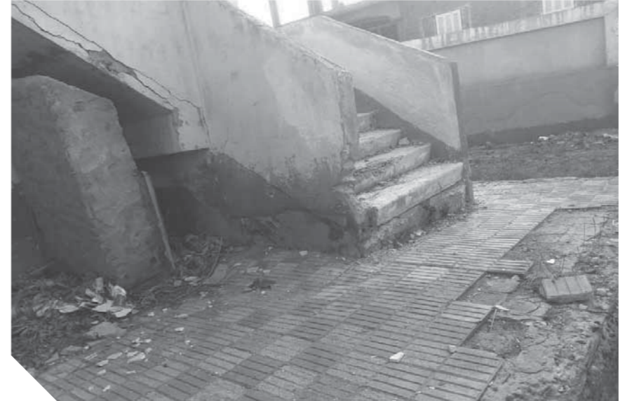
اليوسفية تعاني نقص الخدمات