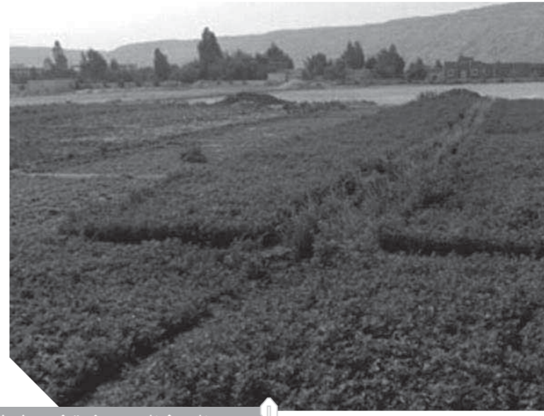
الصرف الصحي يفرق غرب طهطا.. والطرق متهاكة وتنتظر التطوير

أهالي القرية أو عن طريق انتزاعها لإقامة محطات الرفع عليها.