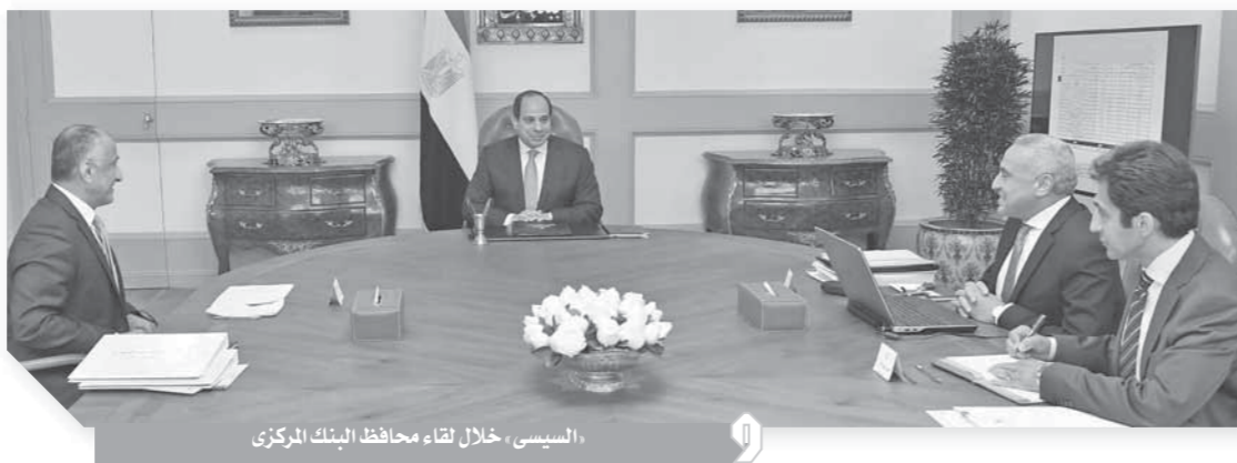
السيسى، خلال لقاء محافظ البنك المركزى