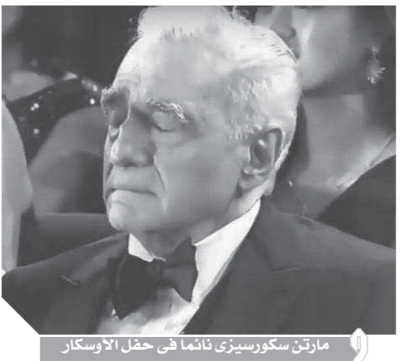
مارتن سكورسيزي دائماً في حفل الأوسكار

الذي صرح من قبل أنه مستعد للشهادة. وتابع بيت في رسالته: أخبرتوني أنني لذي ٤٥ ثانية فقط للحديث، وهي مدة أكبر من التي أخذها جون بولتون هذا الأسبوع للحديث. في إشارة منه إلى قرار مجلس الشيوخ الأمريكي الذي قام بتبرئة ترامب من تهمة «إساءة استخدام السلطة» وعرقلة عمل الكونغرس.