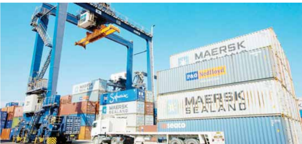
مشروعات تنموية عمانية مستدامة