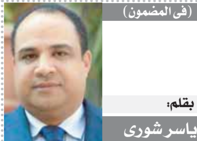
«مانديلا» في لاهاي

٧ مستشفيات مركزية بمحافظة قنا خارج الخدمة وبعضها تعمل عيادات خارجية فقط