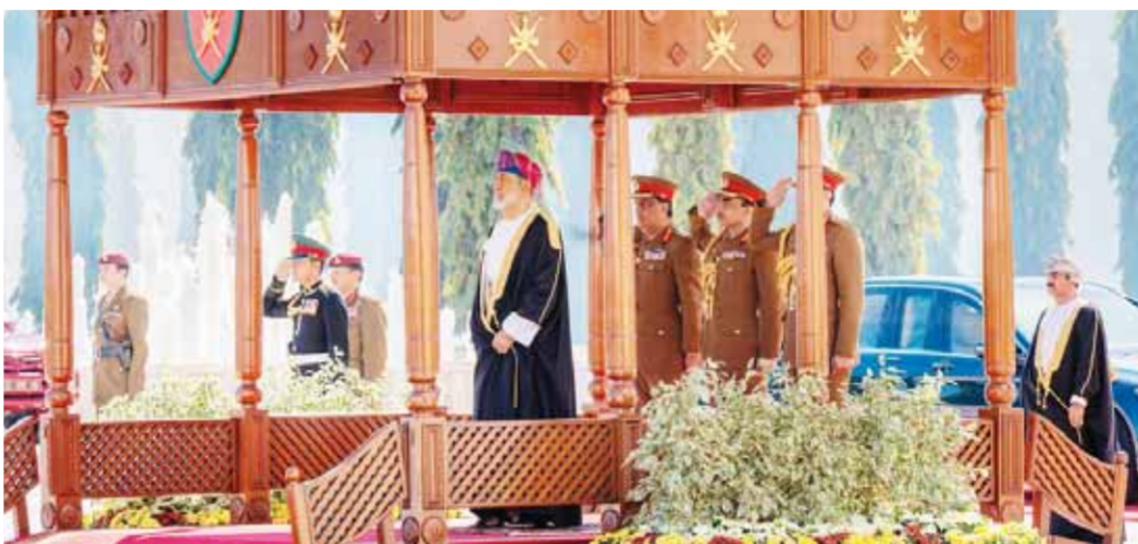
السلطان هيثم بن طارق سلطان عمان