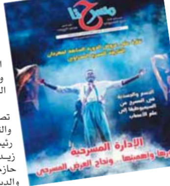
العدد الجديد من جريدة «مسرحنا»

جدير بالذكر أن جريدة «مسرحنا» الإلكترونية تصدر بشكل أسبوعي، وتترأس تحريرها الكاتب والنقاد محمد الروبي والكاتب إبراهيم الحسيني رئيس التحرير التنفيذي، والشاعر والكاتب أحمد زيدان رئيساً لقسم الأخبار والتأليفات، والمخرج حازم الصواف رئيساً لقسم التحقيقات والحوارات، والديبتيك المركزي الشاعر محمود الحلواني، تصحيح رمضان عبدالعظيم، تصوير مدحت صبري، والإخراج الفني لوليد يوسف.