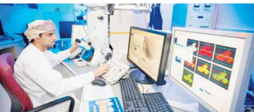
من مشروعات الذكاء الاصطناعي

وعملت حكومة سلطنة عمان باهتمام لتسهيل الحصول على السكن الملائم للمواطنين وذلك من خلال عدد من المبادرات أبرزها إطلاق برنامج «إسكان» عبر توفير مسطحة إقراضية بقيمة ١,٩ مليار ريال عماني على مدى السنوات الخمس القادمة، بهدف الإسراع في توفير التمويل لتقديم الطلبات المرشحة في قائمة الانتظار بالبنك ووزارة الإسكان والتخطيط العمراني ويسعى في مرحلته الأولى إلى تمويل أكثر من ٦٠ ألف أسرة خلال السنوات الخمس القادمة. تنمية متوازنة للمحافظات وحققت سلطنة عمان في ظل النهضة العمانية المتجددة تحولات ملموسة أرست جودورها نحو تنمية متوازنة للمحافظات فحبات منتشرة مع رؤية عمان ٢٠٤٠ بحوزها الاقتصاد والتنمية وتؤسس لمرحلة موعودة من التحولات الهيكلية نحو الإزالة