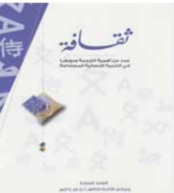
العدد الجديد من مجلة «ثقافة»