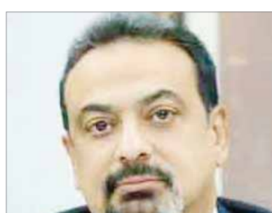
بقلم: محمد راضب

في عيادته الخاصة الكائنة في نجع حمادى تابعة حالتها الصحية بسبب إصابته بتعب في المبراة، وتابع: «الطبيب كشف على زوجة خالي وطلب منها