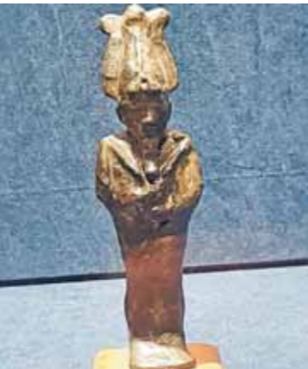
تمثال للمعبود أوزيريس

من البرونز، من بينها تمثالان للمعبود أوزيريس من العصر المتأخر، وتمثالان للمعبودة إيزيس من عصر الدولة الحديثة والعصر المتأخر، يصور تمثالاً للمعبود أوزيريس المعبود بشكل آدمي وعلى رأسه التاج الأزوري، ممسكاً بيديه الصولجان والمذبة، أما تمثالاً للمعبودة إيزيس فيصور أحدهما المعبودة في هيئة امرأة متوجة بقصر الشمس بين قرني بقرة، وهى ربة القمر، لذلك ارتبط بالزراعة الزراعية، حيث تبدأ أول الأعياد مع مجئ الفيضان الذي نتج عن دموعها على زوجها أوزيريس حسب المعتقد المصري القديم، ويصور التمثال الآخر المعبودة وهى ترضع الطفل حورس من العصر المتأخر، وأضاف أنه على هامش المعرض، ينظم المتحف سلسلة من المحاضرات العلمية عن التقويم الميلادي والزراعة في مصر القديمة، وأهم الآلهة التي ارتبطت بأعياد رأس السنة الميلادية.