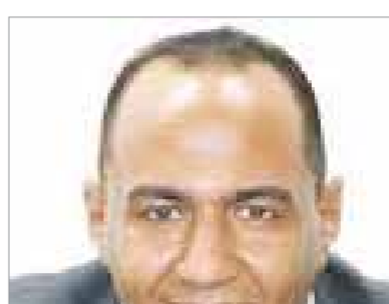
بقلم: محمد راضب

وبناء على تعرض «الوفد» آراء كافة الأطراف في القضية الأطباء والقانونيين ووزارة العدل والقلب