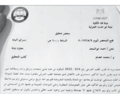
بقلم: محمد راضب

في عيادته الخاصة الكائنة في نجع حمادى تابعة حالتها الصحية بسبب إصابته بتعب في المبراة، وتابع: «الطبيب كشف على زوجة خالي وطلب منها