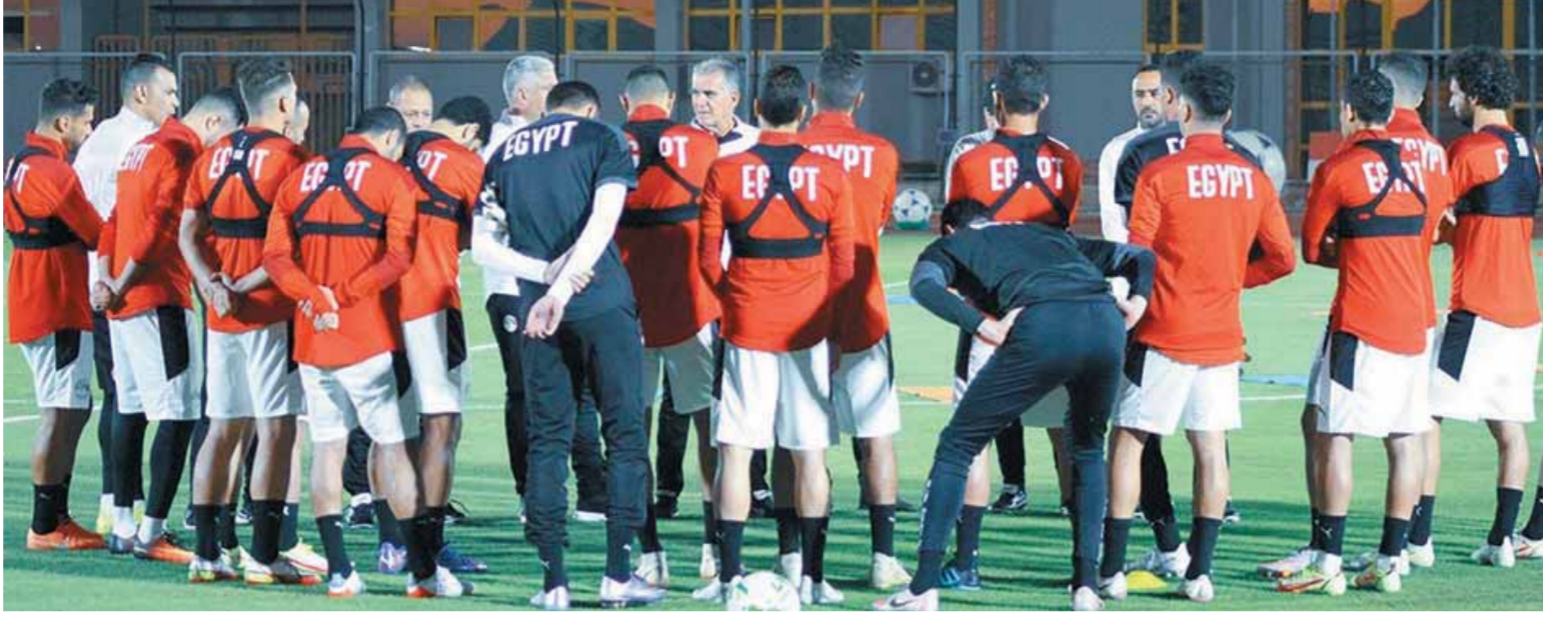
كيروش يعطي التعليمات الأخيرة للاعبيه قبل مواجهة أنجولا

magda_salew@yahoo.com رئيس لجنة المرأة والتربية وسكرتير عام اتحاد المرأة الوفدية