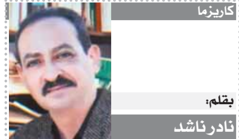
بِقلم: نادر ناشد

قدمت اللجنة التى تدير الاتحاد المصرى لكرة القدم برئاسة احمد مجاهد طلباً للجنة المنظمة لبطولة كأس العرب لإجراء تعديل على القائمة المبدئية للمنتخب الوطنى فى البطولة التى سيتم اختيار القائمة النهائية منها يوم ١٩ من الشهر الجارى. وجاء فى طلب الاتحاد المصرى أنه تقادياً لتضارب المواعيد بين البطولة والكونفدرالية الأفريقية التى يخوض خلالها ناديا بيراميدز والمصرى مباراتين لكل منهما، ويتحاجن للاعبينها المنضمين إلى قائمة البطولة بالبطولة التى ستقام بالدوحة فى الفترة من ١ ديسمبر المقبل حتى ١٨ منه. من جهة أخرى شهد اليوم الثالث لمعسكر المنتخب الأولى