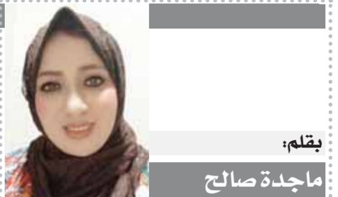
بِقلم: ماجدة صالح