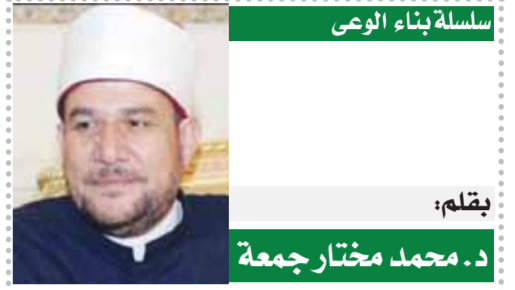
سلسلة بناء الوعي

وأكد د. خالد عبد الغفار وزير التعليم العالى أن مصر توجه نداء من هذا المنبر إلى جميع الدول أن تتبع هذا النهج وتعيد القطع الأثرية التي غادرت أفريقيا إبان حقبة الاستعمار إلى مواطنها الأصلية بوتيرة سريعة ودون قيد أو شرط، لتعزز سويماً من أسس علاقات الأخوة والتفاهم واحترام كل للأخر وحضارته وثقافته، وذلك بوتيرة سريعة تتناسب مع أهمية وحجم المشكلة حيث تستضيف أوروبا وحدها قرابة ٥٠٠٠