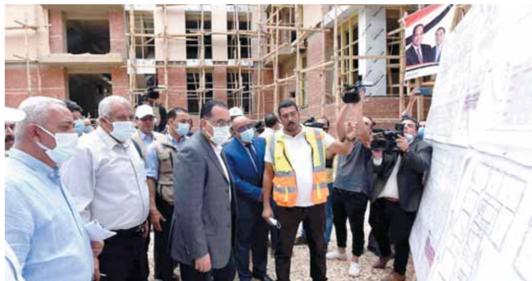
رئيس الوزراء يتفقد أعمال تنفيذ مجمع ٣٠ يونيو الميكن للمصالح الحكومية بالخاركة

وعقب ذلك، توجه رئيس الوزراء إلى حديقة الخاركة، حيث قام بغرس فسيلة نخيل بالحديقة، المقامة على مساحة ٩ أفدنة، حيث أوضح محافظ الوادي الجديد أن الحديقة تشمل حمام سباحة للأطفال، وملعباً خماسبيا، وبحيرة على شكل خريطة مصر، ومسرحاً فنياً وقاعة أفراح مجهزة، وركنا بنيتا، و«تراك» خاصا للدراجات الهوائية على مسافة نحو ١ كم، بالإضافة لمجسات تعليمية للأطفال عن قواعد المرور والقيادة والإسعافات الأولية، مع تخصيص مكان بالحديقة