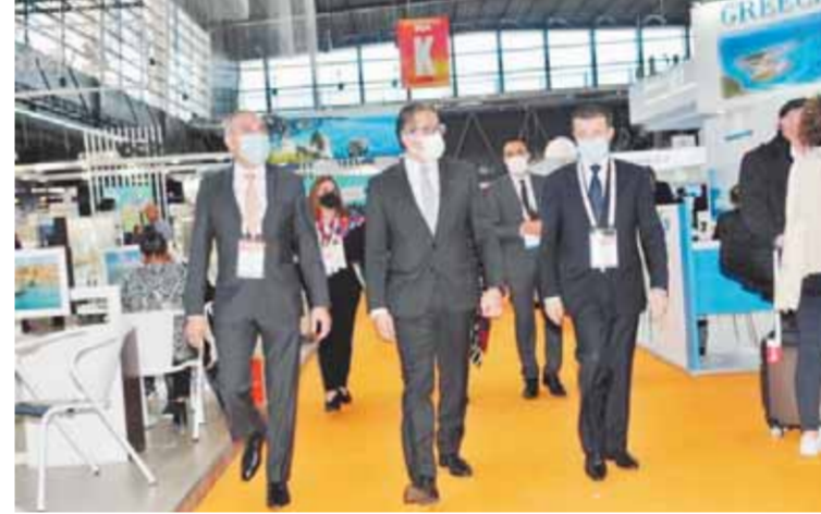
وزير السياحة يتفقد الجناح المصري بفرنسا