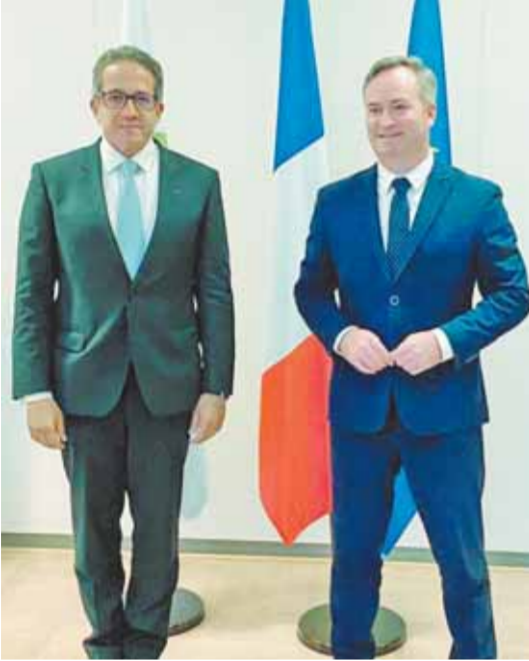
وزير السياحة مع وزير سياحة فرنسا