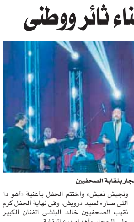
صور من حفل على الحجار بنقابة الصحفيين

وعندما بدأت الشركة المنفذة فى الرصف بإلقاء الترية الأساسية (السن) كانت المفاجأة المؤسسة حين علم الأهالى أن اتساع الطريق لن يزيد على ١٠ أمتار فى اتجاه واحد بدلا من اتجاهين كما كان مخططا له من قبل! وهنا خاب أمل الأهالى وتبدد حلمهم وماتت فرحتهم التي كانت تأمل فى طريق ممد بحارتين لإنهاء معاناتهم التي طالت معه سنوات عديدة! والحال هكذا فقد بدأت تساؤلاتهم تنتشر بطول الطريق وعرضه، أين الميزانية التي وضعت لهذا الطريق؟ ومن المسئول عن إصدار المال العام فى إنشاء الحواجز الساندة على جانبيه وتمهيد للتوسعة إلى جانب ثقل أعمدة الإنارة بتكلفة إجمالية لا تقل عن ٢٠ مليون جنيه دفعها مجلس مدينة اطسا بلا عائد والأهم من يحسم هذا الطريق بعد رصفه من اعتبارات الأهالى أ على جانبيه باستغلال المساحات غير المروضة، مما يسبب العديد من الحوادث ويعوق حرية الحركة عليه؟ فى رأى المتواضع أن مشكلة هذا الطريق تتلخص فى أن المسئولين تعاملوا معه على أنه طريق فرعى أو داخلى يربط بين قرية وأخرى، وليس طريقاً رئيسياً يمتد بين مدينتى اطسا والفيوم، وفوق كل ذلك يعد المدخل الوحيد لمدينة اطسا يسكنها الذين يزيدون على مليون نسمة ويسكنون ٥٠ قرية أما و ٤٢٠ تابعة، وجميعهم يرتادون هذا الطريق، وألمهم الأخير أن يعرفوا من الذى اغتال أحلامهم فى عرض الطريق؟ وديورتا نتمسأل: هل يجدون من يسمعه؟