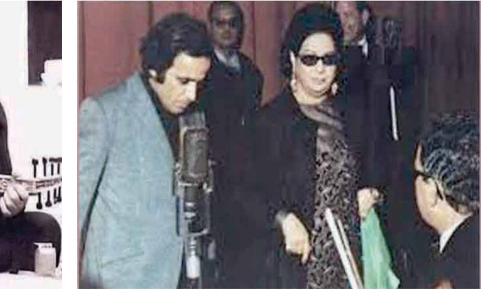
مع كوكب الشرق في إحدى البروفات