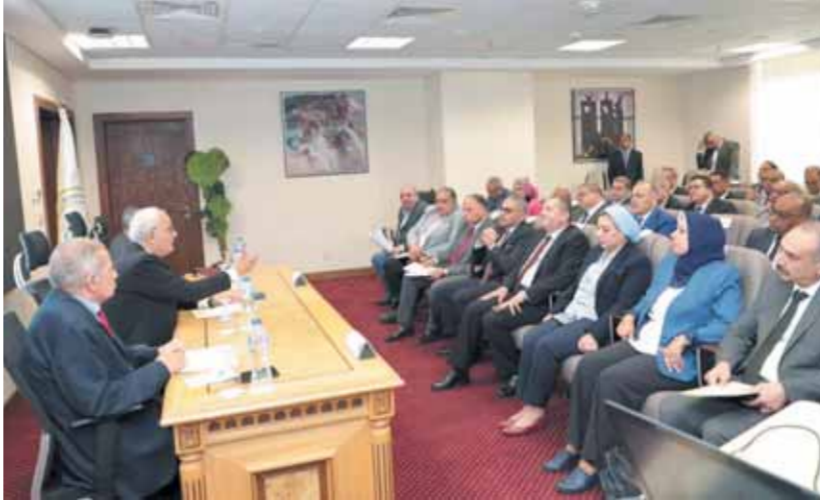
الدكتور رضا حجازى خلال اجتماعه لبحث استعدادات العام الدراسى

وأشار الوزير إلى التأكيد على الالتزام بتحصيل الرسوم الدراسية المقررة (سداد كلى، أو جزئى)، وفقاً للقرار الوزارى رقم (١٦٢) الصادر فى ٢٠٢٣/٩/٣، بشأن تحديد الرسوم والغرامات والاشتراكات،