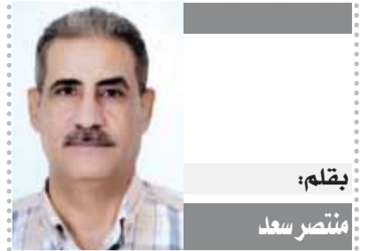
بقلم: منتصر سعد