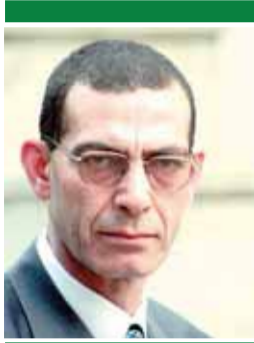
د. وجدى زين الدين

إضافة إلى تأكيده على ضرورة الحفاظ على كل الحقوق الكاملة لمصر فيما يتعلق بحصتها المائية. ويؤمن الدكتور عبدالسند يمامة إيماناً قاطعاً بأنه إذا كان من حق إثيوبيا أن تقوم بنهضة داخل بلادها، فإن نهر النيل بمثابة حياة أو موت للمصريين، ولا يمكن بأي حال من الأحوال التفریط في أي حق من حقوق المصريين في هذا الشأن، لأن مياه النيل لمصر بمثابة شريان الحياة، ولن يسمح أحد أبداً بقطع هذا الشريان أو استنزافه.