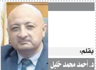
بقلم: أحمد محمد خليل