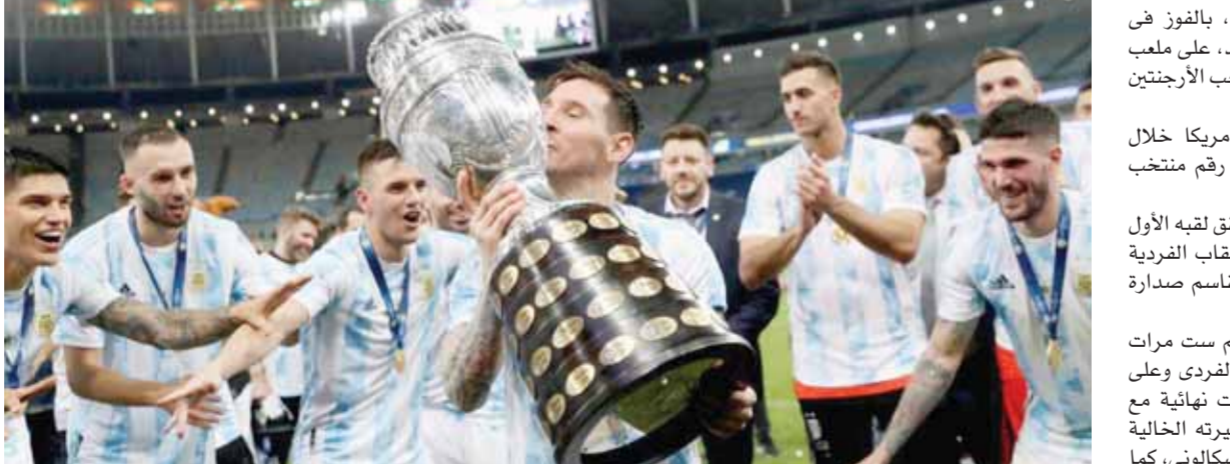
ميسي يحتفل بكأس كوبا أمريكا

ويسعى الأهلي لضم رحيمي الذي تألق بشكل لافت في الكونفدرالية وبطولة كأس الأمم الإفريقية للكوغين المحليين، وكان أفضل لاعب بها. وعرض الأهلي في وقت سابق ٢ ملايين دولار لحسم التعاقد مع اللاعب، لكن إدارة الرجاء طلبت تأجيل الملف إلى ما بعد بطولة كأس الكونفدرالية.