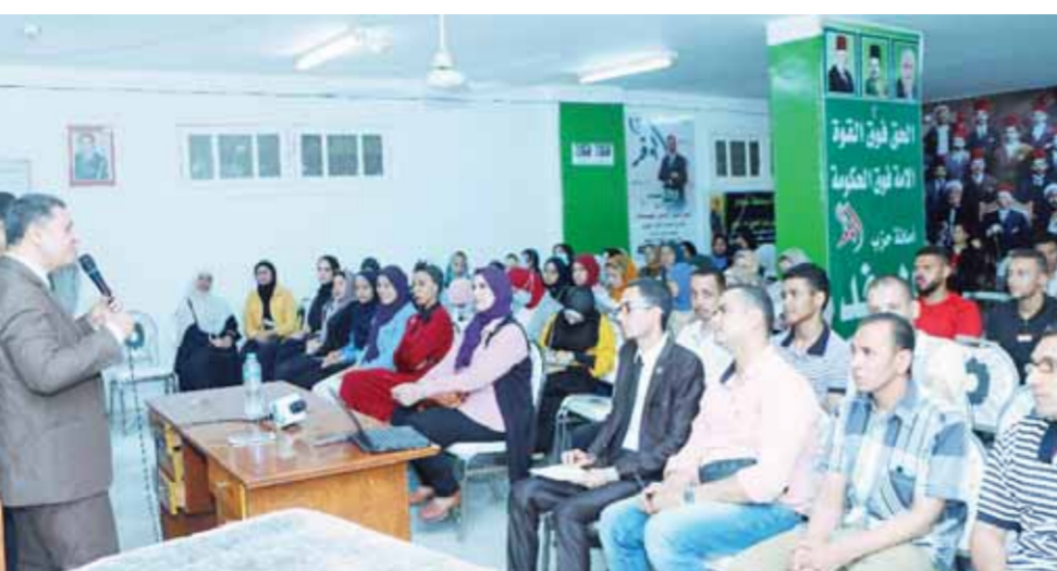
جانب من الدورة التدريبية