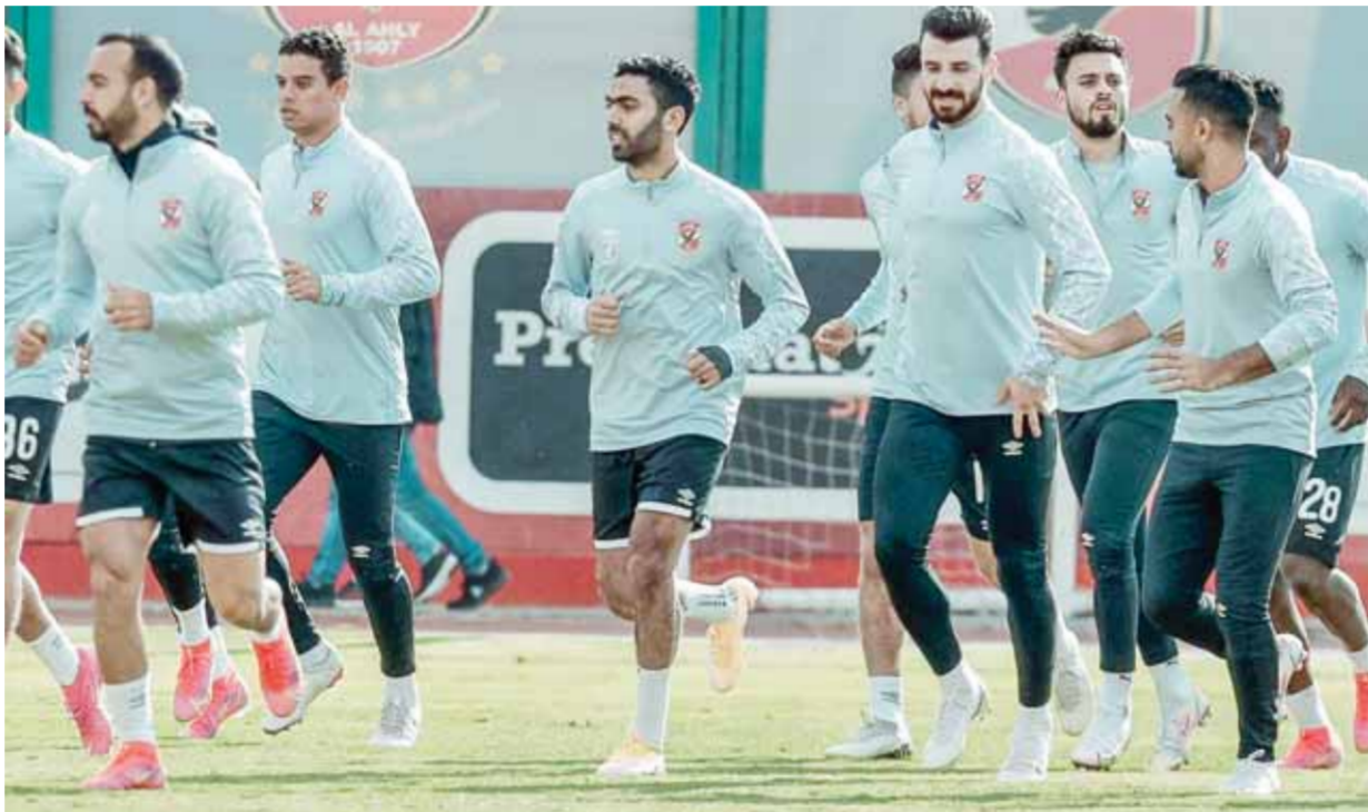
الاهلي يسعى للتتويج باللقب القاري

نأخذة يمكن أن يطلنا منها على إراي أمام المصري. تاريخ الإخوان أوله، بالفصحاح غير الأخلاقية، تزويد خلال عهد الرئيس المعزول محمد مرسي، حيث حدثت ممارسات عديدة من جرائم التعرض التي ارتكبتها قيادات بارزة بالجماعة حتى جاءت الثورة الشعبية في ٢٠١٢ بالدين لخدمة الديمقراطية السياسية، الإخوان في مدار تاريخهم يلعبون على مشاعر الناس باسم الدين ولكن وجههم الحقيقي غير أخلاقي ويمدون على تزيف الحقائق، وهناك اعترافات لقيادة التنظيم من هذه الثورة بنجاحها من غير ذراع الإخوان في الفكرة وتمثيل الفضيلة، واستاد الإخوان توجيه كاتيبه الإلكترونية لشن حملات تجميل وجه الجماعة وتشويه السياسيين الوطنيين والنضال عليهم باستخدام كل الطرق غير الأخلاقية وغير المشروعة، على أدوات الكتب والتزيف، وهم في الوقت الراهن بعد اكتشافهم أمام الجميع يحاولون تحميل صوابهم من خلال حرب دعائية منهجتها تعتمد على تشويه الآخرين وتزيف الحقائق ولكن الشعب المصري يعي تماماً هذه الجماعة الإرهابية.