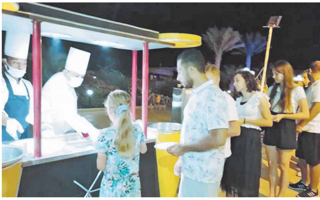
إقبال شديد من السياح على شواطئ مرسى علم

أقامت فنادق السياحة بمرسى علم جنوب البحر الأحمر مهرجاناً للأكلات الشرقية على شاطئ البحر، ضمن احتفالية الفنادق بعمل يوم شرقى يشمل مأكولات شرقية للسائحى الأجانب من مختلف الجنسيات الأجنبية من سويسرا وبيلاوروسيا وأوكرانيا والمجر وصربيا ومولدوفيا ومقدونيا وسويسرا وبولندا والتشيك.