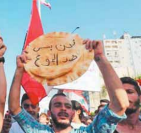
مظاهرات لقمة الفقير، الغاضبة فى لبنان احتجاجاً على تردى الأوضاع الاقتصادية

تواصلت أمس مظاهرات «لقمة الفقير» فى لبنان احتجاجاً على تردى الأوضاع المعيشية الصعبة التى تفاقمت فى الفترة الأخيرة، قطع محتجون لبنانيون، طرقات في العاصمة بيروت ومدينة طرابلس ومناطق أخرى، احتجاجاً على تردى الوضع الاقتصادي، فيما أعلنت السلطات اللبنانية للمرة الثالثة، خلال أقل من أسبوعين، عن رفع سعر رطله الخبز لأكثر من ٤٢٠٠ ليرة، ويعد هذا الارتفاع الثالث فى أسبوعين، حيث تم إتخاذ سعر رطله الخبز ورفع سعرها، وسط توقعات بأن يتواصل هذا الارتفاع أسبوعياً.