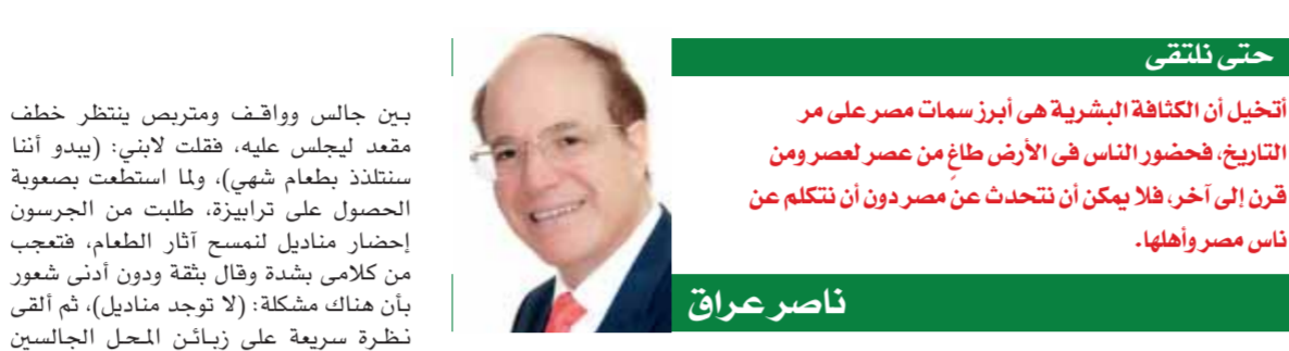
حتى نلتقى ناصر عراق