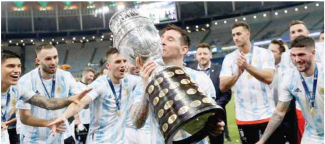
ميسي يحتفل بكأس كوبا أمريكا

التذكري». واكمل: «يجب أن نستفيد من هذه الفرصة، وهذا الجيل الجديد، أخبرتهم أنهم سيكونون مستقبل المنتخب الوطني، ولم أكن مخطئا، لقد أظهروا ذلك.. اليوم نحن الأبطال».