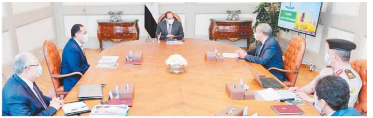
السيسي خلال اجتماعه برئيس الوزراء ووزيري التموين والزراعة ومدير جهاز مشروعات الخدمة الوطنية

كتب - ناصر عبد المجيد، اجتمع الرئيس عبدالفتاح السيسي أمس مع الدكتور مصطفى مدبولي رئيس مجلس الوزراء، والدكتور على المشيخي وزير التموين والتجارة الداخلية، والسيد القصير وزير الزراعة واستصلاح الأراضي، واللواء آ.ح. وليد أبو المجد مدير عام جهاز مشروعات الخدمة الوطنية للقوات المسلحة. وصرح السفير بسام راضي المتحدث الرسمي باسم رئاسة الجمهورية بأن الاجتماع تناول متابعة الموقف بالنسبة للمخزون الاستراتيجي من السلع التموينية الأساسية، وجهود الحكومة لتوفيرها للمواطنين على مستوى الجمهورية. ووجه الرئيس باستمرار جهود توفير السلع