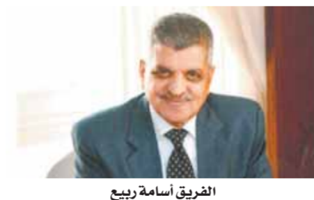
الفريق أسامة ربيع

التي انتهجتها الهيئة ساهمت فى الحفاظ على معدلات عبور السفن بالقناة وكسب ثقة العملاء، حيث ساهمت السياسات المرة خلال التسوية الأولى من العام الجارى فى جذب ٢٥١٩ سفينة، محققة إيرادات قدرها ٦٢٠٠ مليون دولار، كما لعبت الحوافز والتخفيضات الممنوحة دوراً بارزاً فى تحقيق طفرة كبيرة على صعيد زيادة معدلات عبور كل من سفن الغاز الطبيعي المسال وسفن الحاويات وحاملات السيارات وسفن الصب الجفاف خلال الفترة من يناير إلى يونيو ٢٠٢١، وسفن الزيت خلال الفترة من يوليو حتى ديسمبر ٢٠٢١، وزيادت حصة صادرات الغاز الطبيعي المسال بنسبة ٧٤٪، وزيادت سفن الحاويات بنسبة ٩٩٪، فيما ارتفعت أعداد أعمال الجناحة