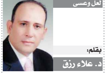
لقلم: د. علاء رزق