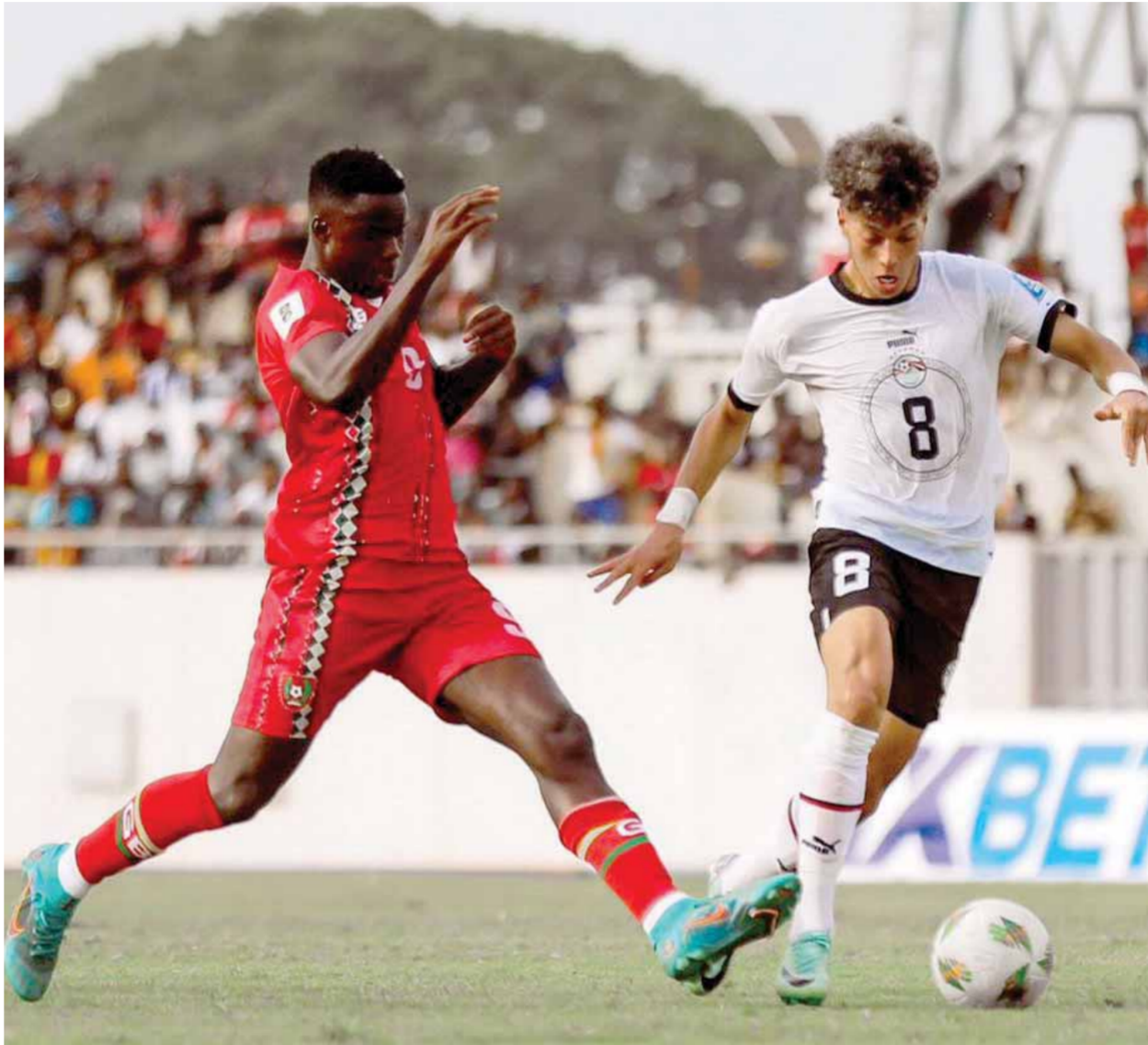
المنتخب تعادل مع غينيا بيساو

مصطفى فتحى للنزول في حالة إصابة محمد صلاح ولكن الأخير أكد سلامة ركبته ورغبته في الاستمرار ما جعل حسام حسن يتراجع عن مشاركة مصطفى فتحى. وبدوره، نفى إبراهيم حسن، مدير منتخب مصر، ما تردد أيضاً، مؤكداً أنه لا يفهم سر