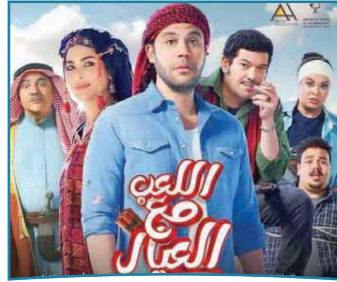
تستقبل قاعات العرض السينمائية المصرية اليوم ٤ أفلام جديدة، تتنافس على إيرادات موسم عيد الأضحى السينمائي، والذي ينتظره الجمهور للتزهر والدخول إلى السينما لمشاهدة عدد متنوع من الأفلام، ويشارك هذا العام نخبة من ألمع النجوم والنجمات، حيث يشارك في الأفلام المعروضة نجوم الصف الأول وهم أحمد