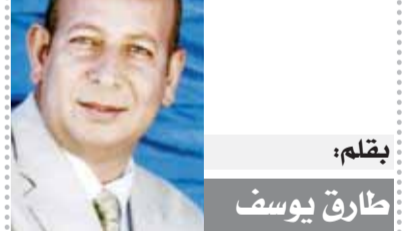
لقلم: طارق يوسف