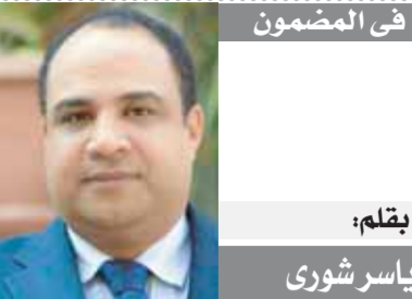
في المضمون بقلم: ياسر شوري

أما الثانوية العامة، فالأسباب معروفة وأولها الرعب المستمر منها لدى الطلاب وإصرار واضعي الامتحانات على التسلف ووضع أسئلة اشبه بالانماز من خارج المنهج ما يدفع بابناء الثانوية العامة إلى اللجوء إلى الدروس الخصوصية، ثم إلى السيد «شامويج».