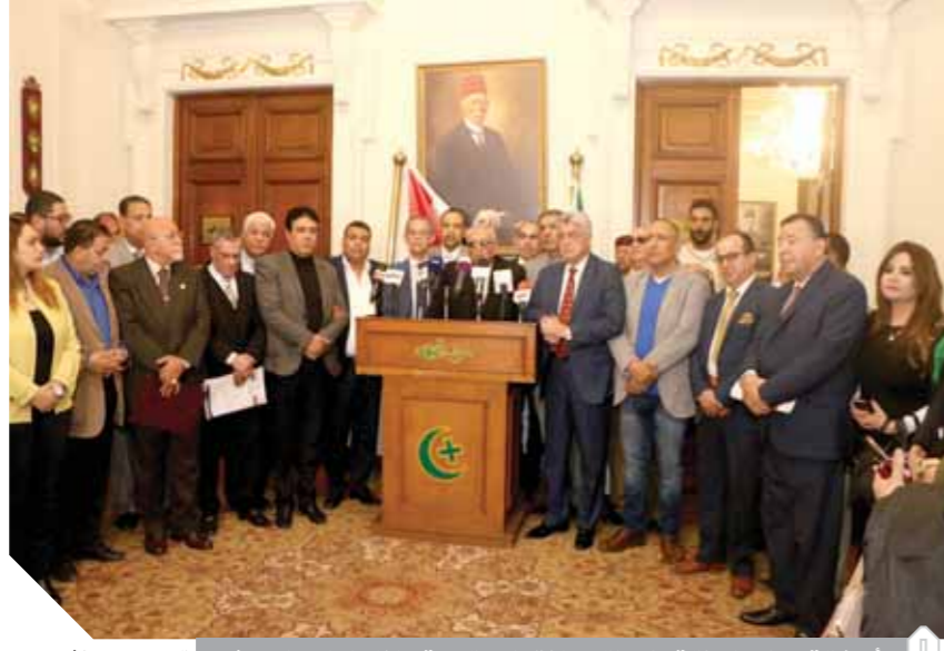
أبو شقة، يعلن الموافقة على التعديلات الدستورية خلال المؤتمر الصحفي

ملزمون بها منذ مائة عام. وجاءت الكشف، التي أشرف عليها السكرتير العام مع السكرتارية المساعدة، وتم فرز جميع الأصوات وكنا أمام نتيجة تمثلت في ٩٣,٥ تقريباً موافقة على التعديلات الدستورية، ولم تنف عند هذا الأمر وإنما دعيت الهيئة العليا وتمثل فيها المكتب التنفيذي وأخذت فيها الآراء فكانت الموافقة بالأغلبية المطلقة، كما نضيف أن الهيئة البرلمانية أيضاً وافقت على التعديلات بنسبة ٩٣,٥ موافقة وأصبحت هذه النسبة بمثابة التزام حزبي للجميع الموافق وغير الموافق وتلك الديمقراطية التي التزامنا بها في هذا الشأن، ولذلك أعلن كراي للحزب أن الحزب بجميع قواعده بمؤسساته وقياداته كراي جماعي وبعد أخذ الرأي والرأي الآخر وفي ديمقراطية كاملة وشفافية كاملة وقناعة كاملة نعلن الموافقة بنسبة ٩٣,٥% على التعديلات الدستورية.