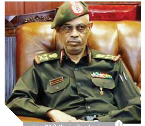
عوض بن عوض وزير الدفاع السوداني