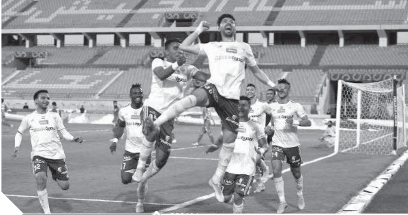
فرحة لاعبي المصري بإحراز الهدف الأول