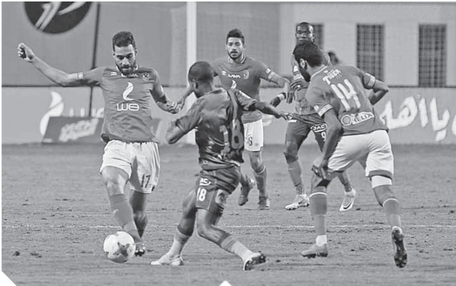
الأهلى تخطف المقاصة بصعوبة

الأهلى يتسلح برسائل جماهيره قبل موقعة رد الاعتبار.. و«الخطيب» يتنفس الصعداء بعد عبور المقاصة