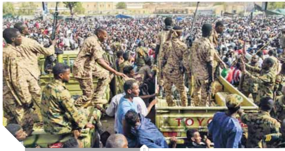
الجماهير السودانية سعيدة بالتغيير