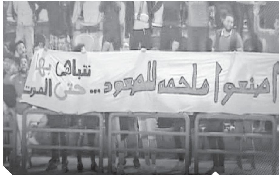
لافتة تطالب «اصنعوا ملحمة للصعود.. نتباهى بها حتى الموت»