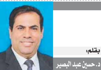
بقلم: حسين عبد البصير