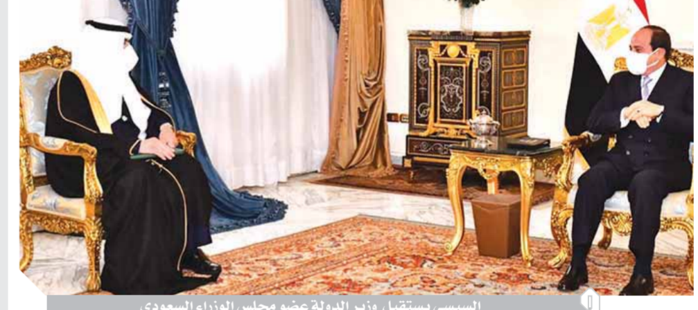
السيسى يستقبل وزير الدولة عضو مجلس الوزراء السعودى

الحرمين الشريفين الملك سلمان بن عبدالعزيز تناولت عدداً من موضوعات التعاون الثنائى، كما تضمنت التأكيد على عمق العلاقات التاريخية التى تجمع بين البلدين والشعبين الشقيقين، وحرص المملكة على تعزيز أطر التعاون الاستراتيجى بين البلدين على مختلف الأصعدة، ومواصلة مسيرة العمل المشترك والتنسيق المكثف مع مصر إزاء مختلف القضايا الإقليمية والدولية، من جانب، طلب الرئيس نقل تحياته إلى شقيقه العاهل السعودى، وسمو ولي العهد. وقد تم التوافق خلال اللقاء على استمرار تطوير التعاون والتشاور البناء بين البلدين الشقيقين فى مختلف المجالات، لتحقيق المصلحة المشتركة للشعبين المصرى والسعودى، فضلاً عن تدعيم أواصر التضامن العربى.