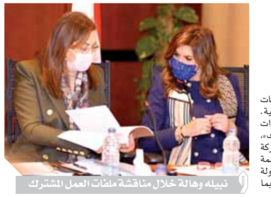
تنبه وهالة خلال مناقشة ملصات العمل المشترك

اتفقت وزارتا الهجرة والتخطيط والتنمية الاقتصادية على إطلاق مبادرة جديدة تحت شعار «أصلك الطيب»، بهدف إشراك المصريين بالخارج ضمن المبادرة الرئاسية «حياة كريمة» لتطوير الريف المصري، من منطلق التنسيق بين كافة المبادرات المجتمعية ووضعها تحت بوتقة واحدة لتنظيم أوجه الاستفادة منها في إطار تنفيذ المبادرة الرئاسية، وسيتم العمل خلال الفترة المقبلة على تحديد ١٠ مشروعات بالقرى المستهدفة يمكن للمصريين بالخارج الراغبين في المشاركة بالمبادرة، توجيه الدعم لها، وكذلك العمل على إدراج عدد من القرى المصدرة للهجرة غير الشرعية، ضمن