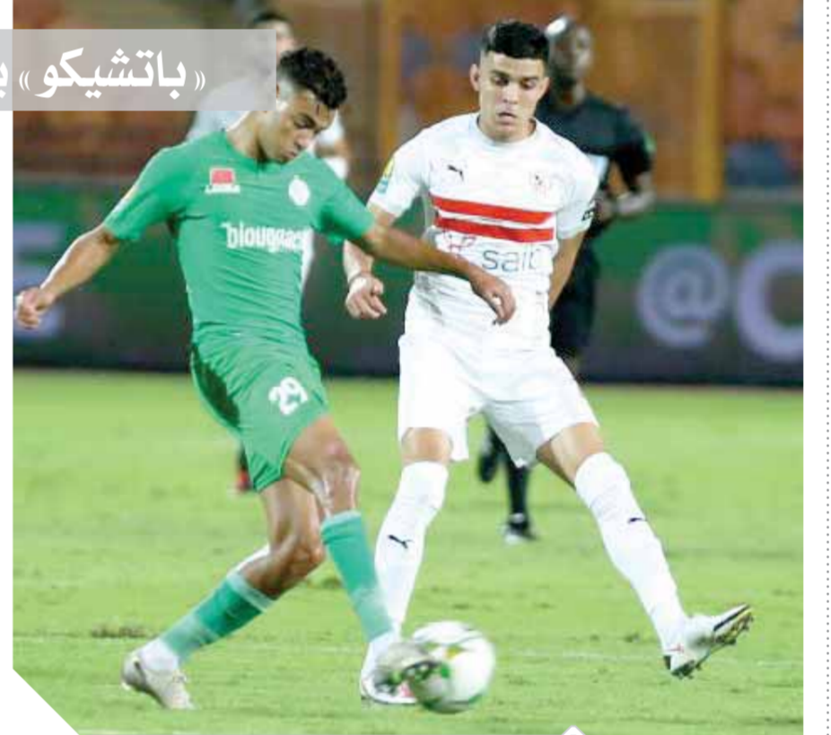
الزمالك يبدأ اليوم مشواره بدور المجموعات الأفريقى