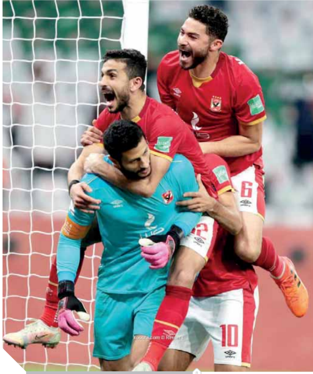
فرحة عارمة للاعبى الأهلى بعد حصد برونزية العالم