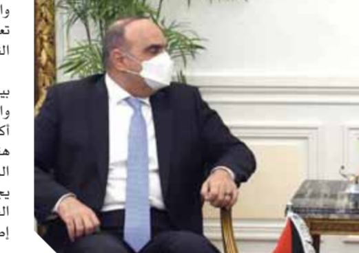
مدبولى ونظيره الأردنى

الأردن فى مجال الكهرباء أصبح نموذجاً يحتذى به، وأن تعزيز قدرات خطوط الربط الثنائى تزيد فرص النجاح، مع التأكيد على ضرورة تعزيز التعاون فى مجال الغاز. وتمت الإشارة إلى أهمية تكثيف الزيارات الثنائية المتبادلة بين الوزراء من الجانبين، فى ظل بحث كافة الجوانب الفنية، والتوصل إلى اتفاق بشأنها، مع تدليل كافة العقبات، حيث أكدت الدكتورة رانيا المشاط، وزيرة التعاون الدولى، أن هناك لجناً فرعية تعمل حالياً على صياغة الاتفاقيات فى المجالات التى تم الإتفاق بشأنها، ودراسة المجالات التى يجرى التباحث بشأنها، ليكون لدينا وثائق جاهزة للتوقيع بين الجانبين خلال الاجتماع القادم للجنة العليا المشتركة، أو فى إطار التعاون الثنائى.