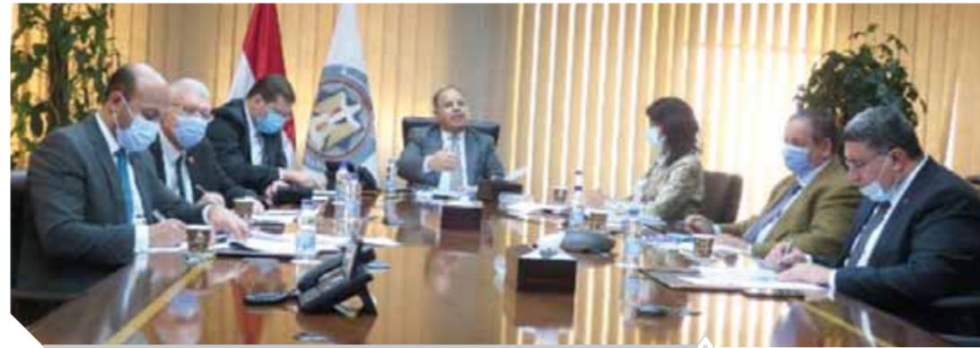
جانب من اجتماع اللجنة الوزارية المختصة بمتابعة أعمال إنشاء المراكز اللوجيستية