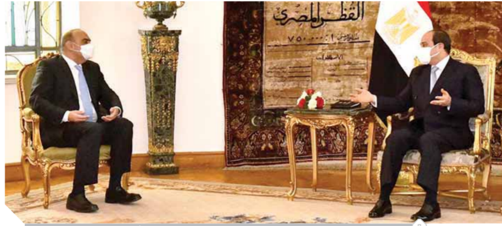
الرئيس السيسى يستقبل رئيس الوزراء الأردنى