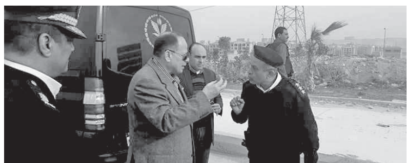
مدير أمن الجزيرة أثناء تقفده النقاط الأمنية