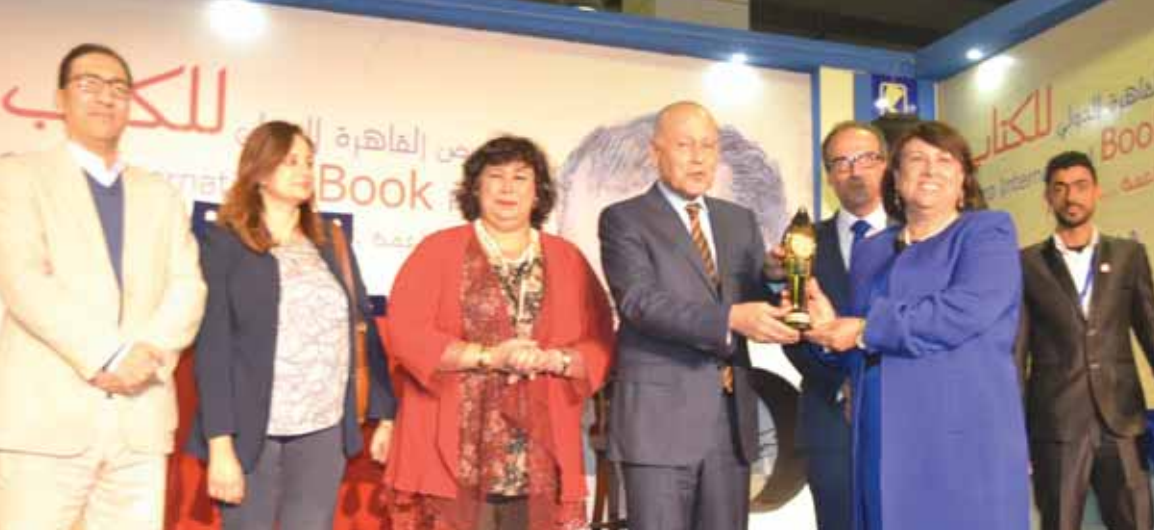
جانب من فعاليات معرض الكتاب