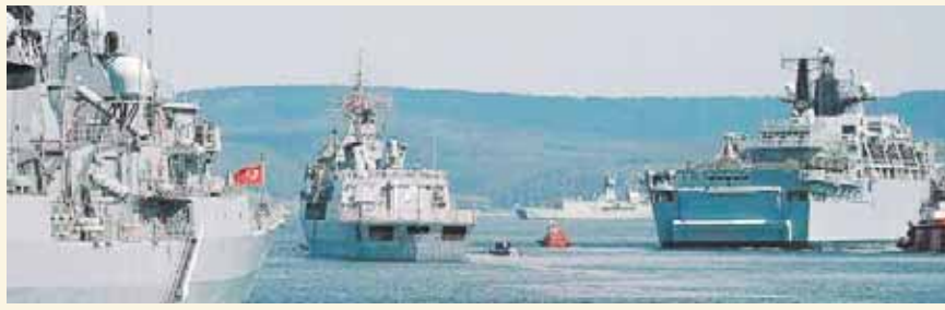
قطع بحرية تركية تعترض سفينة «إيني» في شرق المتوسط