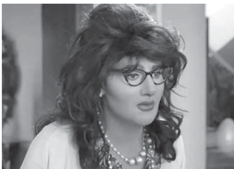
رامز جلال فى مشهد من «رعدة متوحشة»

الفيلم فى مكان محدود أن يصنع عملاً متميزاً ويدخله كوميديا، ولكنها من نوعية الكوميديا السوداء.