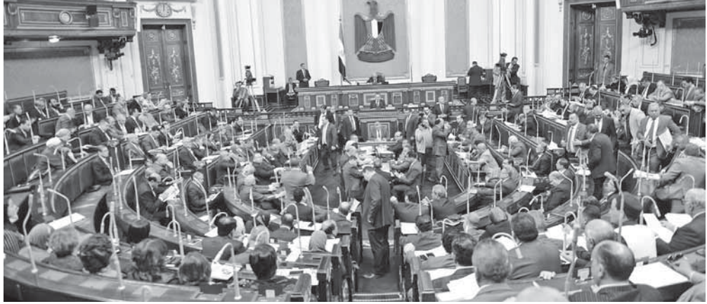
مجلس النواب أثناء انعقاد امس