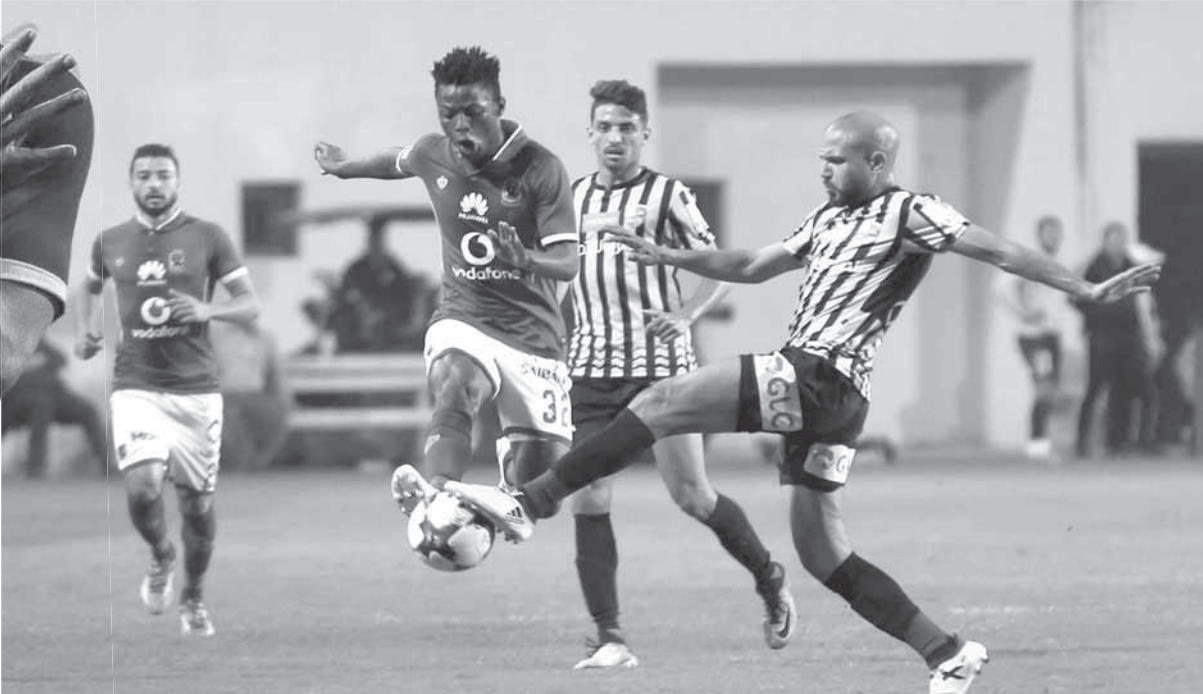
الأهلى يبحث عن تكرار الفوز على المقاولون