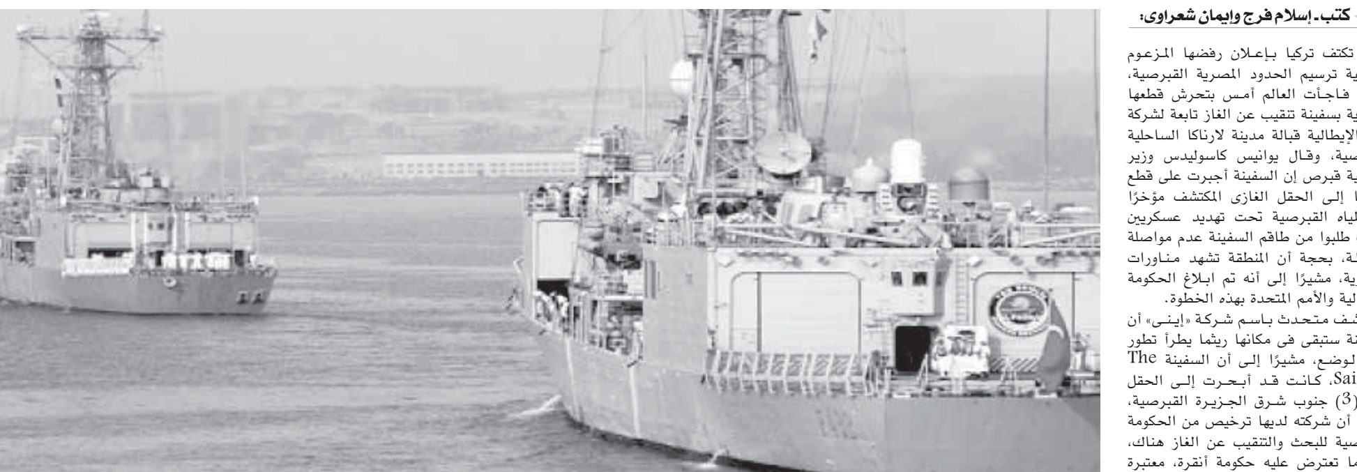
القطع البحرية التركية أثناء اعتراضها سفينة الاستكشاف «إيني»

وقد تعود هذه السفن مرة أخرى بعد إجراء تسويق مع دول الشرق المتوسط. وأوضح «المختص في الشأن التركي» أن تصريحات تركيا بشأن الاتفاقية تعد تدخلاً في شأن من شؤون مصر وقبرص، واعتداء على سيادة وحقوق الدولتين، وهو مخالف للقانون وللأمم المتحدة. وكانت شركة «إيني» قد أعلنت الخميس الماضي، أنها اكتشفت حقل للغاز الطبيعي في منطقة واعدة قبالة جزيرة قبرص الواقعة في البحر الأبيض المتوسط، وأنها تعتزم إجراء المزيد من الدراسات والبحوث حول هذا الاكتشاف.