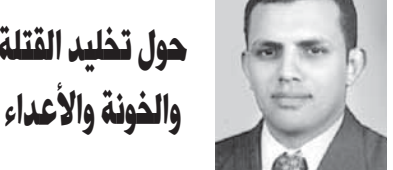
حول تخليد القتلة والخونة والأعداء