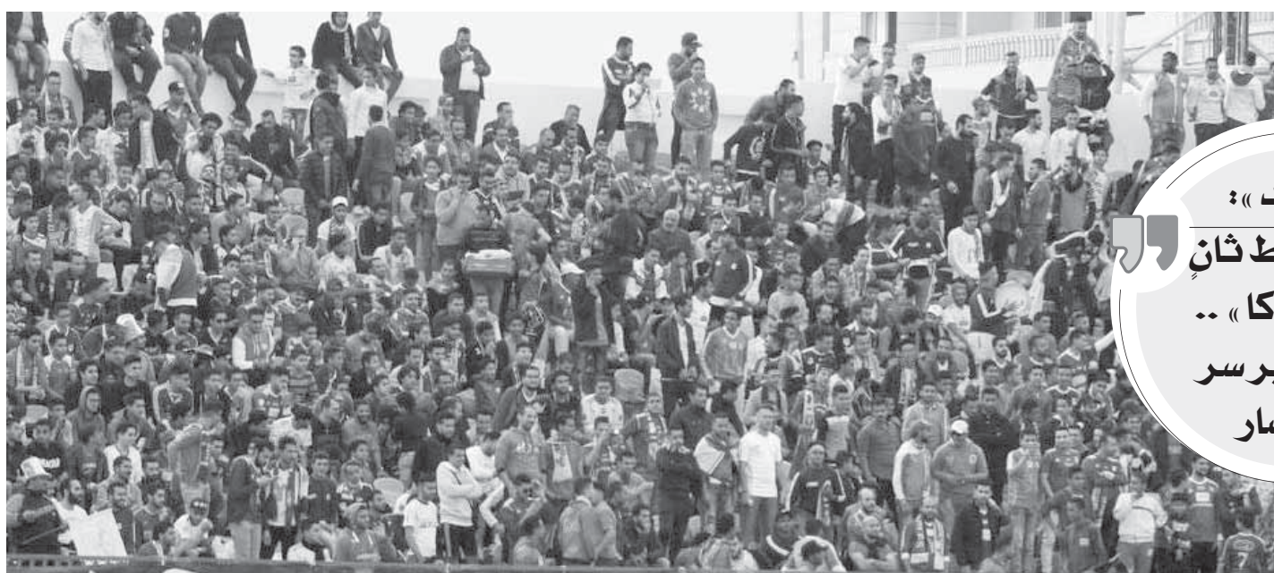
احتفالات جماهير المصري في مدرجات استاد بورسعيد

وكانت الفرحة الكبرى هي حضور أكثر من 20 ألف مشجع من أهالي بورسعيد الذين عادوا للحياة مرة أخرى من خلال مؤازرة فريقهم في مدرجات