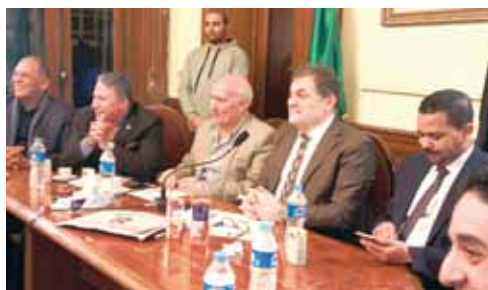
جانب من اجتماع رؤساء الأحزاب في مقر الوفد

احتضن حزب الوفد برئاسة الدكتور السيد البدوي اجتماع الأحزاب السياسية لسندة القوات المسلحة ورجال الشرطة في حربها على الإرهاب، وحث المواطنين على الإدلاء بصوتهم في الانتخابات الرئاسية، وفيما يلي نص البيان: انطلاقاً من المسؤولية الوطنية للأحزاب السياسية في تلك المرحلة الدقيقة التي تمر بها البلاد، فقد اجتمع بعقر حزب الوفد أحزاب الوفد والتجمع والمحافظين ومستقبل وطن والمؤتمر والنور والريادة والاتحاد، وهي من: الأحزاب المتمثلة ببيئات برلمانية في مجلس النواب، وأصدروا البيان التالي: