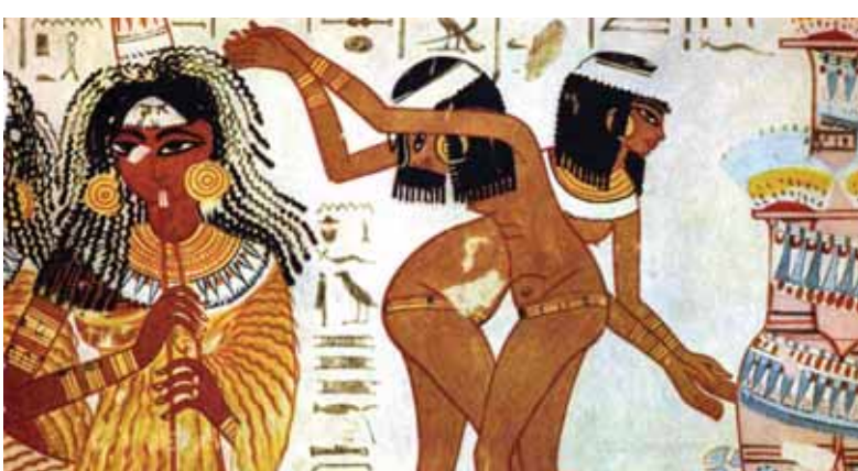
أحد الجداريات الفرعونية التي تعبر عن الحب

ومن المعروف أن مصر القديمة، اشتهرت بالكتب من قصص الحب التاريخية، التي ربطت بين قلوب المحبين، دون النظر لمكانة كل منهم، بل يكن الحب يعرف حدوداً للطبقات الاجتماعية، فارتبط الملك امتحنت الثالث، وهو من أعظم ملوك مصر القديمة، بقصة حب مع امرأة من عامة الشعب، هي الملكة «تي» فتزوج بها وشاركه في مقاليد الحكم بالبلاد. وهناك المهندس «سنموت»، ابن مدينة أرميت، في جنوب الأقصر، والذي ارتبط بقصة حب مع الملكة حتشيسوت، ومنحته حالة العشق التي ربطت قلبه بحتشيسوت، حالة إبداعية تجذب أنظار علماء الهندسة والعمارة حتى اليوم، إذ أقام «سنموت» أعظم معبد لمعشوقته حتشيسوت، هو معبد الدير البحري، المنحوت في صخور جبل القرنة، غرب مدينة الأقصر، ويعد من أجمل المعابد الفرعونية.