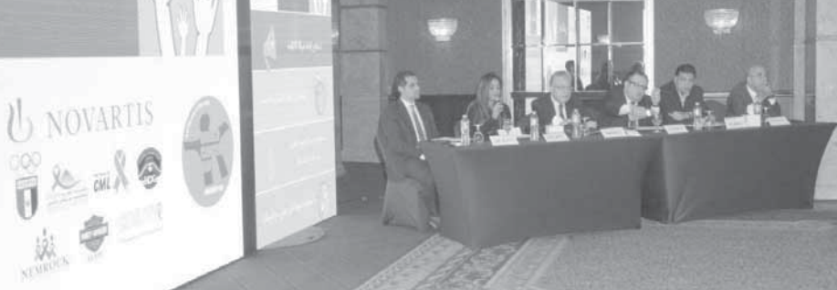
انطلاق اليوم العالمي للسرطان