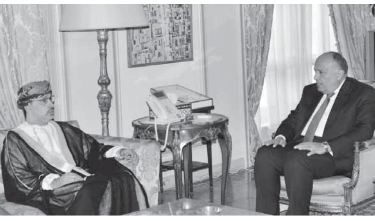
شكرى اثناء لقائه مع مسلم المعشنى نائب رئيس البرلمان العربى

كما استقبل وزير الخارجية، أمس، عزام الأحمدي، عضو اللجنة المركزية لحركة فتح للتواجد بشأن آخر المستجدات على الساحة الفلسطينية والتطورات الخاصة بملف المصالحة الوطنية.