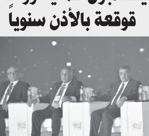
جلسات المؤتمر الدولي لزراعة القوقعة في مصر

انطلقت أعمال النسخة الثالثة للمؤتمر الدولي لزراعة القوقعة في مصر والشرق الأوسط تحت شعار «سمع واتكلم.. مصر 2018» بالتعاون مع وحدة زراعة القوقعة بجامعة القاهرة ووحدة زراعة القوقعة بمستشفى وادي النيل وبإمطة جمعيات الأنف والأذن والحنجرة، ومشاركة أكثر من 1400 طبيب ومتخصص من 33 دولة.