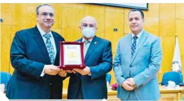
تكريم القاضي في أسيوط

المصرية الفارقة التي تشهد إعادة بناء الشخصية المصرية دينياً واجتماعياً وفكرياً وثقافياً، في ظل ثوابت من القيم والسمو والأخلاق والوطنية وهي التي تجد جذورها من خلال تاريخ عريق، وطالب القاضي مجلس الجامعات بتخصيص جوائز لأهم ثلاثة أبحاث عن بناء الوعي، وتخصيص لها مكافآت ولو رمزية أو معنوية، تمنح للفائزين في نهاية العام الجامعي، كي تمكن تجاوباً حقيقياً بين الطلاب وجامعاتهم، وتعزيز قيم الولاء والانتماء لمصرنا العالية.