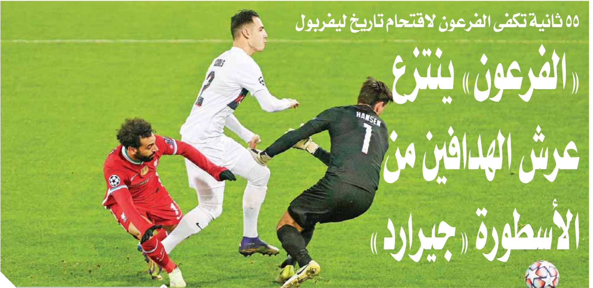
محمد صالح يدخل تاريخ ليفربول