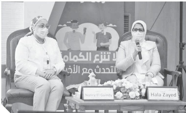
كتب: هشام الهلوتي

أكدت الدكتورة هالة زايد وزيرة الصحة والسكان، حصول المعامل المركزية التابعة للوزارة على الاعتماد الدولي من المجلس الوطني للاعتماد (EGAC) كأول معامل معتمدة في مصر والشرق الأوسط لإجراء تحاليل PCR وتحاليل الأجسام المضادة لفيروس كورونا المستجد (كوفيد ١٩). جاء ذلك، خلال الحدث العلمي السنوي الذي تنظمه المعامل المركزية (One Health approach) للعام الثاني على التوالي ويتضمن ورش عمل لتدريب الفرق الطبية من كافة محافظات الجمهورية على مدار ٣ أيام، ومحاضرات عن الأبحاث الحديثة لفيروس كورونا المستجد وأهم الأجهزة والتشخيصات. وأكدت الوزيرة على الدور الكبير للمعامل