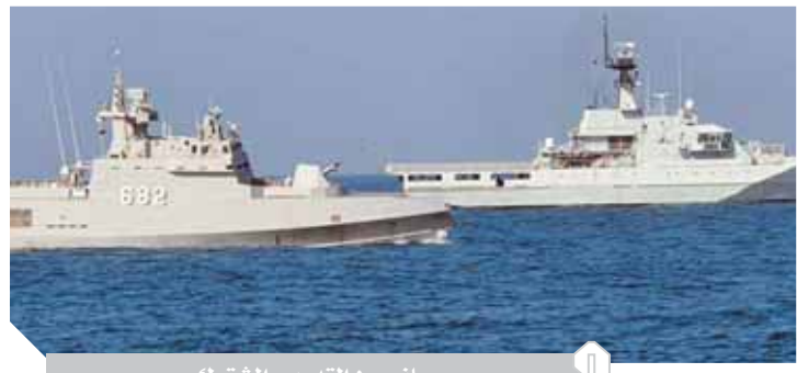
جانب من التدريب المشترك

الأربعاء 11 نوفمبر 2020م - ٢٥ ربيع أول ١٤٤٢هـ - ٢ هاتور ١٧٣٧ق | العدد ١٠٥٣٤ - السنة الثالثة والثلاثون