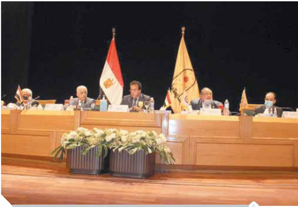
جانب من اجتماع المجلس الأعلى لشئون التعليم