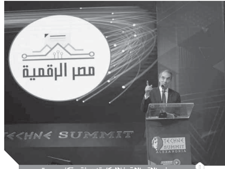
وزير الاتصالات خلال كلمته بمؤتمر تكني سميت

وهي من أهم ٢٠ جامعة في الولايات المتحدة الأمريكية في مجال الهندسة وسيتم البدء في البرنامج خلال العام ٢٠٢١/٢٠٢٠. أوضح «طلعت» أنه قد تم إطلاق منصة مصر الرقمية بشكل تجريبي لتقديم الخدمات الحكومية الرقمية للمواطنين وأنه المقرر إطلاقها بشكل رسمي قريباً، بما يمثل فرصاً واسعة للمبتكرين للتوسع في أعمالهم والمشاركة في منظومة التحول الرقمي؛ مشيراً إلى مبادرة «فرصتنا.. رقمية» التي أطلقتها الوزارة وبموجب المبادرة تم إتاحة نسبة ١٠٪ من كل مشروعات التحول الرقمي لتنفيذها من خلال الشركات المتوسطة والصغيرة الناشئة المقيدة في قاعدة بيانات هيئة تنمية صناعة تكنولوجيا المعلومات في ضوء قرار وزير م.ز. أشار إلى أن مشروعات التحول الرقمي تتطلب توافر بنية تحتية مؤمنة وكفء، حيث تم تنفيذ المرحلة الأولى من مشروع لتطوير البنية التحتية للاتصالات في ٢٠١٩ باستثمار بلغ مليارات ٦٠٠ مليون دولار، فيما تم البدء في تنفيذ المرحلة الثانية من المشروع في النصف الثاني من ٢٠٢٠ بتكلفة تزيد على ٣٠٠ مليون دولار في العام المالي الحالي وهو ما أسهم في