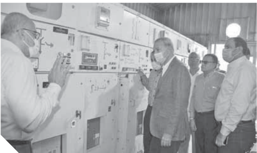
القليوبية- سمير بحيرى ومحمد عبد الحميد:

أطلق عبد الحميد الهجان محافظ القليوبية التيار الكهربائى من محطة محولات مدينة بنها الخاصة بمستشفى بنها التعليمي تمهيدا لتشغيلها تجريبيا وإدخالها الخدمة لاستقبال المرضى. وافق المحافظ الدكتور حمدى الطيخ وكيل وزارة الصحة والمهندس أمال بركات، وكيل وزارة الكهرباء والقلوبية والمهندس على عبد الستار رئيس مدينة بنها والكوتورة أمنية محمود خليفة مدير مستشفى بنها التعليمي. وأشار المحافظ، إلى أن موقع المستشفى متميز جدا لمتركزه وسط العديد من الخدمات الطبية مركز الإسعاف والمعامل المركزية ومستشفى التأمين الصحي ومستشفى الأطفال التخصصي وغيرها من الخدمات الصحية التي تستخدم المستشفى بعد افتتاحه. وأضاف أن المستشفى مخصص على أحدث المعايير الطبية العالمية ومزود بأحدث الأجهزة الطبية وغرف العمليات الحديثة، وذلك نظراً لدقة وأهمية العمليات الجراحية وأتباع أعلى معايير مكافحة العدوى.