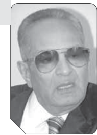
بهاء الدين أبو شقة