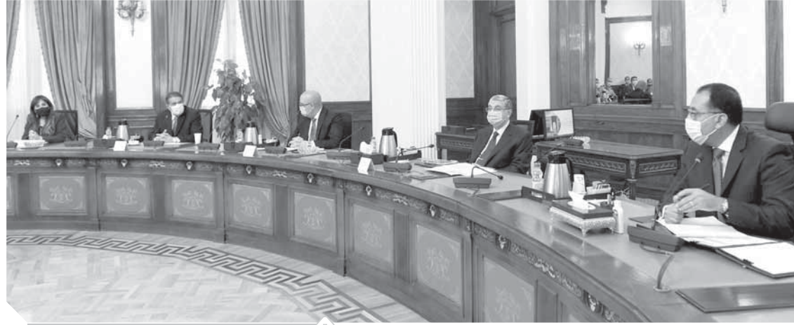
رئيس الوزراء خلال اجتماعه بوزير الآثار