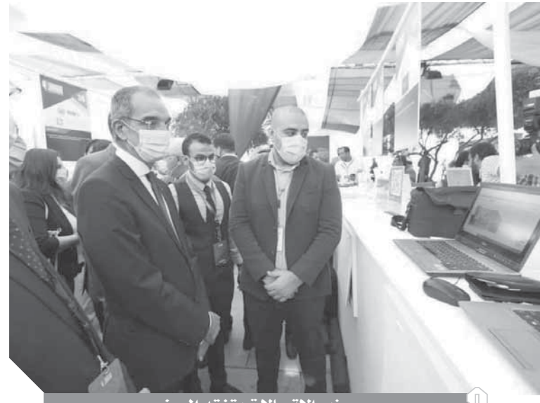
وزير الاتصالات يتفقد المعرض