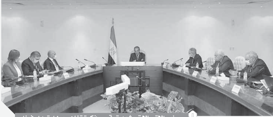
وزير الاتصالات يشهد توقيع مذكرة تفاهم بين ايتيدا وفيزا

novate.com التي تسعى من خلالها ايتيدا إلى تحفيز الإبداع التكنولوجي، وتعليم المبتكرين والشركات الناشئة، ونشر ثقافة ريادة الأعمال في المجتمع المصري. أكد المهندس عمرو محفوظ، أهمية هذه الشراكة بين هيئة تنمية صناعة تكنولوجيا المعلومات وشركة فيزا من أجل تهيئة البيئة المحفزة لنمو ريادة الأعمال في مجال التكنولوجيا المالية ونشر الوعي بشأن المفوعات الرقمية؛ موضحاً التطور التكنولوجي الذي تشهده مصر خلال المرحلة الحالية في ظل الجهود المبذولة لبناء مصر الرقمية.