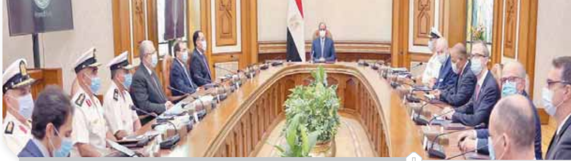
الرئيس السيى خلال متابعة مشروعات شركة «ديمى» فى مصر