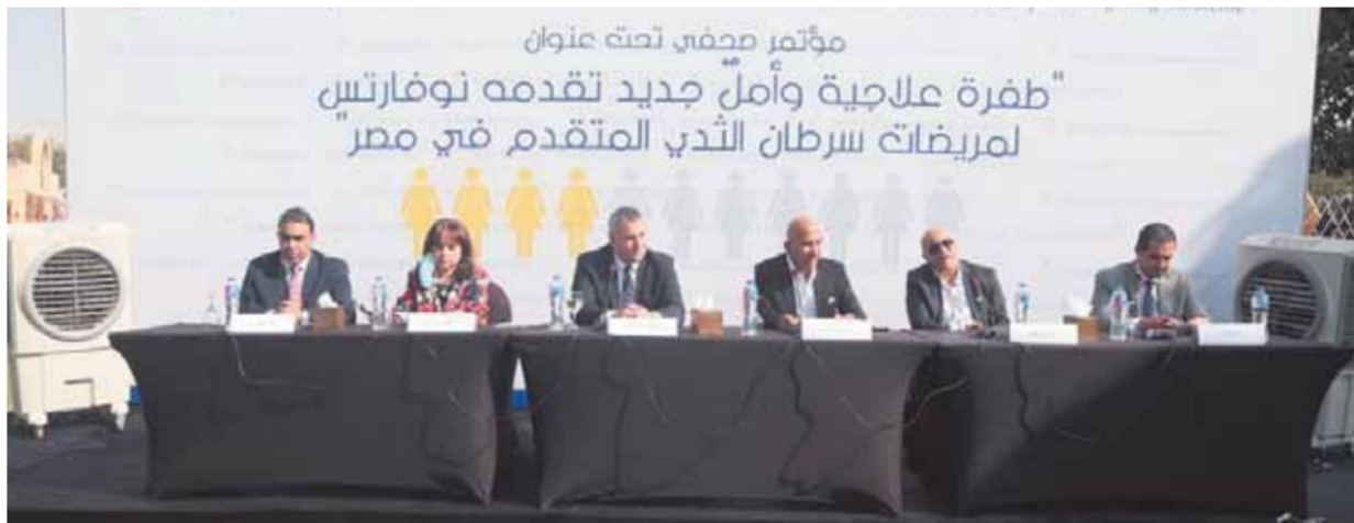
مؤتمر صحفي تحت عنوان

«طفرة علاجية وأمل جديد تقدمه نوفارتيس لمريضات سرطان الثدي المتقدم في مصر»