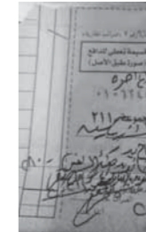
إيصال تسجيل العقار