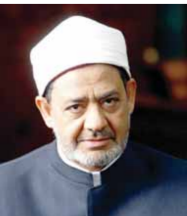
د. أحمد الطيب

مهم في الجانب العلمي، وذلك من أجل التأكيد على أهمية العلم ودور العلماء على مر التاريخ، وكيفية تحقيق كل فرد لدوره في المجتمع من خلال العلم؛ وأنه وسيلة قوية للبناء وتحقيق الأهداف والأمنيات. أشار الأمين العام إلى أنه يتم تنفيذ هذه الحملة بشكل مباشر عن طريق انتشار وعاظ وواعظات الأزهر الشريف في المدارس والمعاهد، بالإضافة إلى النشر الإلكتروني على موقع المجمع على بوابة الأزهر الإلكترونية، وصفحات التواصل الاجتماعي «فيس بوك وتويتر وتليجرام».