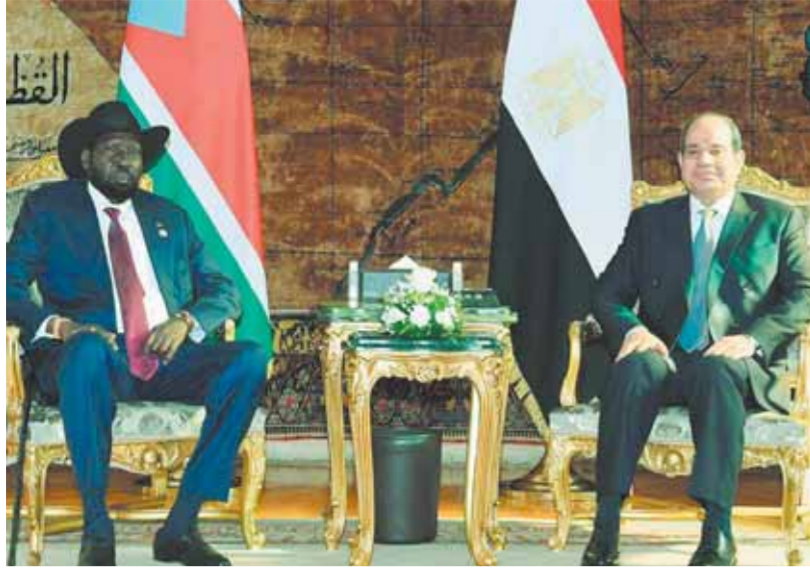
السياسي وسيلفا كير في قمة القاهرة