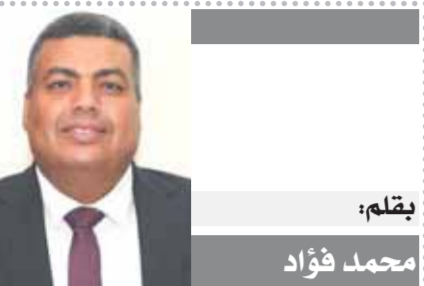
بقلم: محمد فؤاد

وأوضح البروفيسور ديجان يوريش، ومن جهته، أوضح البروفيسور ديجان يوريش،