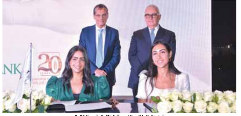
قيادات البنك والمؤسسة خلال توقيع المذكرة

شأنها تحسين فرص زيادة الدخل مع تسهيل الوصول لحلول الرعاية الصحية والخدمات اللازمة للمجتمعات المهشة، وعلى هامش توقيع مذكرة التفاهم، أقام كل من بنك الإسكندرية ومؤسسة ساويرس للتنمية الاجتماعية ومنظمة «ساموسيا» إلترا سبورتز، مصر للعلم والتمويل المشترك وبذل المزيد من الوقت والجهد من أجل فتح آفاق جديدة للمبادرات التنموية الهادفة إلى بناء مستقبل أفضل يليق بتطلعات الشعب المصري، فنحن نؤمن في مؤسسة ساويرس أن الشراكات هي الركيزة الأساسية لتحقيق التنمية المستدامة». ويطلع البنك والمؤسسة في إحداث تغيير حقيقي للشباب والنساء واللاجئين من خلال عدد من الخدمات، أهمها توفير تدريب مناسب وفرص حقيقية للتحسين والحرفيات وتسهيل الوصول إلى أسواق جديدة من خلال تقديم عدد من المعارض سنوياً، وكذلك إنشاء متاجر الكترونية خاصة بهم، علاوة على دمج الأشخاص ذوي الإعاقة في الاقتصاد الإبداعي والذي كان وسيظل من أهم أهداف هذه الشراكة. كما يسعى الطرفان إلى دعم المشاريع التي تسهم في التمكين الاقتصادي وتحسين سبل حياة الشباب والنساء، وتوفير فرص تعليمية من