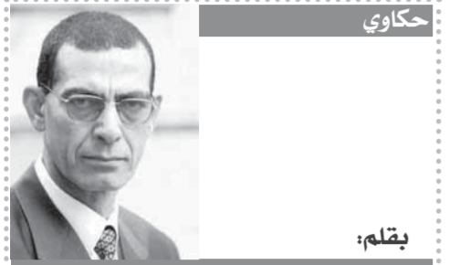
بقلم: د. وجدى زين الدين

كان هانى زادة، عضو مجلس إدارة نادى الزمالك، طعنًا قضائياً أمام محكمة القضاء الإدارى بمجلس الدولة، طالب فيه بإلغاء القرار الصادر بوقف واستبعاد مجلس إدارة نادى الزمالك، واخصم الطعن وزير الشباب والرياضة والمدير التنفيذي بوزارة الشباب والرياضة. يذكر أن وزارة الشباب والرياضة، قررت في بيان سابق لها، إحالة المخالفات المالية الواردة بالقرير المقدم من اللجنة التي فحصت ملفات نادى الزمالك وما تضمنته من مخالفات للنيابة العامة.