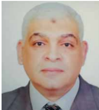
د. مصطفى كامل السيد

يتعرض كثير من مرضى السكر لحدوث مرض التهاب الأعصاب الطرفية السكرى، وهو أحد مضاعفات مرض السكرى، عندما يحدث تلف للأعصاب وخاصة الأعصاب الطرفية، ومع تقدم المرض قد يفقد المريض الشعور بالألم والإحساس في تلك المنطقة، وغالبا تتأثر القدمين وأصابعهما والساق أولا، ثم تتبعهما اليدين والذراعين، وقد تكون شكاوى يومية متكررة أو تظهر وتختفي كل فترة، ورغم أن العلاج في المراحل المبكرة لظهور الأعراض قد يكون بسيطا، إلا أن الإهمال والتأخر في الذهاب إلى الطبيب يسبب تدهور الحالة وزيادة المضاعفات، ويوضح الدكتور مصطفى كامل السيد، استشارى الأمراض الباطنة والسكر والقلب، أن مرض السكر من الأمراض المنتشرة عالميا بحدود ١٠٪ من عدد السكان، وهناك زيادة كبيرة لمعدلات الإصابة في مصر وعلى مستوى العالم أجمع، وللأسف تحتل مصر المركز الثامن عالميا في عدد مرضى السكر، وفقا للجمعية الأمريكية للسكر (A.D.A) والجمعية الأوروبية لدراسة السكر (E.A.S.D)، ومنظما عام ٢٠١٥ أن تقفز إلى المركز السادس عالميا، ولقد ارتفع مستوى السكر في الدم من الآثار الشائعة التي تحدث نتيجة عدم السيطرة على المرض وأهمال نصائح الطبيب المعالج، ويؤدى مع الوقت إلى حدوث أضرار خطيرة في العديد من أجهزة الجسم، وخاصة الأعصاب والأوعية الدموية ومنها التهاب الأعصاب الطرفية السكرية.