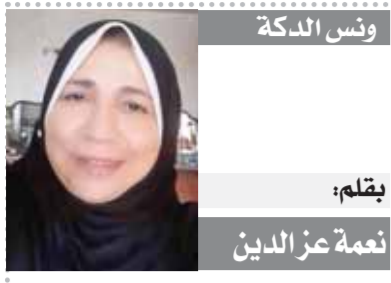
بقلم: نعمة عز الدين

في كتابه «المنازل والديار» الذي ألفه أسامة بن منقذ بعد حدوث زلزال قوى سنة ٦٥٢، فدمر حصن شترن بسوريا، بمن فيه من أبناء عموته وأقاربه، ضمن منقذ في خمسمائة صفحة مرقبات وأشعرا لمن قتلها من قصص أخرى. ولأن له من الكرار ما برز بقوة على مدار التاريخ، فلنا يمكننا التركيز في مبحثنا هذا على «أند الزلازل»، هكذا يبدو المصطلح قائما مقبضا، لكنه يخفى تحت وطأته الكثير والكثير، وفيما يلي نسوق نماذج لتلك الإبداعات: في كتابه «المنازل والديار» الذي ألفه أسامة بن منقذ بعد حدوث زلزال قوى سنة ٦٥٢، فدمر حصن شترن بسوريا، بمن فيه من أبناء عموته وأقاربه، ضمن منقذ في خمسمائة صفحة مرقبات وأشعرا لمن قتلها من قصص أخرى. ولأن له من الكرار ما برز بقوة على مدار التاريخ، فلنا يمكننا التركيز في مبحثنا هذا على «أند الزلازل»، هكذا يبدو المصطلح قائما مقبضا، لكنه يخفى تحت وطأته الكثير والكثير، وفيما يلي نسوق نماذج لتلك الإبداعات: