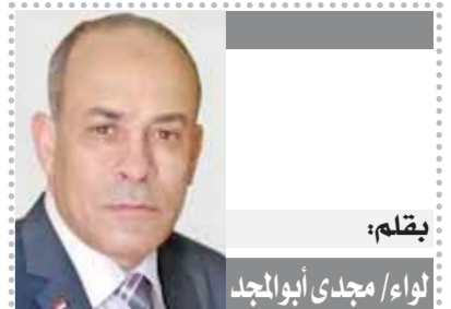
بقلم: لواء/ مجدى أبوالمجد