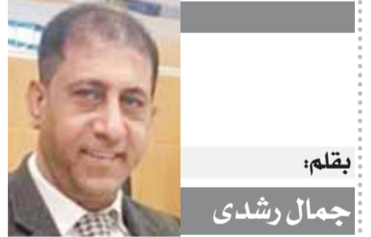
بقلم: جمال رشدي