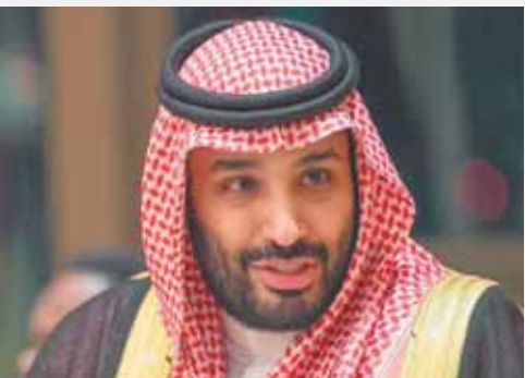
محمد بن سلمان

ويستهدف المشروع خلق بيئة متكاملة فى جده التاريخية تتوافر فيها مقومات طبيعية متعددة تشمل وأجهات بحرية مطورة بطول ٥ كم، وساحات خضراء وحدائق مفتوحة تغطى ١٥ ٪ من إجمالى مساحة جده البلد وضمن مساحة المشروع البالغة ٢.٥ كم مربع، وسيستفيد المشروع من هذه المقومات الطبيعية عبر تحويلها إلى عناصر داعمة لبيئة صحية مستدامة تعتمد فيها أسباب التلوث البئى.