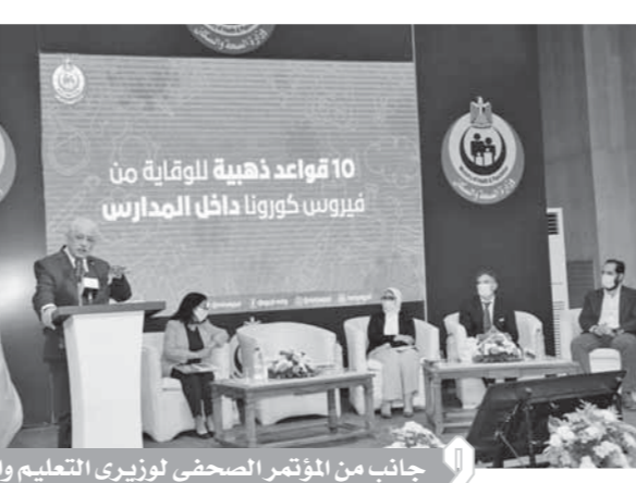
جانبا من المؤتمر الصحفي لوزيري التعليم والصحة

أمنته بين الآخرين، لا مساحفة لا معانقة لا تقبيل، الانتظار خارج المكاتب أو الحمامات في مسافات أمنة أفضل من الانتظار داخل تلك الأماكن. عدم الاقتراب من أماكن بها تزاحم، تناول الأطعمة المفيدة والنوم فترات كافية والحرص على ممارسة التمرينات الرياضية الخفيفة بالمنزل). وأشارت الوزيرة إلى سعيها إلى عملية الربط الإلكتروني بين وزارتي الصحة والسكان والتربية والتعليم لتابعة العمل بهذه الخطة بجميع المدارس، لرصد وتحليل بيانات الطلاب، والإبلاغ الفوري عن الاشتباه في إصابة أي طالب. وكشفت الوزيرة عن إطلاق حملة توعوية خلال الأيام المقبلة، هدفها زيادة الوعي لدى الأطفال وأسره من السلوكيات الصحية، يقودها الفنان أحمد أمين، لقدرة على إقناع كثير من الأطفال بأهمية الصحة المدرسية من خلال حملات إعلامية توعوية سابقة، لافتة إلى تكثيف التوعية للطلاب بشكل مباشر من خلال الرائدات الريفيات والمدارس، والمشورات التوعوية، وبشكل غير مباشر من خلال الحملات الإعلامية للتوعية بكيفية الوقاية من الفيروس، والالتزام بالإجراءات الوقائية والاحترازية. وأكدت أن مصر تعمل على إتباع إرشادات وتوصيات منظمة الصحة العالمية، عند البدء في عودة أي نشاط، ووفقاً لرؤية القيادة السياسية باستمرار عجلة الإنتاج من أجل التنمية الاقتصادية للدولة.