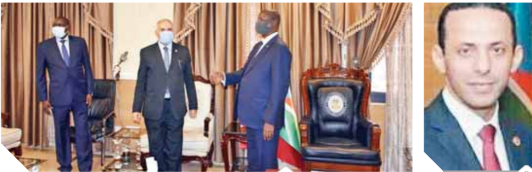
رئيس جنوب السودان أثناء استقباله وزير الري