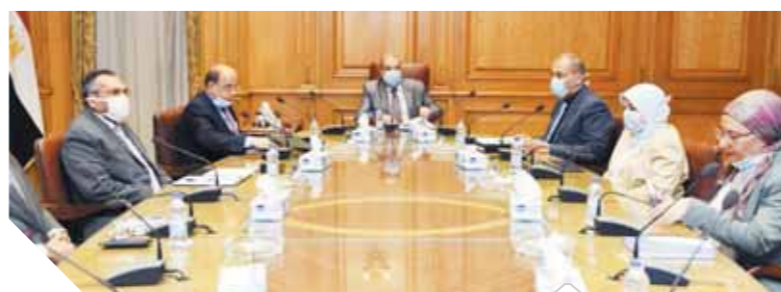
وزير الإنتاج الحربي أثناء لقائه رؤساء الشركات

وأوضح وزير الدولة للإنتاج الحربي أنه سيقوم بعقد اجتماع شامل لكل رؤساء مجالس إدارات الشركات والوحدات التابعة لوزارة الإنتاج الحربي لوضع رؤية استراتيجية واضحة ومحددة لكل شركة على حدة تهدف للتطوير بما يلائم طبيعتها وتحديد سبل النهوض بالعمل والإنتاج لديها وفقاً لما تم استعراضه خلال الاجتماعات السابقة ودراسة الملفات والموضوعات التي طرحت خلال هذه الاجتماعات، مشيراً إلى أن مصنع الوزارة ووحدها التابعة منفتحة للتكامل والتعاون مع كافة مؤسسات الدولة الصناعية المختلفة كالهئية العربية للتصنيع ووزارة الأعمال ووزارة التجارة والصناعة وشركات القطاع الخاص في المجالات كافة، كما تسعى إلى سد احتياجات السوق المصري وصولاً لتصدير للخارج.