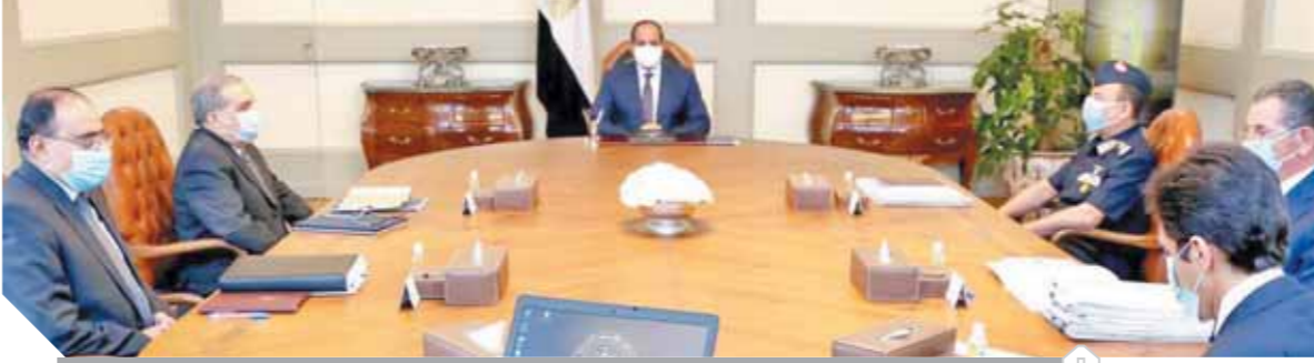
السياسي خلال اجتماعه أمس مع وزير الإنتاج الحربي وقائد القوات الجوية

صناعات غذائية وزراعية، ويصبح المشروع قيمة مضافة لمنظومة المشروعات القومية في مجال الزراعة والغذاء على مستوى رقعة الجمهورية.