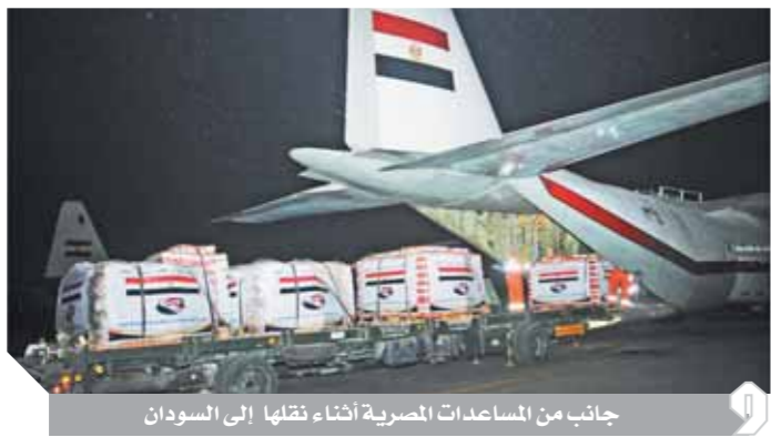
جانب من المساعدات المصرية أثناء نقلها إلى السودان