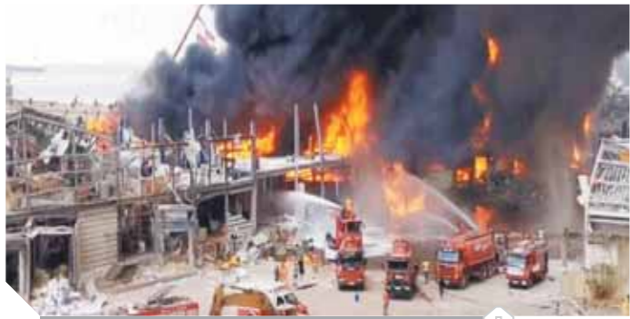
قوات الجيش اللبناني أثناء محاولة إطفاء الحريق