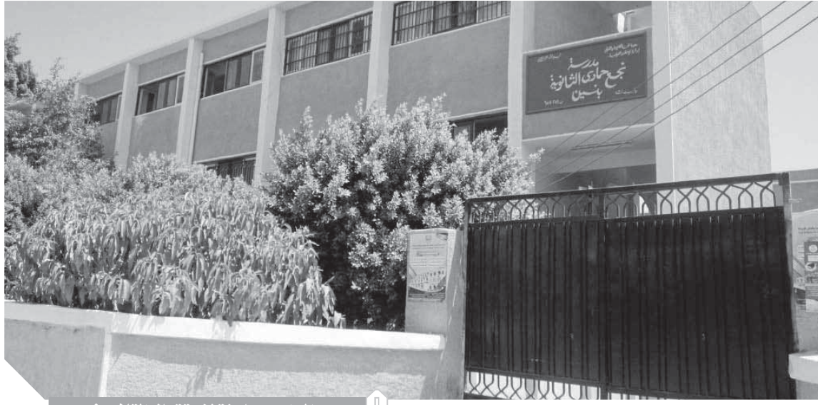
المدارس جاهزة لاستقبال التلاميذ

كما ناقش رئيس الجامعة مع عمداء الكليات استعدادات كل كلية لاستقبال العام الجامعي الجديد ٢٠١٩/٢٠٢٠ والتأكيد على الانتهاء من الدواول الدراسية وإعلانها للطلاب قبل بدء الدراسة وصيانة المعامل وتجهيز القاعات والمدرجات بالكليات.