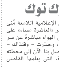
باي توك توك