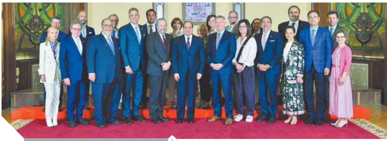
السياسي خلال لقائه مع وفد الشؤون الإسرائيلية

عملية السلام في الشرق الأوسط، حيث أكد «السياسي» أن حل القضية الفلسطينية وتحقيق مكافأة الإرهاب والتصدى للفكر المتطرف وحقوق وأعمال الشعب الفلسطيني وفق وثائق المرجعيات الدولية، من شأنه أن يغير واقع المنطقة، ويضع اتفاقاً واسعاً لتبنيها وتطويرها وتوفير الرخاء والتقدم والأمن لجميع شعوبها، ويقوض الفكر المتطرف الذي يفرز العنف والإرهاب، مشيراً في هذا الإطار إلى أن تسوية النزاع الفلسطيني الإسرائيلي ليس هاماً فقط للشرق الأوسط واستقراره، وإنما تمتد أهميته للعالم أجمع.