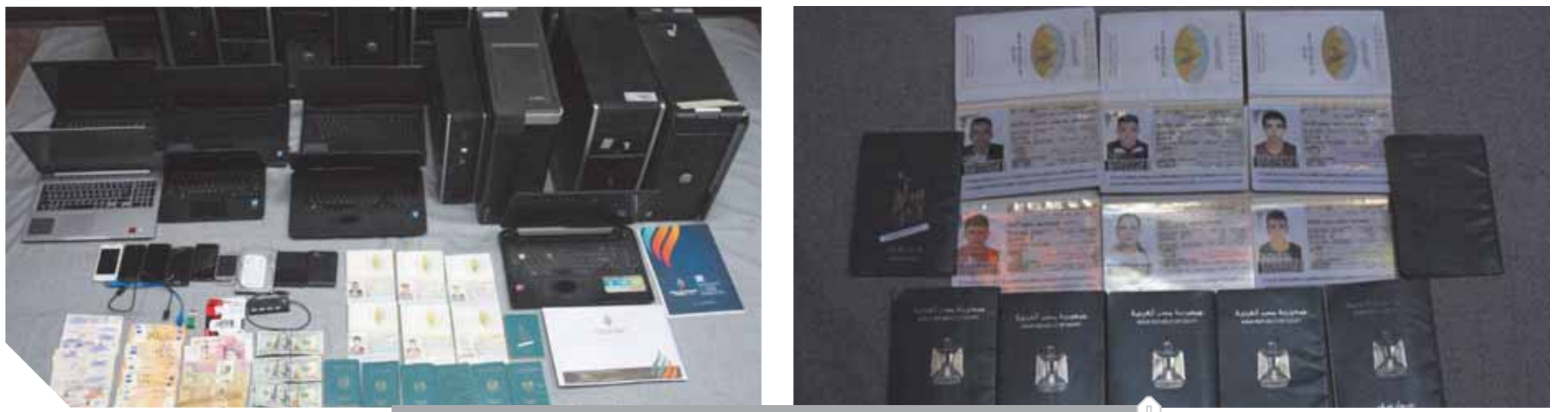
جانب من المضيوتات

رصد 3 مخططات إخوانية في تركيا لارتكاب أعمال عنائية بالبلاد ضبط 16 متورطاً وإحباط تهريب أموال لقيادات الإخوان في تركيا