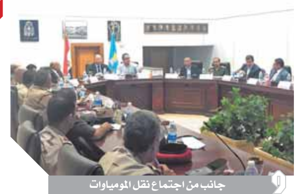
جانب من اجتماع نقل المومياءات

كتب- ناصر عبدالمجيد: استقبل الرئيس عبدالفتاح السيسي أمس وفد مركز الشؤون الإسرائيلية واليهودية بكندا، وذلك بحضور عباس كامل رئيس المخابرات العامة، والسفير الكندي بالقاهرة. وصرح السفير بسام راضي، المتحدث الرسمي باسم رئاسة الجمهورية، بأن الرئيس أعرب عن ترحيبه بمبادرة المركز بزيارة مصر، بما يسهم في تعزيز العلاقات المصرية الكندية، وذلك لما للمركز من مكانة متميزة وعلاقات قوية مع دوائر صنع القرار الكندية بمختلف توجهاتها. كما أشار «السياسي» إلى الاعتزاز بالعلاقات المصرية الكندية، وأهمية ترسيخ التعاون بين البلدين على كل الأصعدة السياسية والاقتصادية والثقافية، مشيداً في هذا الصدد بما شهدته العلاقات مؤخراً من تطور في ضوء تبادل الزيارات رفيعة المستوى وأخرها زيارة رئيس مجلس الشيوخ الكندي للقاهرة في مايو الماضي، بالإضافة إلى التعاون في العديد من المجالات التنموية، لا سيما مجال التعليم من خلال افتتاح أفرع عدد من الجامعات الكندية في مصر، فضلاً عن الدور المهم لأبناء الجالية المصرية داخل المجتمع الكندي في دعم وتعزيز العلاقات بين الدولتين على مختلف المستويات. من جانبهم، أكد أعضاء الوفد الكندي حرصهم على زيارة مصر وتشرفهم بالالتقاء بالسياسي، وذلك إيماناً بدور مصر المركزي في منطقة الشرق الأوسط، لا سيما في ظل جهودها الحثيثة لتحقيق الاستقرار ودفع جهود التوصل لحلول سياسية للأزمات التي تروجح بها المنطقة، وتقديراً لدور الشخصيات لـ «السياسي» في مكافحة الفكر