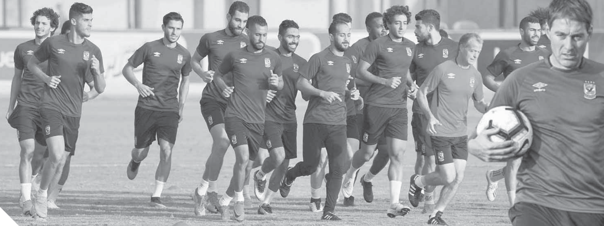
الأهل يسافرون اليوم إلى غينيا الاستوائية