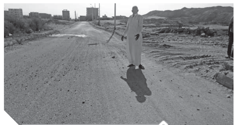
أحد المواطنين يطالب بنقل الحجر