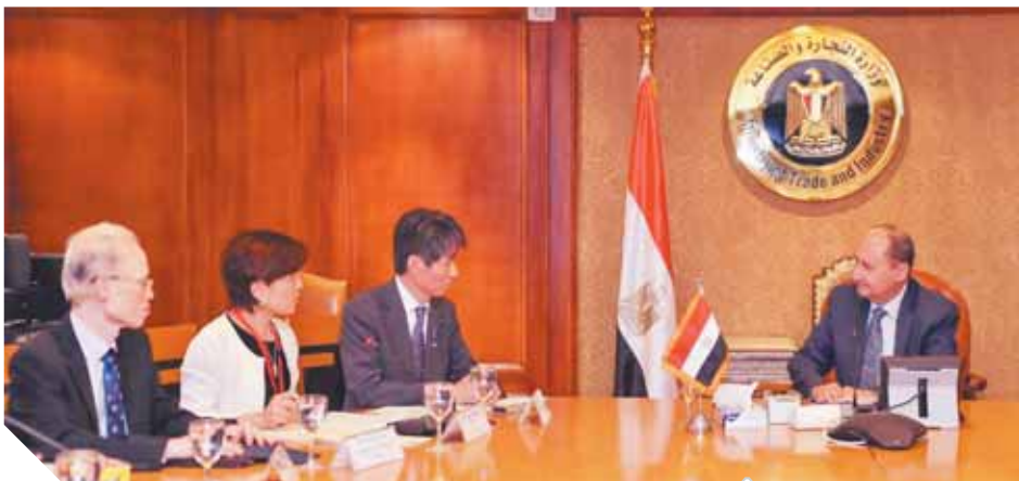
وزير الصناعة خلال لقائه وزير الاقتصاد الياباني

أعمالها اليوم بالقاهرة بمشاركة أكثر من ٢٥٠ مشاركاً من القطاعين العام والخاص منهم ١٠٠ رجل أعمال ياباني بهدف دعم وتعزيز التعاون الاقتصادي العربي الياباني المشترك، مشيراً إلى أن الفترة الأخيرة شهدت زخماً كبيراً في العلاقات بين مصر واليابان انعكس في الزيارات الرسمية المتبادلة بين المسؤولين بالبلدين. وأكد إيسوزاكي حرص بلاده على زيادة التفاعلات اليابانية العاملة في مصر والتي يبلغ عددها نحو ٥٠ شركة فضلاً عن ضغ المزيد من الاستثمارات اليابانية في مصر بما يتناسب مع مستوى العلاقات التي تربط البلدين.