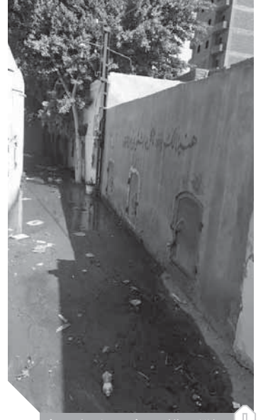
المقابر تفرق في مياه الصرف