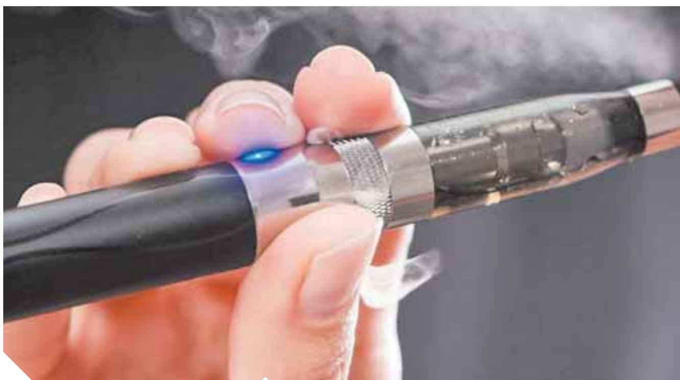
التدخين الإلكتروني أصبح حقيقة واقعية

شاعت المجتمعات أم أبت... رحبت المؤسسات العلمية والبحثية أم رفضت... هاج الأطباء أم التزموا الصمت... شرعت المنظمات المعنية بالصحة قوانينها وبيّنت تحذيراتها أم استهجنّت وشجبت وحذرت... سيقول التدخين الإلكتروني كلمته وسيغرض سطوته وقوته لا لشئ إلا جريا للعادة والحاجة والثبات هي أم الاختراع الأزل، كما وصفت في قديم الأزل، بالأسس العبد سقطت كل المنظمات وكل الأسر، والأطباء والشيوخ على المنابر، وكل المنظمات بما فيها منظمة الصحة العالمية وغيرها سقطوا مدويين في محاربة التدخين والقضاء عليه وسيبقى التدخين والمدخنون وصناعة التبغ قائمة ولكن!!!