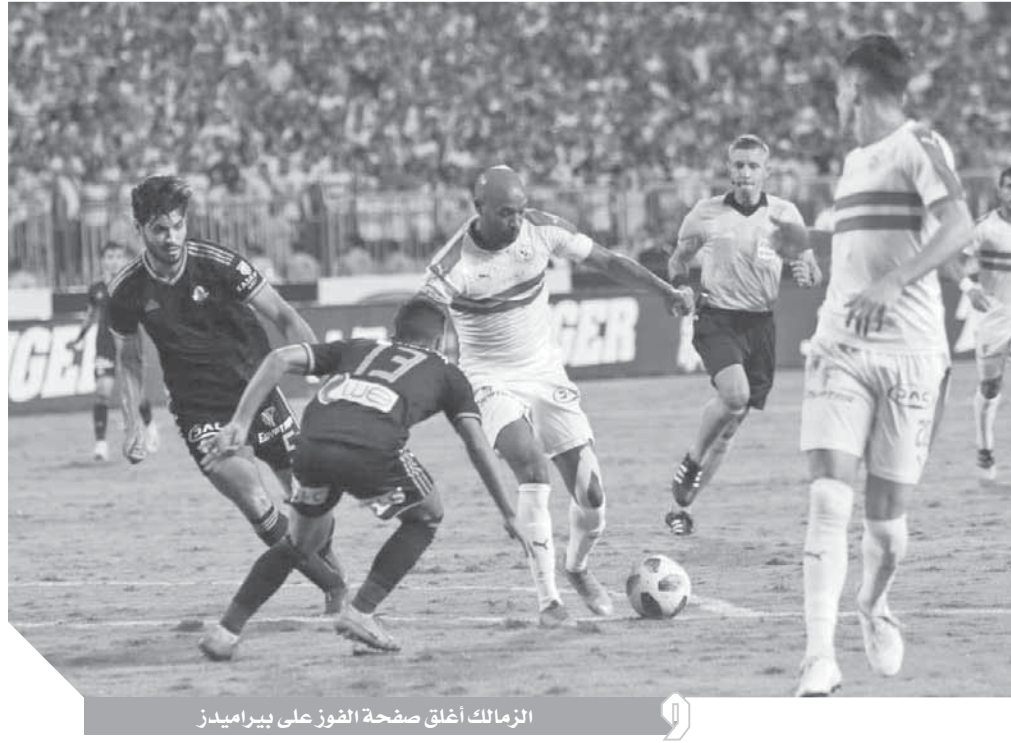
الزمالك أطلق صفحة الفوز على بيراميدز