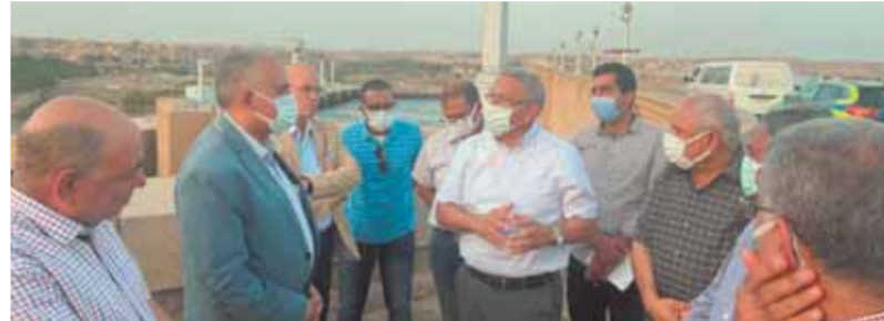
وزير الري خلال الجولة