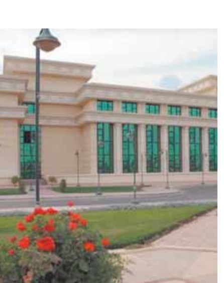
أستاذة الفلسفة وعلم الجمال