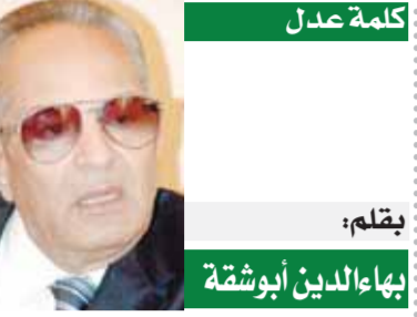
كلمة عدل بقلمه: بهاء الدين أبو شقة