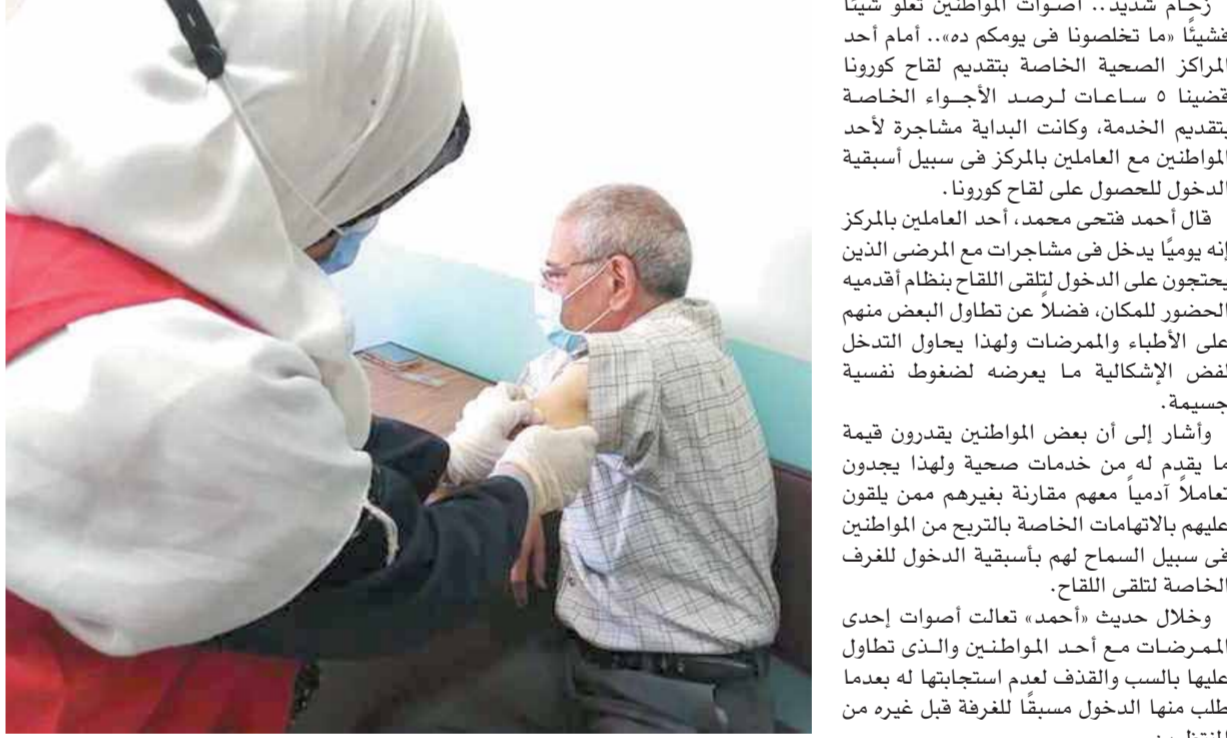
مواطنون يقبلون على تلقي اللقاح

يتناولون عليه وعلى غيره من الأطباء الذين يقدمون لهم خدمات لقاح كورونا. وأشار إلى أنه من الأقاليم ولم يَرِ أبناءه لأسابيع طويلة بسبب ظروف العمل وخدمة المواطنين، مؤكداً أن حافز الإثابة المختلفة بالأطقم الطبية المشاركين في المبادرات المختلفة لم يحصلوا عليه منذ عامين كاملين، وتابع: «لو هتكلم عن المأسى التي بشوفوها يومياً مش محافظات نجحت بالفعل في صرف الحافز، بينما ما زال العاملون في القاهرة والجيزة في انتظار هذا الإنجاز، وهو ما يؤكد أن الأمر يحتاج لقانون عام ينظم المسألة. ومن هنا، أكد عصام القاضي، عضو لجنة الصحة بمجلس النواب، أن اللجنة تقدمت بمشروع قانون في نهاية الدورة الماضية بشأن حافز الأطقم الطبية، وتمت الموافقة عليه. وأضاف النائب أنه من المفترض أن يتم تطبيق القانون بأثر رجعي بما يضمن حقوق جميع العاملين في هذا المجال، خاصة الذين شاركوا في المبادرات الرئاسية. وعن سبب تأخير تطبيق القانون على أرض الواقع، أكد النائب أن السبب في ذلك هو عدم بت اللجنة التنفيذية في القانون وتحديد قيمة الحافز لكل من الطبيب أو الممرض. ونوه «القاضي» إلى أن جميع العاملين في الأطقم الطبية بذلوا جهوداً جبارة في سبيل تقديم الخدمات للمواطنين، فهم بالفعل بالجيش الأبيض في مواجهة الأزمات الصحية بداية من مشاركتهم في مبادرة ١٠٠ مليون صحة، حتى حملة تطعيم المواطنين ضد فيروس كورونا.