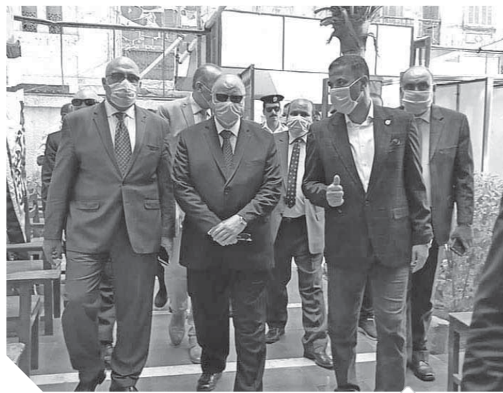
محافظ القاهرة خلال تفقده عدداً من المقرات الانتخابية

باستمرار رفع كفاءة الشوارع المحيطة بالمقرات، وإطمأن على غرف المبيت للخدمات القائمة على تأمين المقرات وإعادها بالفراش المناسب.