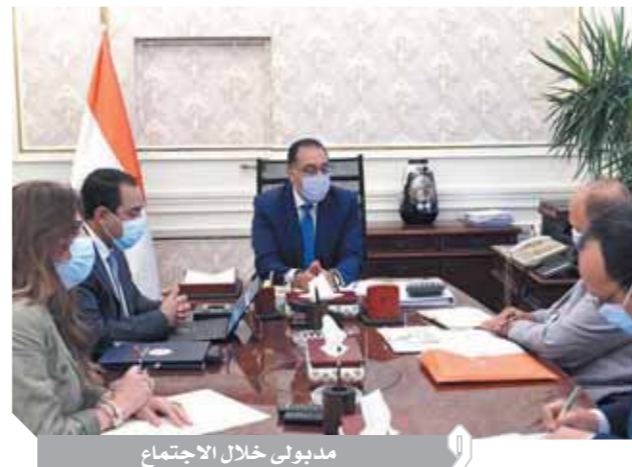
مدبولي خلال الاجتماع

يتم التوسع في إنشاء التسييمات الإدارية، الأمر الذي يؤدي إلى تضخم التسييمات والجهات ذات الأنشطة المتشابهة، بحيث يكون الهيكل التنظيمي أكثر تعبيراً وواقعية، بما أداء أعمالها بشكل أفضل، وهذا أمر مهم في غاية الأهمية ويعتبر توجهاً عالمياً. كما وجه بمراجعة كل الجهات