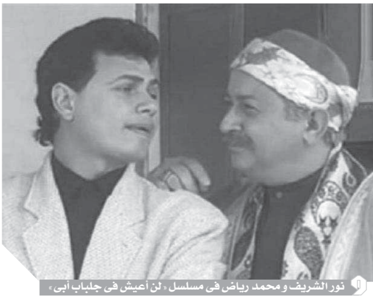
نور الشريف ومحمد رياض في مسلسل «لن أعيش في جلباب أبي»

نور الشريف كان يحق فتاناً متكامل جمع بشكل مذهل بين النجاح والنجومية في عالم السينما، والنجاح والنجومية في عالم الدراما التلفزيونية، يبقى يحق فتاناً خالداً بنه الراقي الذي عبر بصوت عن المواطن المصري الأصلي مع تغير الظروف الاقتصادية والاجتماعية والسياسية. ترك نور الشريف برحيله فراغاً هائلاً من الصعب أن نجد مثيلاً يملك القدرات الخارقة التي جعلته معشوق الملايين في عصور مختلفة.