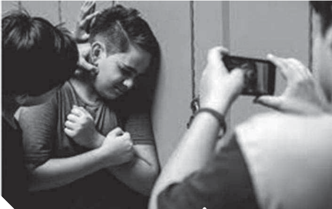
غيباء دور الأسرة وراء تقشى الظاهرة

وقد نعت المادة الجديدة على انه « بعد تمرا كل استعراض قوة او سيطرة للجانى، او استغلال ضعف للمجنى عليه، او لحالة يعتقد الجانى انها تسن للمجنى عليه، كالجنس او العرق او الدين او الاوصاف البدنية، او الحالة الصحية او العقلية او المستوى الاجتماعى، بقصد تخويله او وضعه موضع السخرية، او الحط من شأنه او اقصائه عن محيطه الاجتماعى».