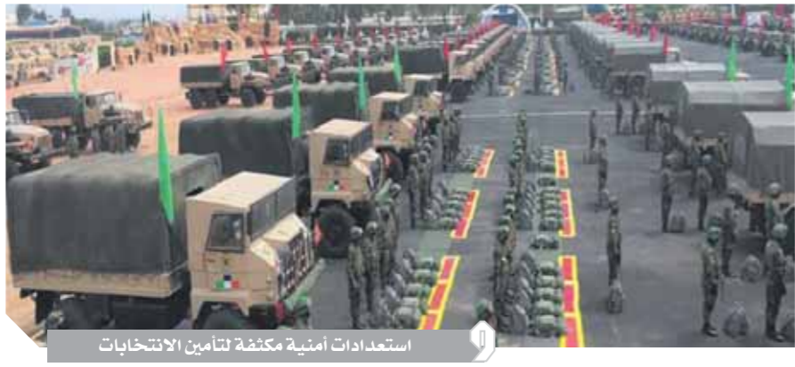
استعدادات أمنية مكثفة لتأمين الانتخابات