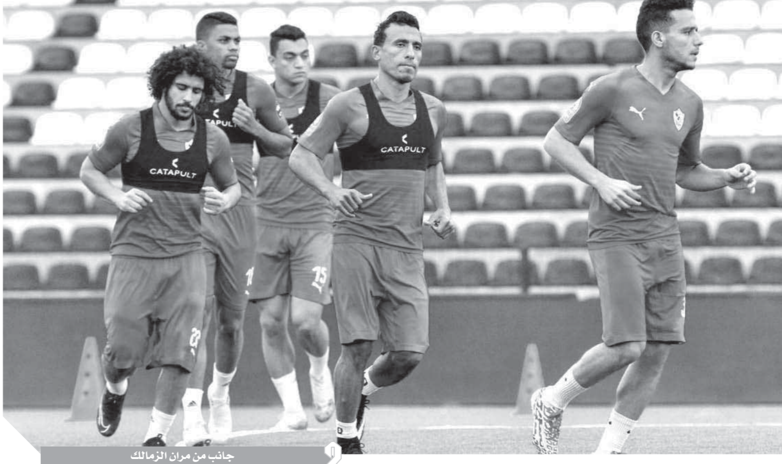
جانب من مران الزمالك