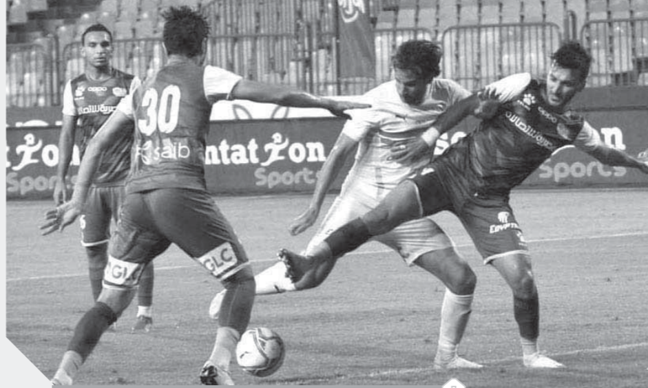
اصابات كورونا ضربت المصري بعد مواجهة الزمالك

ولا يتطور أيضاً مستوى اللاعب الأجنبي جيرالدو رغم أنه سيكون أمام