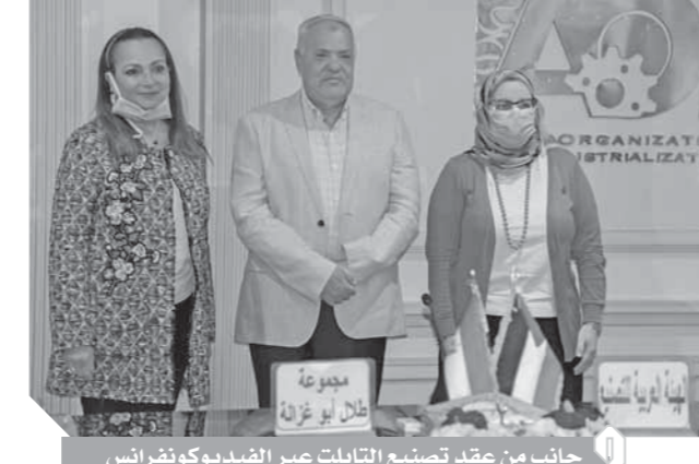
جانب من عقد تصنيع التابليت عبر الفيديو كونفرانس

كتب- محمد صلاح وأبويزد كمال وسامية فاروق: