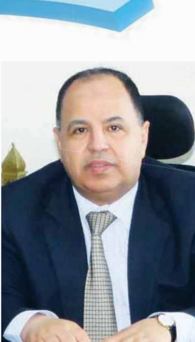
د. محمد معيط

من ضغوط الاحتياجات التمويلية. وجاءت مؤشرات الأداء المالي للموازنة العامة للدولة خلال ١١ شهراً الماضية في الفترة من يوليو إلى مايو ٢٠٢٤، «أفضل من المستهدف»، حيث بلغ لفاوض الأولى ٨٢٢ مليار جنيه بنسبة ٥٨,٧٪ من الناتج المحلي بدلاً من ١١٦ مليار جنيه بمعدل ١,١٥٪ في نفس الفترة من العام المالي الماضي، وتراجع العجز الكلي إلى ٣,٦٪ من الناتج المحلي بدلاً من ٦,١٪ في العام المالي الماضي رغم حدة التضخم وارتفاع أسعار الفائدة وتغير سعر الصرف وارتفاع فاتورة الدعم وخدمة الدين، وارتفعت الإيرادات العامة خلال الفترة من يوليو إلى مايو ٢٠٢٤ إلى ٢,٢ تريليون بمعدل نمو ٧٣,٧٪ عن نفس الفترة من العام المالي الماضي.