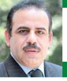
بقلم: عبد العزيز النحاس

رأسها أن الأغلبية الكبيرة من الفرنسيين قد انحازت إلى الدولة الفرنسية واستقرارها في مواجهة التطرف والانقسام الذي يهدد ما ومستقبل فرنسا، وأن الأحزاب السياسية الفرنسية تمتلك خبرات سياسية كبيرة ومرونة واعية، واستطاعت رغم كل خلافاتها أن تتفق على نقاط مشتركة بعد أن استشعرت الخطورة من تقدم اليمين المتطرف في الجولة الأولى، وقامت بالتنسيق فيما بينها لتشكيل كتلة مواجهة، وتمكنت من خلال هذا التحالفات من توجيه ضربة ساحقة وإسقاط اليمين المتطرف ووقف خطورته على الدولة الفرنسية، وحققته هذه الأحزاب انتصارا تاريخيا بعد أن تمكنت الجبهة الشعبية الجديدة من الفوز بالمركز الأول وحصد ١٨٢ مقعدا من مقاعد الجمعية الوطنية - البرلمان - كما حقق التحالف الرئاسي لمازور ١٩٨ مقعدا متحلا به المركز الثاني، وجاء التجمع الوطني اليميني - اليمين المتطرف - في المركز الثالث ١٤٢ مقعدا، ومما لا شك فيه أن الجالية العربية والإسلامية قد لعبت دورا مؤثرا في هذه الانتخابات التي شكلت تحديا هاما لمستقبلهم ومستقبل فرنسا بشكل عام التي أكدت غالبية مواطنيها الحفاظ على الاستقرار والتنوع الثقافي والسياسي لفرنسا.