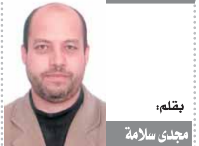
بقلم: مجدي سلامة