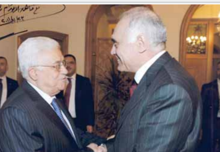
مع الرئيس الفلسطيني أبو مازن