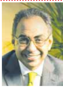
بقلم: د. هاني سري الدين

لقد كان الناس يعتبرون المحامي شخصا مروغا، طالبا للمال، وموظفا كل جهد وقدرته في سبيل تحقيق الفوز لموكله، لكن كما يقول العقاد، فإن مهنة المحاماة لم تهبط بسعد زغلول كما كان يخشى، بل هو الذي ارتفع بها. وكل ما صنعه الرجل هو أنه لم يقبل قط الدفاع عن باطل، ولم يرفض قط الدفاع عن حق، ولم يحضر جلسة إلا ودرس جميع جوانبها. وكان (كما يقول العقاد) إذا عرضت فرصة للصلح بين متخاصمين، ينتهزها ويشجع موكله على قبولها برد مقدم الأتعاب، فكان يقيد مقدم الأتعاب في باب الأمانات لا باب الموارد ليقى نفسه ضعف نفسه كما كان يقول، حتى إذا أراد الموكل الصلح رد إليه ماله وقال له: هذه أمانتك.