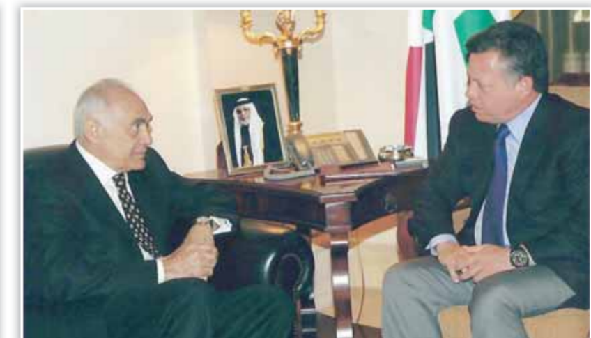
مع جلالة الملك عبدالله الحسين ملك الأردن