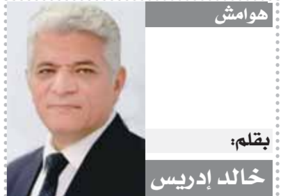
هوامش بقلم: خالد إدريس