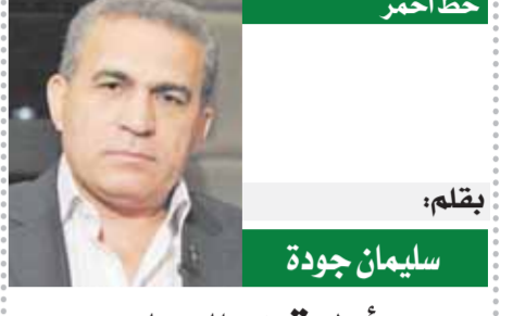
بقلم: سليمان جودة

وتراث سعد زغلول في الأخلاق والسجايا الكريمة أعظم وأبقى من تراثه السياسي، مع خاصته تقديرا لِعطائه فيما قدمه على الساحة السياسية وزيرا، وبرلمانيا، ورئيسا للحكومة، وزعيما فريدا للأمة كلها. وحسبنا أن نستذكر كيف اشتهر بأخلاقه المستقيمة خلال احتفائه مهنة المحاماة منذ ١٨٨٤ إلى ١٨٩٢، حتى إن العقاد يقول في كتابه عن سيرته إن مهنة المحاماة قبل سعد، كانت على حال ثم صارت في حال آخر بعد عمله بها.