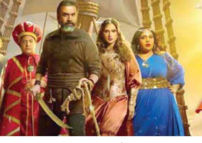
فني مسرح الغدليبي

العندليب في أحضان البحر بـ «حبيبتى من تكون».. وكريم عبد العزيز ونيللي كريم في عودة جديدة للمسرح