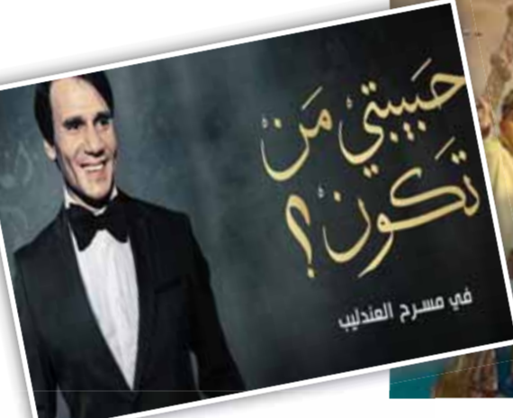
فني مسرح الغدليبي

مدحت صالح: «العلمين» مهرجان السحر الذي يؤكد زيادة مصر تحت شعار «العالم علمين» افتتح النجم الكبير مدحت صالح فعاليات الليلة الأولى من المهرجان، وهي الليلة التي تطلق تحت عنوان «مقامات موسيقية». ويشارك الفنان مدحت صالح في حلقة مختلفة من برنامج «معكم» الذي تقدمه الإعلامية منى الشاذلي والذاع على قناة «أون»، ومن المقرر أن تفتتح تلك الحلقة القادمة ضمن فعاليات الدورة الثانية من المهرجان، وسط الجمهور على المسرح الروماني بمدينة العلمين الجديدة، إذ من المقرر أن يقدم مجموعة من أبرز أعماله الغنائية. قال النجم مدحت صالح إن مهرجان العلمين أصبح من أهم المهرجانات الثقافية في مصر والعالم العربي، وشرف لكل فنان المشاركة في هذا الحدث الذي يبرز التطور والتقدم التي وصلت له مصر