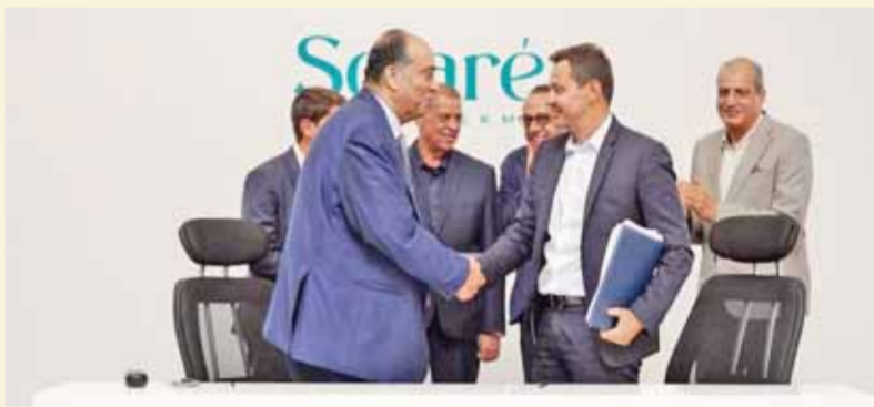
مجلس إدارة مجموعة ريدكون للتعمير، «إننا سعداء بتعاوننا مع شركة بحجم مصر العقارية القوية والتي تشاركنا نفس الرؤية الرامية إلى زيادة مساهمة النشاط العقارى في الناتج القومى وتقديم مشروعات بجودة عالمية للسوق المصرى. فلدينا مخططة متنوعة من المشروعات منها ١١ مشروعا في الساحل الشمالى، مضيئاً أن القطاع العقارى وخاصة منطقة رأس الحكمة يحتاج إلى ٣ أضعاف أعداد شركات المقاولات الموجودة فى مصر حاليا لتنفيذ المشروعات الجديدة التي يعلن عنها باستمرار».