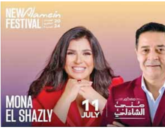
MONA EL SHAZLY 11 JULY MEDHAT SALEH

انتعاشة مسرحية.. ومناصفة ١٠ عروض مليئة بالنجوم انتعاشة مسرحية يشهدها مهرجان العلمين، في نسخته الثانية، حيث سيتم تقديم عشرة عروض، مليئة بالنجوم على مدار ثمانية أسابيع، وتعد