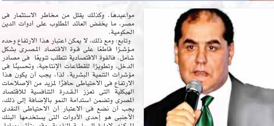
هاني أبو الفتوح

مواهبها، وكذلك يقلل من مخاطر الاستثمار في مصر، ما يخفف العبء المطلوب على أدوات الدين الحكومية. وتابع: ومع ذلك، لا يمكن اعتبار هذا الارتفاع وحده مؤشراً قاطعاً على قوة الاقتصاد المصري بشكل شامل، فالقوة الاقتصادية تتطلب توجعاً في مصادر الدخل، وتطويراً للقطاعات الإنتاجية، وتحسيناً في مؤشرات التنمية البشرية، لذا، يجب أن يكون هذا الارتفاع في الاحتياطي حافزاً لمزيد من الإصلاحات الهيكلية التي تعزز القدرة التنافسية للاقتصاد المصري وتضمن استدامة النمو بالإضافة إلى ذلك، يجب أن نضع في الاعتبار أن الاحتياطي النقدي الأجنبي هو إحدى الأدوات التي يستخدمها البنك المركزي لإدارة السياسة النقدية، وقد يتأثر بعوامل خارجية مثل تقلبات أسعار الصرف العالمية وأسعار السلع الأساسية، لذلك، يجب أن يكون هناك تقييم شامل لأداء الاقتصاد المصري يأخذ في الاعتبار جميع المؤشرات الاقتصادية والاجتماعية.