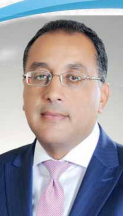
د. مصطفى مدبولي