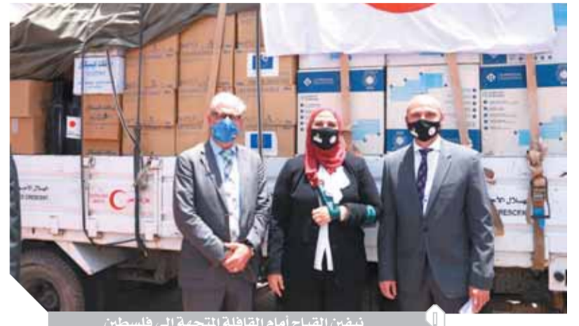
نيفين القباج أمام القافلة المتجهة إلى فلسطين