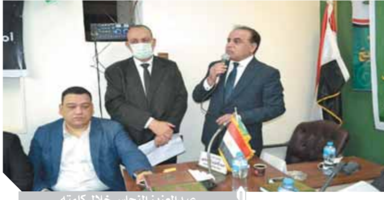
عبد العزيز النحاس خلال كلمته