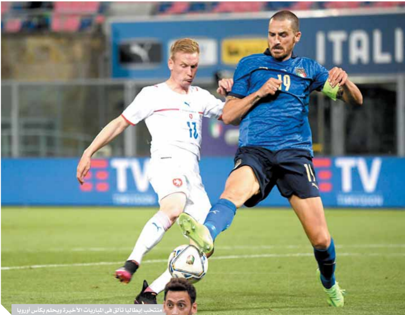
منتخب إيطاليا تائق في المباريات الأخيرة ويحلم بكأس أوروبا

مع دقات التاسعة مساء بتوقيت القاهرة، ستكون أنظار الملايين من عشاق كرة القدم حول العالم، متوجهة صوب ملعب «الأولمبيكو» في العاصمة الإيطالية روما، لمتابعة انطلاق بطولة الأمم الأوروبية «يورو ٢٠٢٠»، من خلال مواجهة قوية تجمع بين إيطاليا وتركيا، في الجولة الأولى من منافسات المجموعة الأولى. وتعود البطولة الأهم في العالم بعد المونديال للأضواء مجدداً، بعد أن حرمنا جأحة كورونا من إقامتها في العام الماضي، لتتأجل وتقام هذا العام بتنظيم مشترك للمرة الأولى بين ١١ دولة أوروبية ويتفاوت الحضور الجماهيري من دولة إلى أخرى. وسيكون منتخب إيطاليا هو صاحب ضربة البداية باستضافة حفل الافتتاح، وسط حضور جماهيري لن يتجاوز ١٦ ألف مشجع، في ظل الإجراءات الاحترازية التي يشدد عليها الاتحاد الأوروبي لكرة القدم «بيوفا»، وسيتم على الحضور إثبات حصولهم على لقاح كورونا من أجل دخول ستاد الأولمبيكو، وهو نفس الأمر الذي سيكرر في كافة ملاعب البطولة.