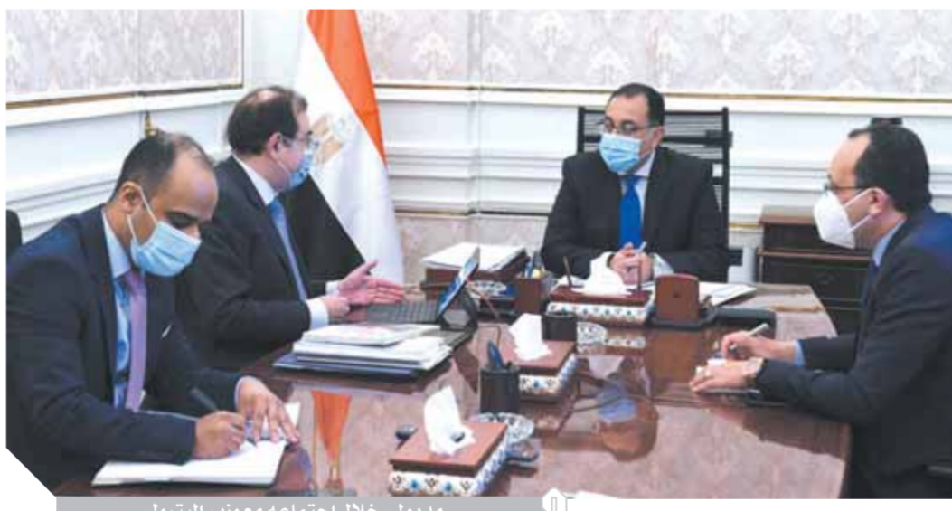
مديولى خلال اجتماعه مع وزير البترول

الأمير، وقد تم تنفيذ الشبكات الخارجية لعدد ٢٩٧١ مخبراً والتركيبات لعدد ٢٠٦٧ مخبراً وتم تحويل عدد ١٠٩٢ مخبراً للعمل بالغاز الطبيعي حتى ٣٠ يونيو ٢٠٢١. كما تطرق الوزير إلى التوسع في استخدام الغاز الطبيعي المضغوط لتموين السيارات، ومن ذلك تطور إنشاء محطات الغاز الطبيعي بالمحافظات، لافتاً إلى أن إجمالي المحطات المستهدف تشغيلها بالمشروع يبلغ ١٠٠٠ محطة، يبلغ عدد المحطات العاملة حتى تاريخه ٢٣٣ محطة، كما بلغ عدد مراكز تحويل السيارات للعمل بالغاز الطبيعي نحو ١٠١ مركز في يونيو ٢٠٢١، ويصل عدد السيارات المحولة حتى الآن ٣٦٢ ألف سيارة.