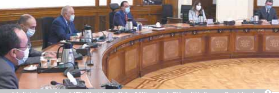
رئيس الوزراء يتابع جهود الهيئة العربية للتصنيع فى مجالات تعميق التصنيع المحلى ونقل التكنولوجيا

كما تناول رئيس الهيئة العربية للتصنيع الموقف الخاص بمشروع إنشاء أول مصنع لإنتاج الصلب المقاوم للصدأ، فضلاً عن مشروع تصنيع سيارة ميكروسيكس تويوتا هايس ١٤ راكباً (محرك بنزين/غاز طبيعي) للمشاركة فى مبادرة الدولة لإحلال السيارات القديمة، وكذا إقامة مصنع لإطارات المركبات.