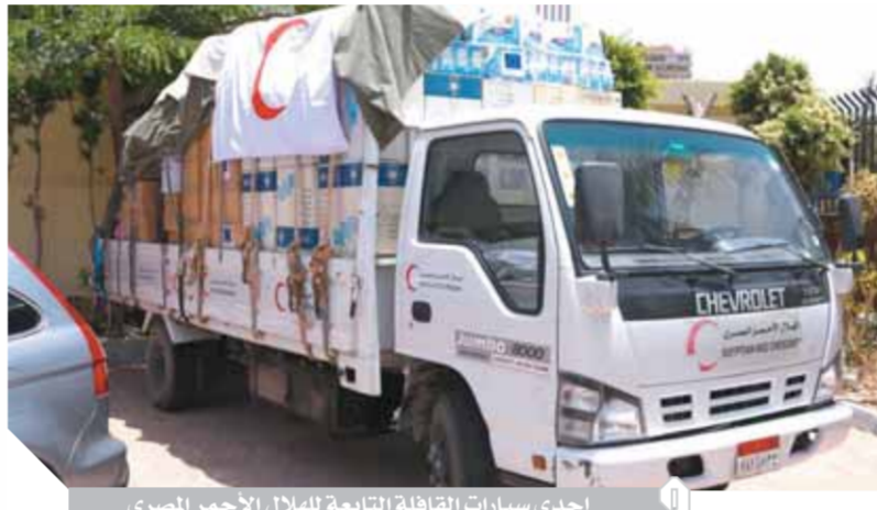
إحدى سيارات القافلة التابعة للهلال الأحمر المصري