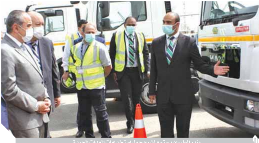
وزير الطيران يستمع لشرح حول استخدامات المعدات الجديدة

وفي هذا السياق قامت الشركة بشراء عدد ٢٧ معدة جديدة من