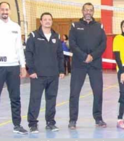
فريق سيدات وادي دجلة لكرة الطائرة