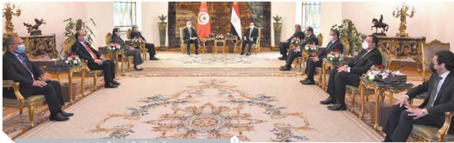
جانب من لقاء الرئيسين السيسي وسعيد

اتفقنا على إعلان عام ٢٠٢١-٢٠٢٢ عاماً للثقافة المصرية، التونسية P.3