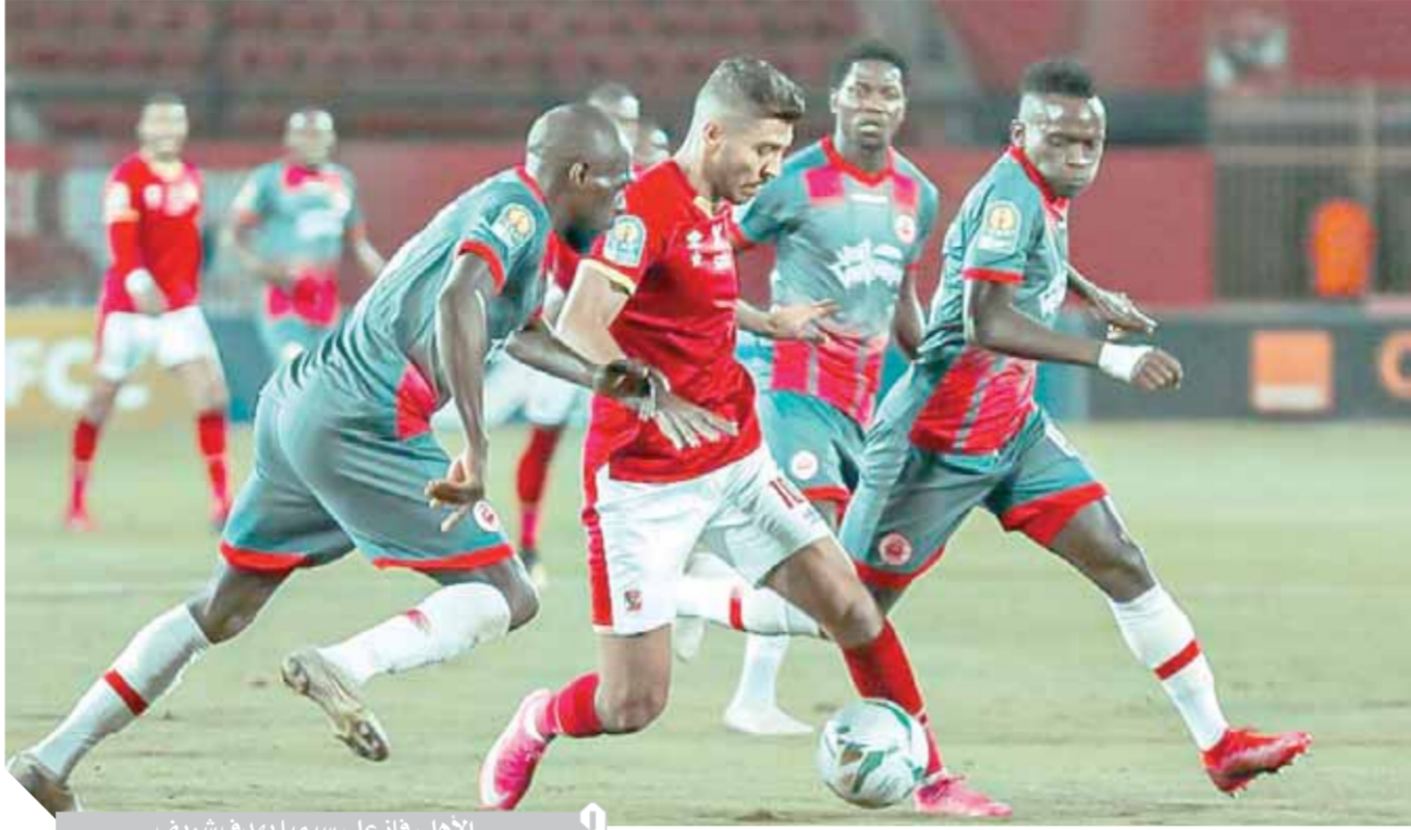
الأهلي فاز على سيمبا بهدف شريف