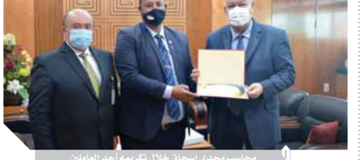
رئيس مطار القاهرة يكرم موظف أمن لخلق وأمانته

أمانة وحسن خلق وإتقانه لعمله وتأديته على الوجه الأكمل. يأتي هذا التكريم انطلاقاً من إيمان شركة ميناء القاهرة الجوية بالشورى وبصيرورة تحفيز المجتهدين من العاملين بمختلف قطاعات الشركة.