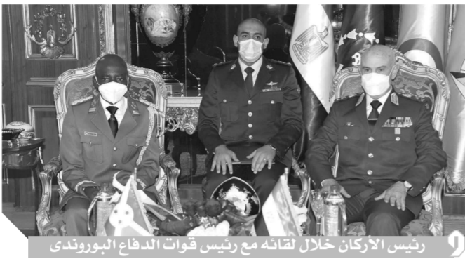
رئيس الأركان خلال لقائه مع رئيس قوات الدفاع البوروندى

الساحتين الإقليمية والدولية، ومناقشة عدد من الموضوعات ذات الاهتمام المشترك في ضوء مجالات التعاون العسكري، واختتمت الجلسة بتوقيع الجانبين على محضر الجلسة، كما قام رئيس أركان حرب القوات المسلحة ورئيس قوات الدفاع الوطنى البوروندى بالتوقيع على بروتوكول تعاون عسكري مشترك، والذي يتضمن التعاون في مجالات التدريب والتأهيل والتدريبات المشتركة بما يتيح تبادل الخبرات بين الجانبين، تأكيداً على توافق الرؤى تجاه الموضوعات التي تهم المصالح المشتركة للقوات المسلحة لكلا البلدين.