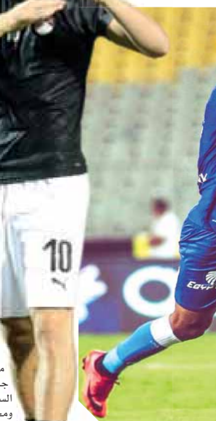
ساسى لم يحسم مصير تجديدده

الزمالك يمنح ساسي فرصة أخيرة للتجديد بعيداً عن مفاطلة وكيل أعماله