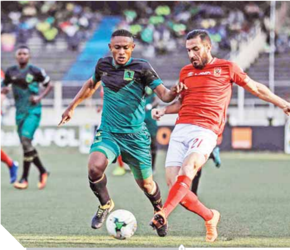
الاختبار الطبي يحسم مشاركة على معلول امام فيتا كلوب

ويسعى مسئولو الأهلى لوضع كافة الترتيبات الخاصة برحلة السفر إلى الكونغو وإتمام كافة الإجراءات الخاصة بالسفر وخوض ملاعب التدريب فى رحلة الفريق والتعرف القبل ثم خوض المران الرئيسى على ملعب اللقاء ثم خوض المباراة يوم الثلاثاء المقبل.