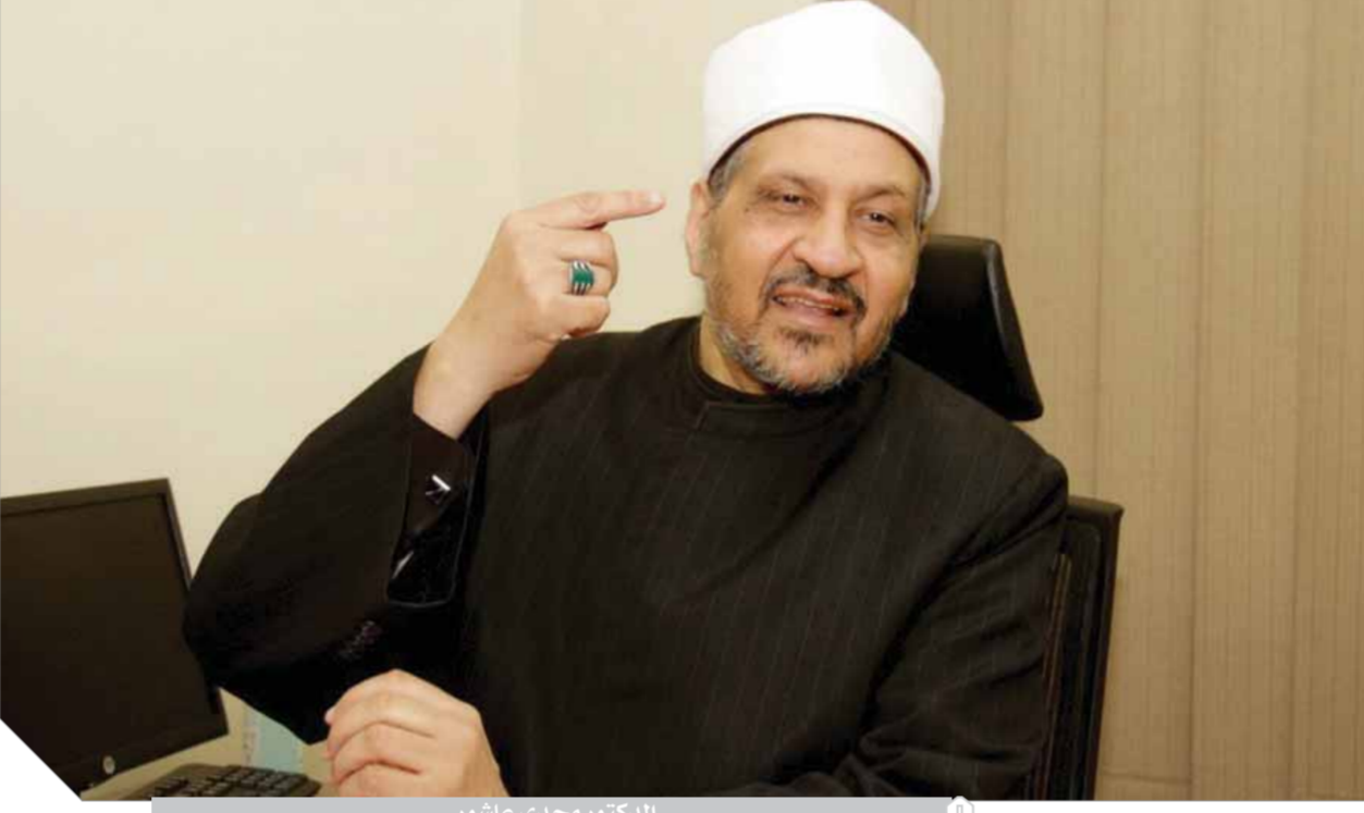
الدكتور مجدى عاشور