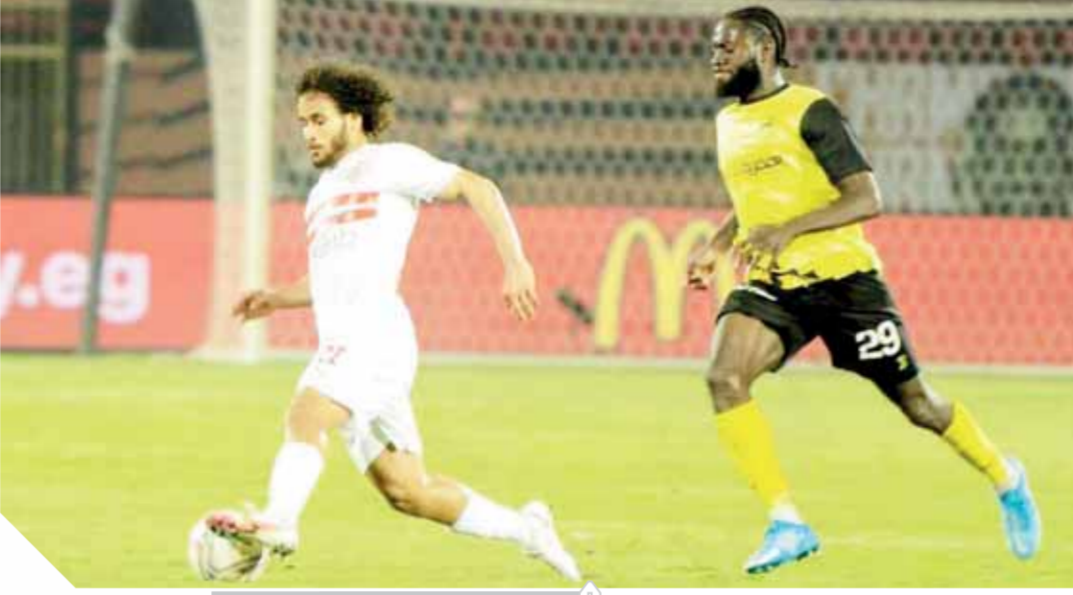
الزمالك فشل فى الفوز على وادى دجلة