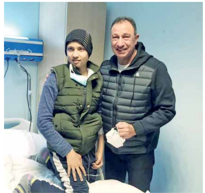
الخطيب يليبرغية محمد طلعت

قضت محكمة جناح قسم الأقصر أمس برئاسة المستشار مسكرتاربه جمال عمران، براءة جميع المتهمين فى القضية المعروفة إعلامياً بالتمتر ضد اللاعب الشهير محمود عبدالرازق شيكابالا - لاعب نادى الزمالك، فى القضية التى تحمل رقم رقم ١٤٠٨٧ لسنة ٢٠٢٠ جناح قسم الأقصر، ببراءة جميع المتهمين من الاتهام المسند إليهم، أثناء الاحتفالات بفيوز الأهلي على الزمالك فى نهائى دورى إفريقيا، التى تمت وقتها بميدان صلاح الدين بوسط مدينة الأقصر.