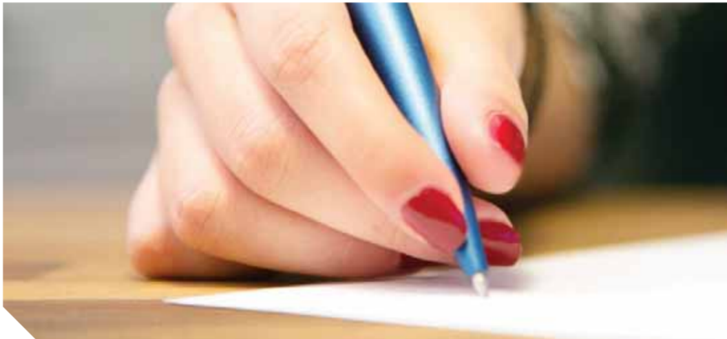
الأنامل الناعمة حققت نجاحات باهرة فى شركات العقار

عقارى يمثل نموذجاً لا يوجد ما يبرره مستدركا بالإشارة إلى عدم معرفته بالأسباب التى أفرزت هذه النتيجة مشدداً على أن كافة المعطيات لى مستوى الاستثمار العقارى تؤهل المرأة تماما