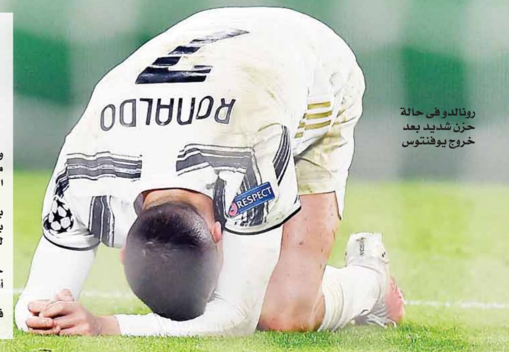
رونالدو فى حالة حزن شديد بعد خروج يوفنتوس

فتحت الصحف الإيطالية وبعض المدربين واللاعبين النار على فريق يوفنتوس عقب الخروج من دورى أبطال أوروبا أمام بورتو البرتغالى من دور الستة عشر. يوفنتوس ودع المسابقة رغم فوزه فى الاياب بنتيجة (٣-٢)، لكن الفريق البرتغالى تأهل بمجموع المباراتين (٤-٤)، مستفيداً بتسجيله لهدفين خارج أرضه. يوفنتوس هدفاً ثانياً قتل الامور تماماً، حيث سدده أوليفيرا لاعب بورتو، ركلة حرة من تحت أقدام كريستيانو رونالدو، سكنت شبك تشيرني. وشن فاييو كابيلو المدير الفني المحضرم ومحل قنوات سكاى سبورت، هجوماً شديداً على لاعبي