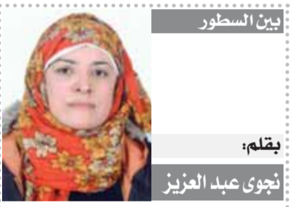
حب بعد الموت