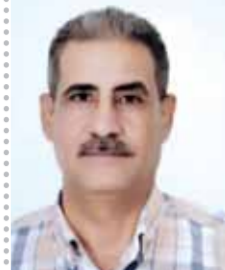
يقلم: منتصر سعد