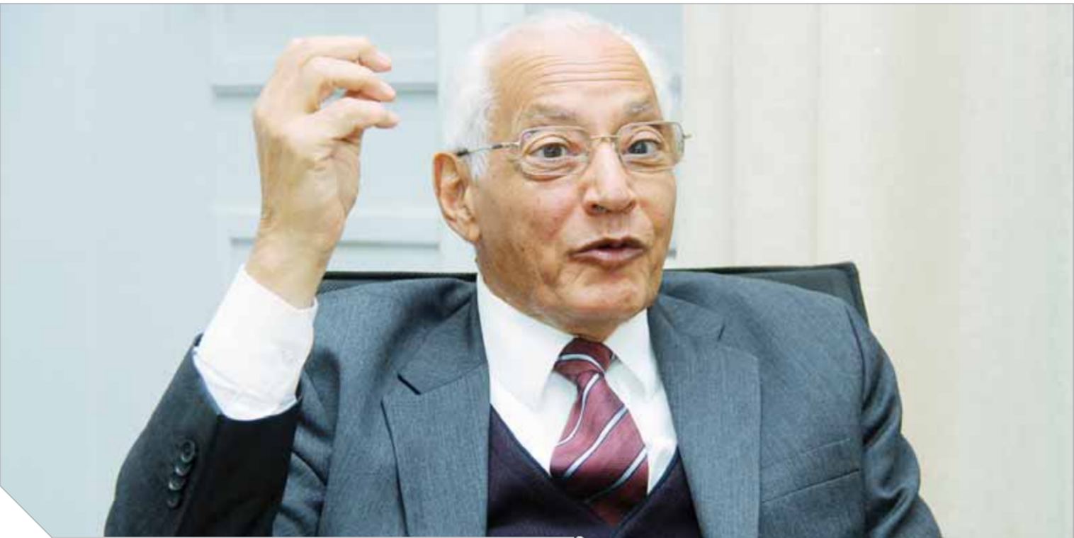
الدكتور على الدين هلال

حصل «هلال» على شهادة البكالوريوس من كلية الاقتصاد قسم العلوم السياسية بجامعة القاهرة عام ١٩٦٤ ثم درج للماجستير من جامعة مكجيل بكندا ١٩٦٨ ثم الدكتوراه من الجامعة ذاتها عام ١٩٧٣، إلى أن تريع على قمة أساتذة العلوم السياسية فى الوطن العربى وتولى عمادة كلية الاقتصاد والعلوم السياسية بجامعة القاهرة ١٩٨٦-١٩٩٤، كما شغل العديد من المناصب ونال عضويات لجان كثيرة منها أمين المجلس الأعلى للجامعات ١٩٩٢-١٩٩٤، ومقرر لجنة العلوم السياسية بالمجلس الأعلى للثقافة ٢٠١١ وعضو مجلس أمناء جامعة الأهرام الكندية وعضو مجلس إدارة المركز القومى للبحوث الاجتماعية