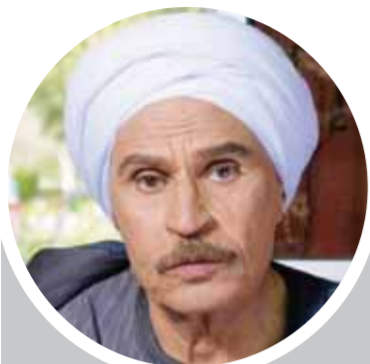
نجيب محفوظ جزء مهم في مسيرتى الفنية.. وشاهين مجنون فن