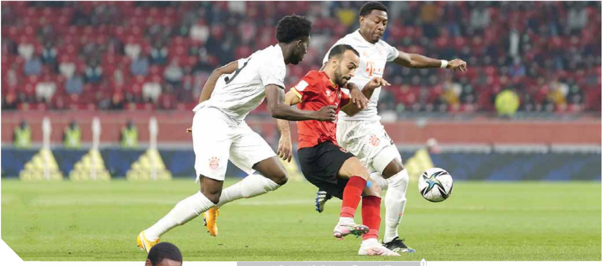
الأهلى يسعى لتصحيح أخطاء البايرون أمام بالميراس